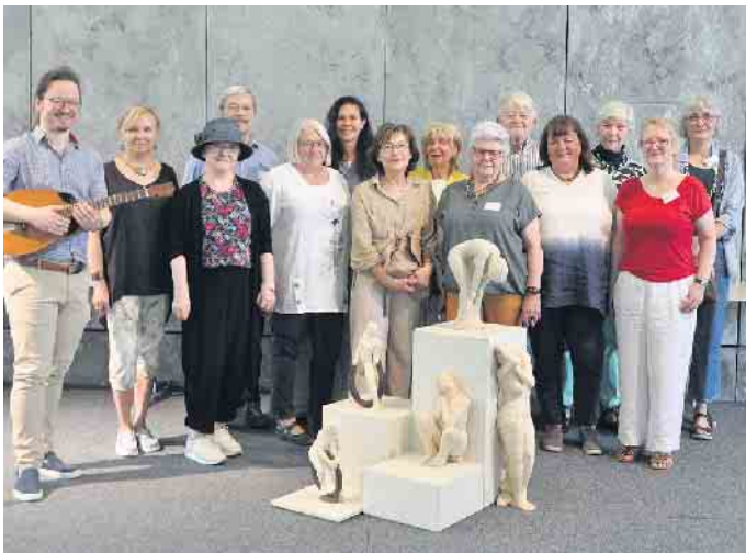
Über eine gelungene Jahresausstellung im Bornheimer Rathaus und die 3. Bornheim-Art im Mai konnten sich die KKV-Künstler freuen.