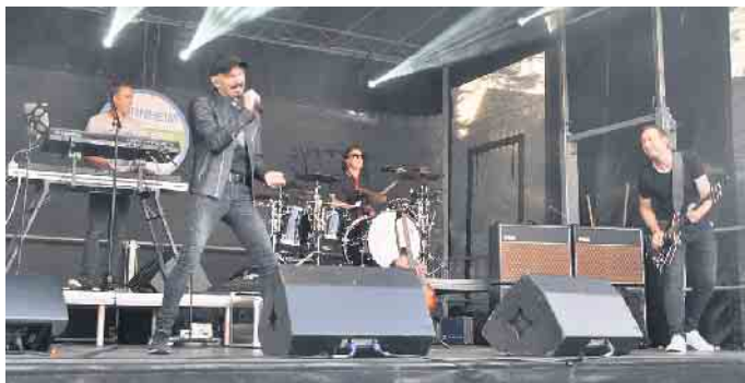
Auf der Showbühne lassen es auch dieses Jahr die Künstler wieder richtig krachen.