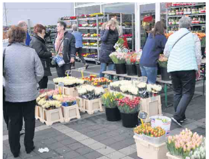
Ein reichhaltiges Angebot frischer Frühlingsblumen durfte bei den Frühlingsfesten nicht fehlen.