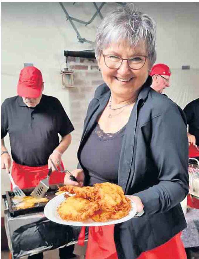
Bei solch leckeren und charmant dargebotenen Reibekuchen lacht das rheinische Herz und man kaum erwarten, genussvoll reinzubeißen