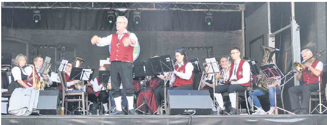
Die örtlichen Musikvereine sorgen mit ihren Konzerten für tolle Stimmung.