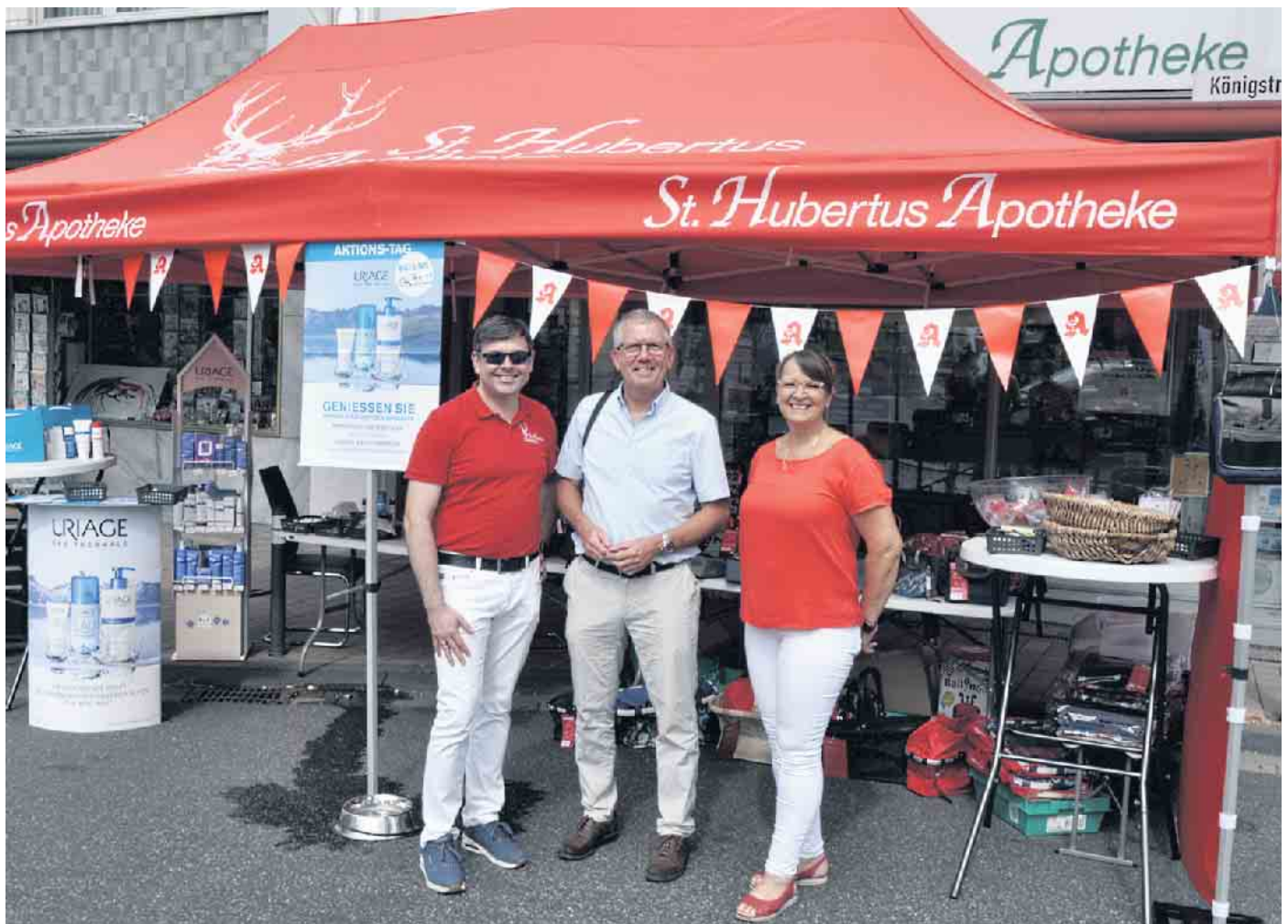
Bürgermeister Christoph Becker (Mitte) nutzt das Gewebefest gern, die teilnehmenden Geschäften zu besuchen und sich über deren Angebote und Wünsche zu informieren.

„Angeichts der sich ändernden Bedingungen möchten wir unseren Kunden und Gästen demonstrieren, wie vielfältig und qualitativ hochwertig das Angebot im Bornheimer Zentrum ist. Viele Besucher sind immer