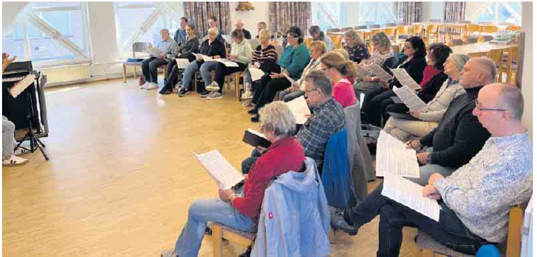
Der Walberberger Chor im Probenmodus.