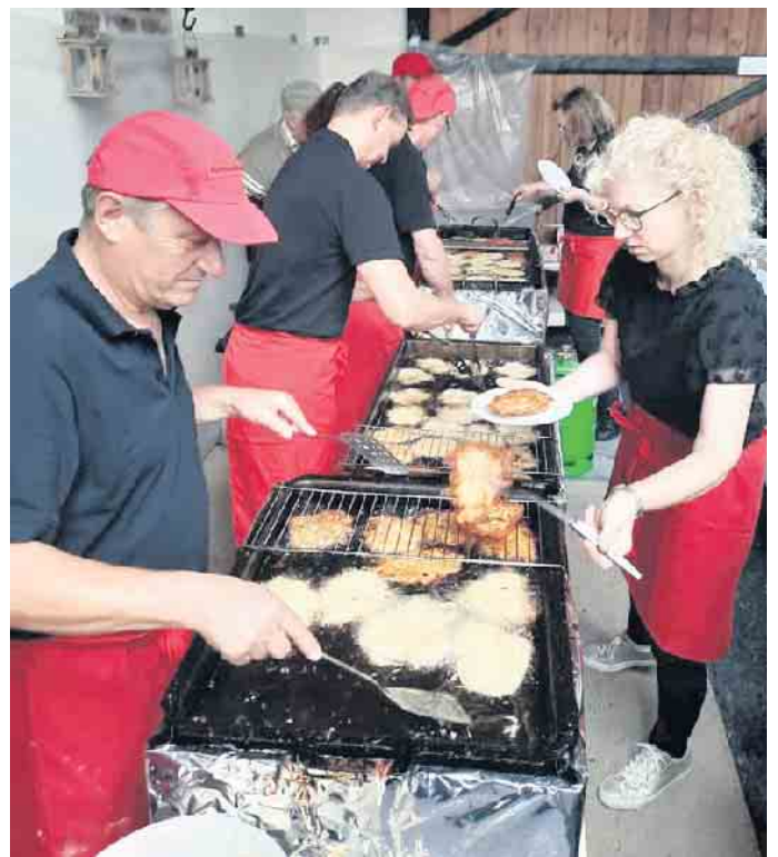
Mit viel Liebe, höchster Konzentration und großem Können ist das bewährte Rievkooche-Team am 29. August wieder im Einsatz.

Wenn der Wettergott mitspielt, wird es am 29. August wie in den vergangenen sein: Rappellvoll und ausgelassene Stimmung bei zünftiger fester und flüssiger Verpflegung. Mit Familie oder im Freundeskreis wird dieser hoffentlich lauschige Spätsommertag noch doppelt so schön. Für alle gilt: Wer Reibekuchen liebt, sollte sich den 29. August schon heute rot im Kalender anstreichen. (WDK)