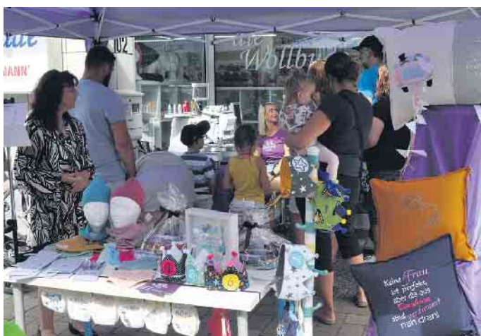
Am Tag der offenen Tür dürfen sich die teilnehmenden Geschäfte wieder auf großes Interesse freuen.

Sie werden mit vielen neuen Eindrücken, bester Laune und vielleicht dem einen oder anderen Geschenk oder Erwerb nach Hause gehen. (WDK)