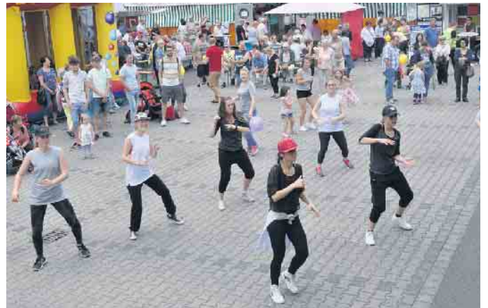
Die Mitmachangebote nutzen die Besucher der GewerbeFeste immer wieder gern.