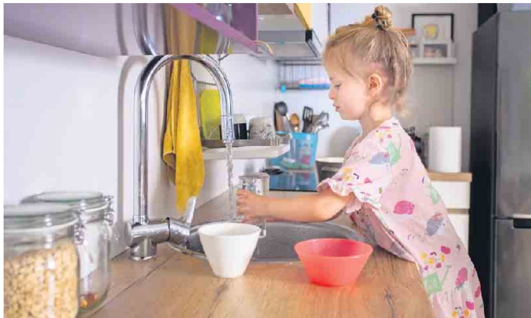
Wasser aus dem Hahn zu trinken, ist auch eine Frage der Gewohnheit.