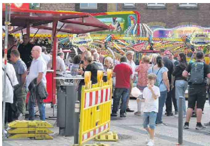
Kirmesspaß vom Feinsten warten auf Groß und Klein auf dem Peter-Fryns-Platz.