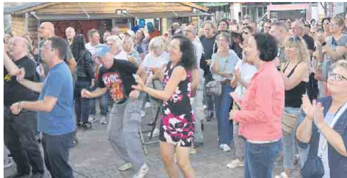
Mitreißende Musik-Acts finden ein begeistertes Publikum

Parallel lockt die Bornheimer Großkirmes auf dem Peter-Fryns-Platz die Besucher sogar von 11 bis 22 Uhr und das an allen vier Kirmestagen (30. August bis 2. September).