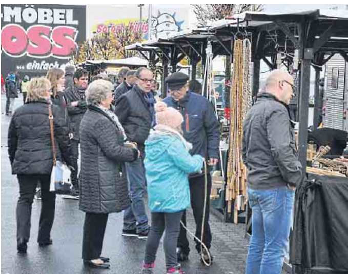
Gut besucht waren Jahr für Jahr die Budenstraßen bei den Martinimärkten auf dem Parkplatz vor dem Möbelhaus Porta.