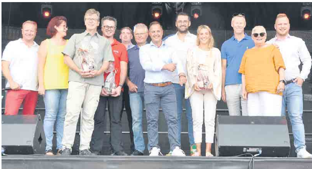
Repräsentanten des Gewerbevereins und aus Politik und Wirtschaft werden auch dieses Jahr wieder ein gelungenes „Bornheim Live!“ feiern können.

Komplettiert wird die Gewerbeschau durch die Automeile . Gezeigt werden viele Modelle, die die Herzen von Autofreaks höher schlagen lassen. Natürlich spielt Elektromobilität eine wichtige Rolle. Auf der Showbühne auf dem Peter-Fryns-Platz sorgen am Samstag ab 17 Uhr und am Sonntag am späten Nachmittag angesagte Bands für Stimmung. Vorher stellen sich Bornheimer Vereine vor und präsentieren ihre Angebot.