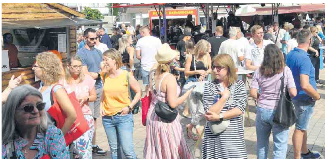
Dicht an dicht flanieren die Besucher in Bornheims City.