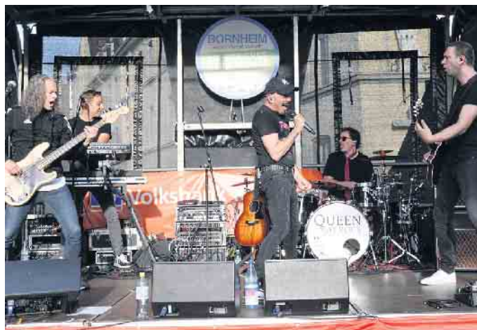
Wie im letzten Jahr ist „Queen May Rock“ der krönende Abschluss von „Bornheim Live!“ am Sonntagabend.