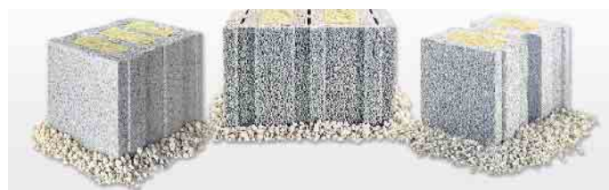
Leichtbetonsteine gelten aufgrund ihrer Massivität sowie ihrer porigen Struktur als wahre Schallschlucker.

ob im Ein- oder Mehrfamilienhaus, rundum vor Geräuschen aus Nebenzimmern und benachbarten Wohnungen geschützt. Ausführliche Informationen finden Interessierte in der kürzlich aktualisierten, kostenfreien Broschüre „Massives Plus an Schallschutz“. Diese steht etwa unter www.klb-klimaleichtblock.de in der Rubrik „Download“ bereit oder kann telefonisch unter 02632-25770 angefordert werden. (djd)