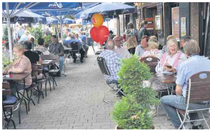
Für gemütliche Pausen laden die gastronomischen Betriebe und Stände zum Genießen und Plaudern ein.