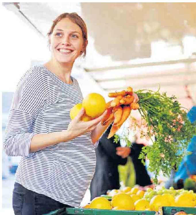
Ein gesunder Lebensstil kann das Risiko von Schwangeren, an einem Gestationsdiabetes zu erkranken, verringern.

messgeräte wie Accu-Chek Guide ermöglichen eine unkomplizierte und präzise Messung“, empfiehlt Dr. Segiet. „Und für die Dokumentation bietet sich ein digitales Tagebuch wie die mySugr App an. Die Werte wandern automatisch per Bluetooth in die App, wo zusätzliche Angaben wie Insulinabgaben, Nährwerte und sogar Mahlzeitenfotos ergänzt werden können.“ Die App stellt den Verlauf der Werte grafisch dar, dadurch lassen sich Zusammenhänge zwischen dem Lebensstil und den Blutzuckerwerten auf einen Blick erkennen. Frauen mit Gestationsdiabetes sollten für die Geburt eine Klinik mit angeschlossener Kinderklinik wählen, für Schwangere mit Insulinbedarf ist dies sogar Pflicht. Ein wichtiger Tipp für die Zeit nach der Geburt: Stillen ist nicht nur fürs Baby gesund, sondern kann laut Studien auch das Risiko eines späteren Typ-2-Diabetes der Mutter reduzieren. (djd)