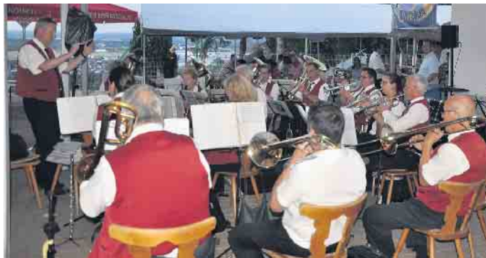
Traditionsgemäß sorgten die Roisdorfer Musikfreunde für Stimmung an den Schützenfesttagen.