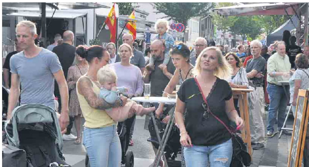
Auf einen viele Gäste hofft der veranstaltende Gewerbeverein Bornheim.

Die traditionelle Gewerbeschau richtet der Bornheimer Gewerbeverein am Sonntag, 3. September, in der Zeit von 11 bis 18 Uhr aus. Viele professionelle Aussteller werden sich und ihre Angebote auf der Königstraße präsentieren. Soziale und karitative Gruppen und Institutionen stellen ihre Anliegen und ihr ehrenamtliches En-