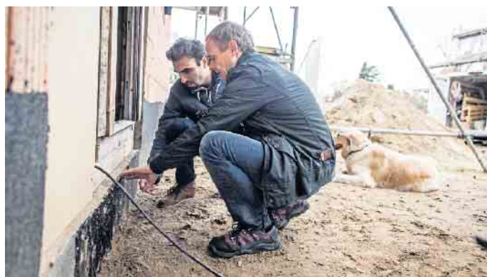
Wer bereits beim Bauen an Barrierefreiheit beispielsweise bei den Hauszugängen denkt, hat es später einfacher, das Haus an altersgerechte Bedürfnisse anzupassen.

Birkenweg 9 · 53347 Alfter fon 02 28 / 3 69 58 03 www.tobiasgregor.de