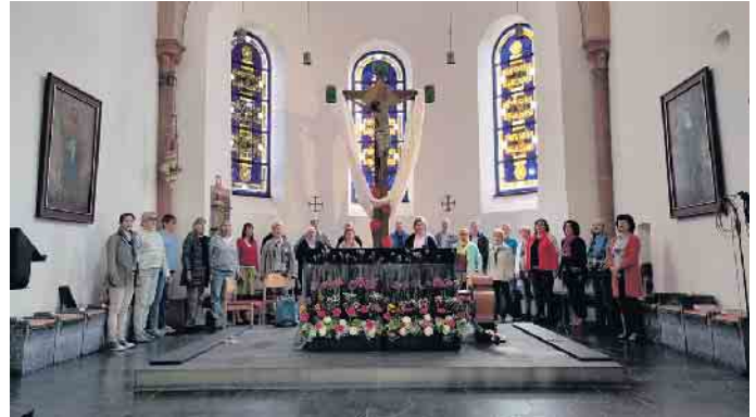
Der Chor bei einer Probe in St. Walburga.