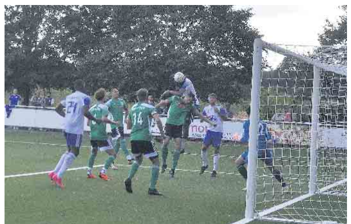
Die meisten der Gäste-Angriffe (weiß-blau) konnte die Heim-Defensive (grün-schwarz) unterbinden.