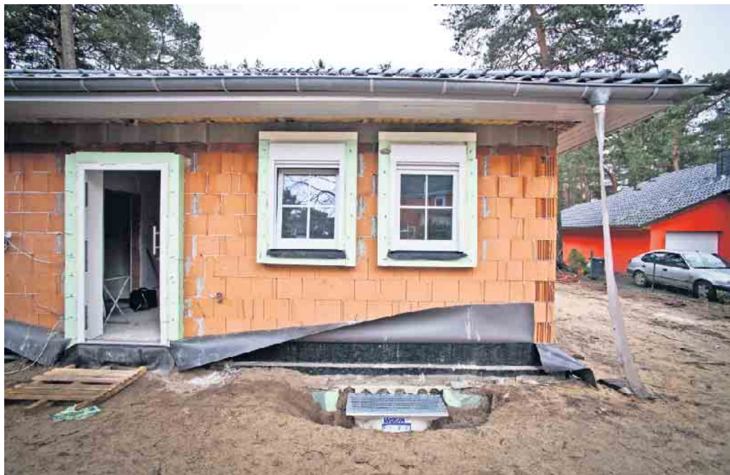
Ideal für ein selbstbestimmtes Leben in den eigenen vier Wänden bis ins hohe Alter: Wohnen auf einer Ebene.

Beim Zugang zum Haus rät Stange zu einer ebenerdig erreichbaren Eingangstür, die nicht erst im Alter, sondern auch für Kinderwagen die komfortablere Variante darstellt. Wo das nicht möglich