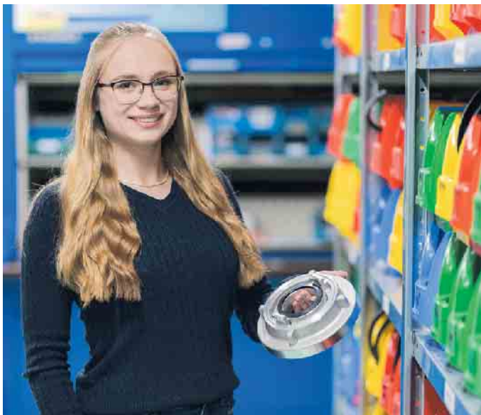
Kaufleute für Groß- und Außenhandelsmanagement sorgen für einen reibungslosen Warenfluss.