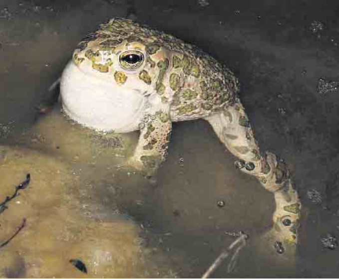
In Laichstimmung: Rufendes Wechselkröten-Männchen in einem Kleingewässer bei Hersel

LSV begrüßt Sand- und Kiesgewinnung in der Rheinebene