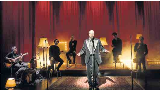
Unplugged - Schauspielhaus Bad Godesberg

Bald geht es weiter - das neue Programm der Theatergemeinde Bonn 2024/2025