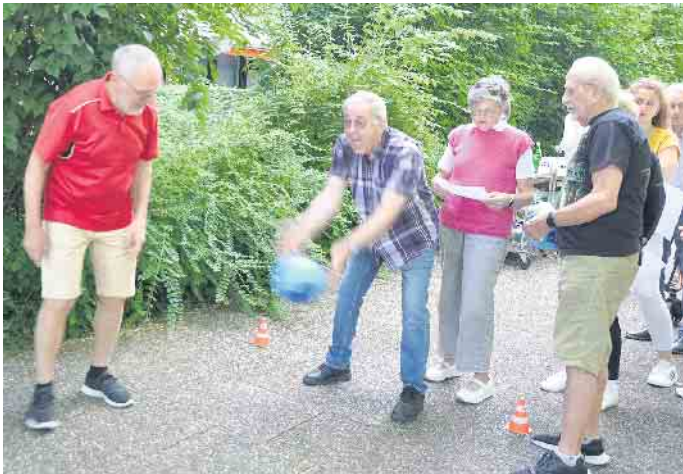
Eine der beliebtesten Stationen war das sogenannte Torwandschießen, egal, ob per Fuß oder Hand.

ven“ auf. Wir werden alles dafür tun, dass das 2027 ein außergewöhnliches Highlight sein wird.“ (WDK)