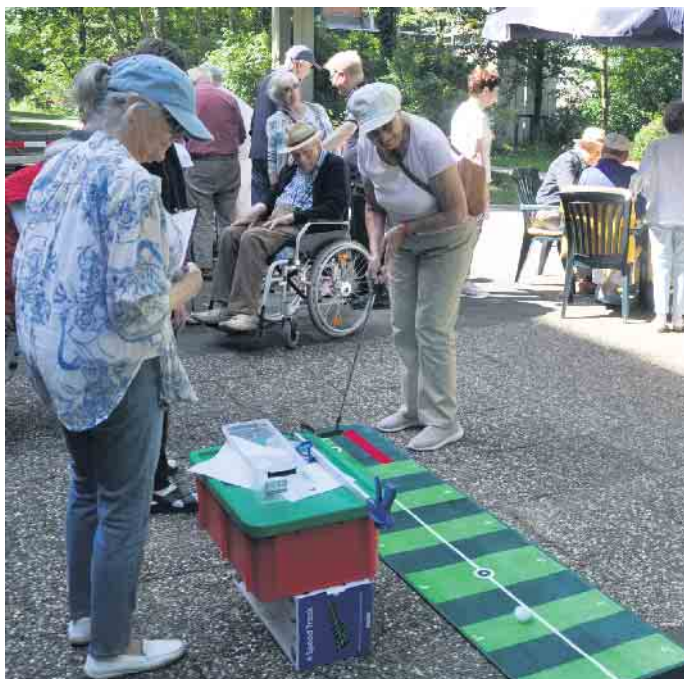
Ein gutes Auge und höchste Präzision waren beim Golfball-Putzen gefragt.

Begeisterte Teilnehmer beim 38. Seniorensportfest im Wohnstift Beethoven - Älteste Teilnehmerin war 98 Jahre alt