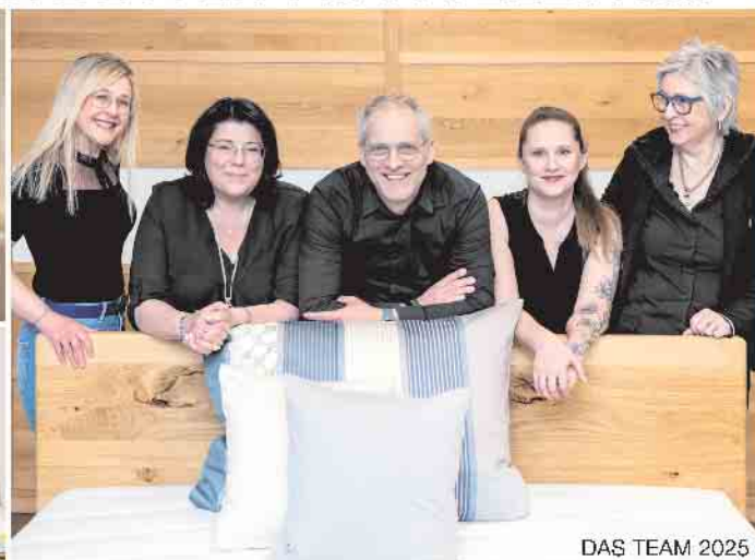
DAS TEAM 2025

Das Betten Meyers-Team freut sich auf Ihren Besuch (v.l.):