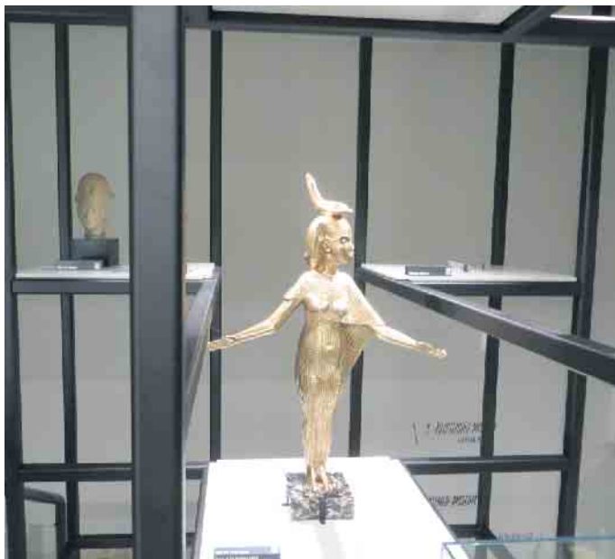
Skulptur im Treppenaufgang neues Museum

Ägyptisches Museum der Universität Bonn, Poststr. 26, 15 Uhr