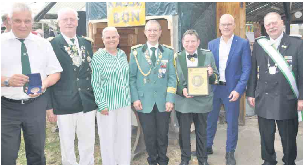
Anlässlich ihres 125-jährigen Jubiläums erhielten die Waldorfer Schützen hohe Auszeichnungen vom Land NRW und des Diözesanverbandes Köln.

Schützen aus Kardorf und Waldorf fusionieren - Erstes gemeinsames Schützenfest am 22./23. Juni