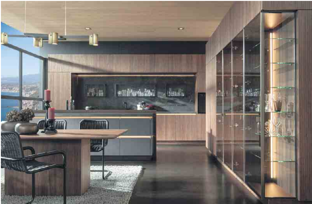
Ein einzigartiges Lichtspiel: Premiumküche mit viel Holz, Glas und gebürstetem Messing, die anhand einer patentierten Beleuchtungslösung perfekt zur Geltung kommen. Ein besonderer Blickfang sind die Vitrinenschränke.

Wenn man sich seine neue Traumküche vorstellt, denkt man zunächst an Echtholz oder ein schönes Dekor und einen attraktiven Uni-Farbtönen. Der Trendwerkstoff Glas kommt vermutlich seltener vor, obwohl er überall in der Küche und nicht nur dort eingesetzt wird. Wo Echtholz nicht die erste Wahl ist, kommt Glaslaminat ins Spiel, das vom Original so gut wie kaum zu unterscheiden ist.