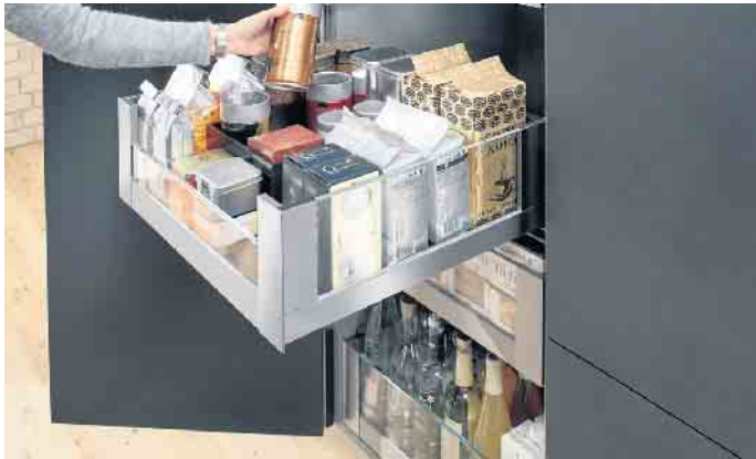
Glas spielt auch bei der Innenausstattung eine wichtige Rolle wie z. B. bei diesem Vorratsschrank, in dem sich viel übersichtlich verstaut lässt. In Auszügen mit Glaseinschubelementen sind die Inhalte schnell identifiziert.

Aufgrund ihrer hohen Kratzbeständigkeit sehen die farb- und UV-stabilen Oberflächen auch noch nach Jahren top aus. Darüber hinaus sind sie gegen Fingerabdrücke unempfindlich. Und wenn sie zusätzlich mit einer magnetischen Funktion ausgestattet sind, können sie auch