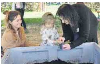
Mit großer Begeisterung waren die Kleinen beim Pflanzen von Kräutern beim Biohof Bursch dabei.