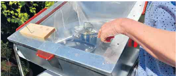
Blick in eine Solarkochbox