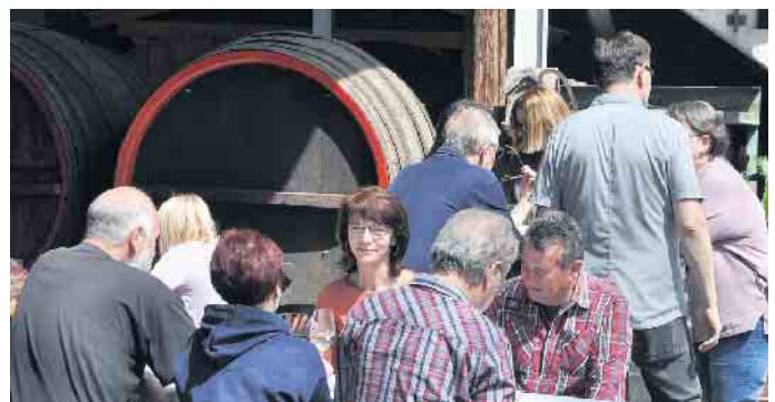
Egal ob weiß, rosé oder rot - bei Weinen von der Kellerei Antwerpen ließ sich prima chillen und plaudern.