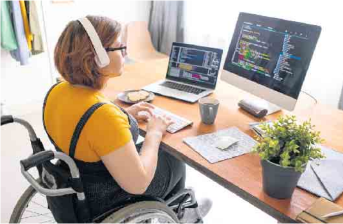
Menschen mit Behinderung können im Job genauso glücklich werden wie Nicht-Behinderte auch.

Menschen mit Behinderung als gern gesehene Job-Bewerber