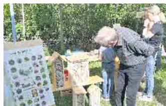
Alles Wissenswerte über Bienen und Insekten vermittelten die Experten am Kardorfer Bienenhaus.