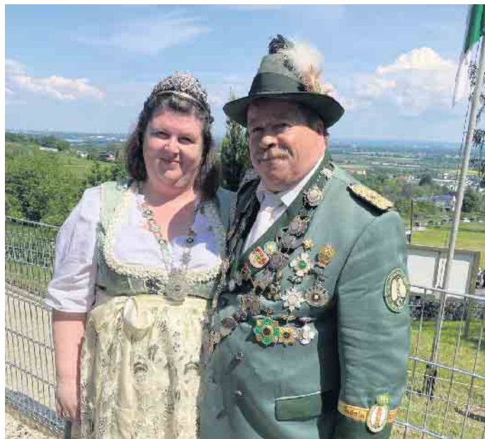
Unser noch aktives Schützenpaar

Der Schützenverein Sankt Sebastianus 1849 e.V. freut sich auf euren Besuch und ein paar gesellige Stunden.