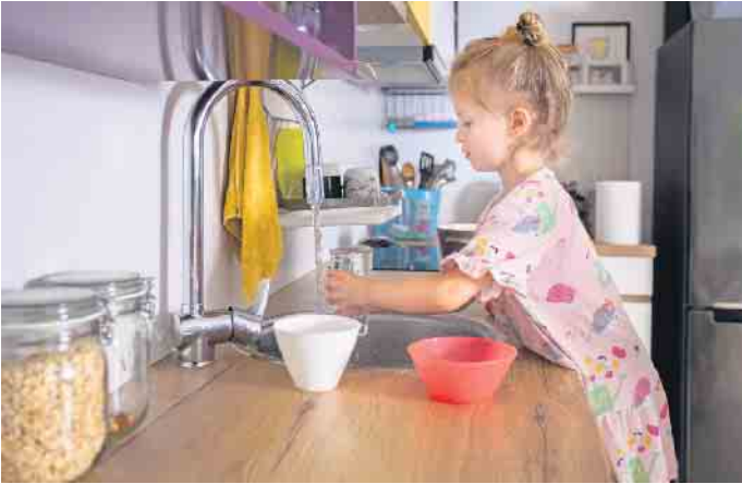
Wasser aus dem Hahn zu trinken, ist auch eine Frage der Gewohnheit.

Umfrage: Regelmäßiger Konsum von Wasser aus dem Hahn ist deutlich gestiegen