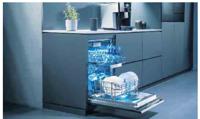
Dieser vernetzte, vollintegrierte Premium-Spüler punktet mit einer bis zu dreimal schnelleren Programmlaufzeit, einer speziellen Zone für wertvolle Gläser, ansprechenden Innenbeleuchtung und Option zum Abspeichern der individuellen Lieblingskombination aus Spülprogramm und Zusatzoption.