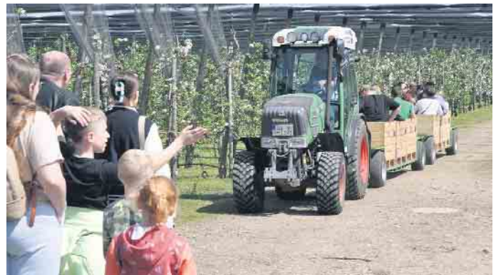
Die Treckerfahrten in die Apfelplantagen waren beim Obstbaubetrieb Schmitz-Hübsch der Renner.