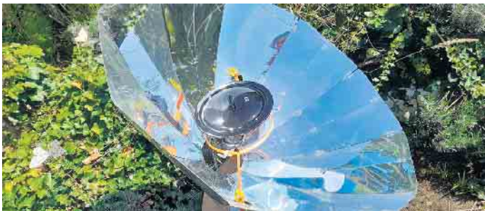
Modell Parabolspiegelkocher.