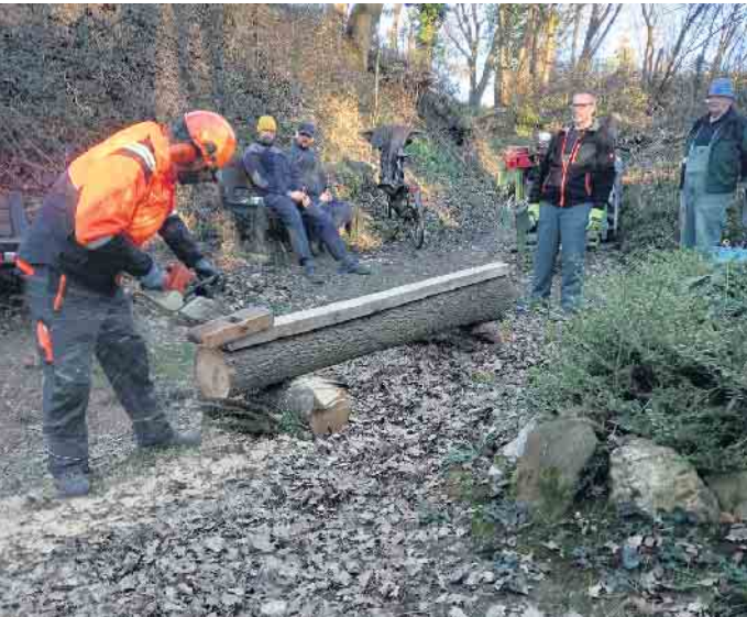
Ein Eichenstamm der Umgebung wird vor Ort mit einem speziellen Verfahren in zwei Hälften getrennt, die in die Bank eingefügt werden. Nach mehrstündiger Arbeit war die Sitzbank vor dem Bildstock wiederhergestellt.

Das Muttergotteshäuschen, ein bekannter Marienbildstock, liegt in einer schmalen Schlucht, die die Hochfläche des Hennesenbergs mit dem Mühlbachtal verbindet und dabei eine markante Abbruchkante der Ville durchquert. Das Muttergotteshäuschen wurde vor nunmehr 111 Jahren im Juli 1914 anlässlich des bevorstehenden ersten Weltkriegs errichtet und ist seitdem eine Pilgerstätte für Breniger und Bornheimer Einwohner aber auch für Besucher von außerhalb, die dort aus Dankbarkeit gegenüber der Gottesmutter Kerzen aufstellen. Die Frauengemeinschaften Brenig und Bornheim veranstalten nach Absprache jedes Jahr im Marienmonat Mai Pilgerprozessionen zum