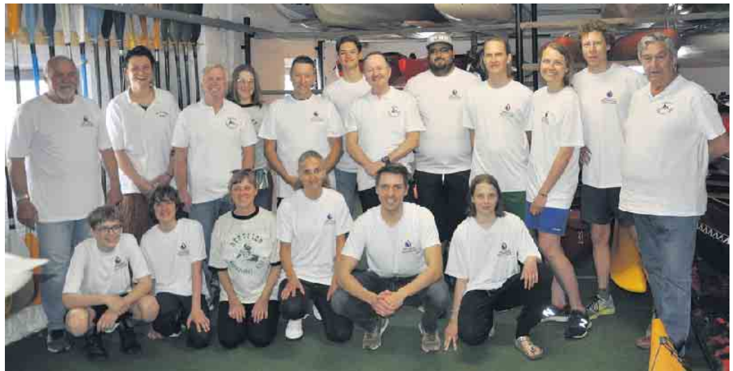
Zurückgekehrt vom Anpaddeln freuten sich die HWV-Aktiven über die gesponserten neuen Trainings-T-Shirts und Polohemden.

Mai führte von Bad Honnef zum Herseler Rheinufer. Bei der rund dreieinhalbstündigen Tour bei bestem Wetter kam es für die 20 Paddler in ihren zwölf Booten zu einem unvergesslichen Erlebnis: Ihnen kam das Uboot, dass rheinaufwärts zum Technikmuseum in Sinsheim gebracht wurde, entgegen. „Dadurch, dass viele Menschen den Uboot-Transport vom Ufer aus verfolgten, hatten wir plötzlich jede Menge Fans, als sich unsere Wege kreuzten“, berichtete augenzwinkernd einer der Teilnehmer. Problematisch war die Begegnung aber für die Paddler nicht.