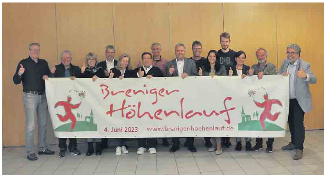
Organisatoren und Sponsoren freuen sich, dass nach drei Jahren Corona-Pause der Breniger Höhenlauf in diesem Jahr wieder stattfinden kann.

Das Laufevent beginnt um 11 Uhr auf dem Gudula-Clasen-Platz mit dem Bambini Lauf (400 Meter), dem sich 20 Minuten später der Kinderlauf (1.000 Meter) anschließt. Um 12 Uhr starten die Schüler (2.000 Meter) bevor um 12.30 Uhr das Startsignal für die beiden Hauptläufe über 5.000 und 10.000 Meter ertönt. Um 14 Uhr werden dann die Gesamt- und Klassensieger sowie die Stadtmeister geehrt. An diesem gemeinwohlorientierten Laufergebnis können Jung und Alt teilnehmen, die in ihrer Freizeit oder auch professionell sportlich unterwegs sind. Aus Zeitgründen wird es dieses Mal keine Walking-Gruppe geben. Die Wesseling-Sambagruppe „Rheinsamba“ wird den Läufern, die von den zahlreich erwarteten Zuschauern sicherlich mächtig angefeuert werden, mit