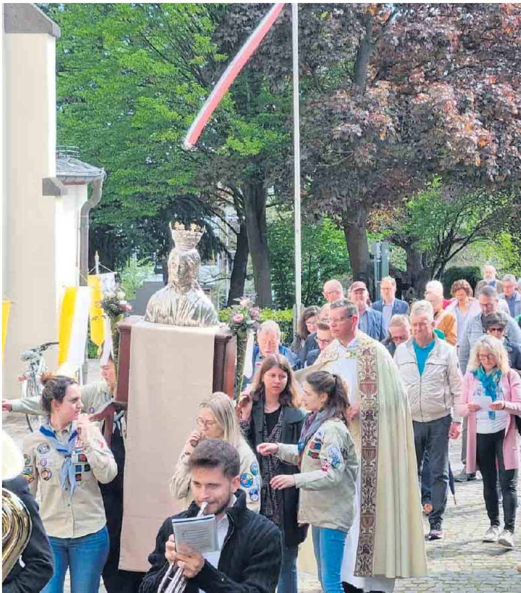
Die Walburgaprozession erreicht die Pfarrkirche St. Walburga.

Walberberg. Auch dieses Jahr lockte die Walburgawoche viele Interessierte an. Den Auftakt bildete die Lichterprozession, die sich nach einer Andacht am Schwadorfer Kreuz zur Pfarrkirche St. Walburga schlängelte. Dienstags waren Maianacht und Hl. Messe gut besucht. Mittwochs machte sich eine Gruppe Frauen und Männer auf einen von der Abendsonne beschienenen Spaziergang mit biblischen und literarischen Impulsen auf. Auch zur Schnupperprobe des Kirchenchores St. Cäcilia fanden sich Interessenten ein, nachdem am Nachmittag schon Kinder kreativ gewerkelt hatten. Ein Höhepunkt war das Konzert des Aulos-Flötenquartetts am Freitag der Woche, das großen Zuspruch fand. Samstagnachmittag startete dann der Reisebus mit einer Gruppe zur Exkursion auf den Spuren der Lokalheiligen Lufthildis in Lufelberg mit Kirchenführung. Die Woche mündete in das Maifest mit Festgottesdienst und traditioneller Reliquienprozession am Sonntag, bei der die Georgs-Pfadfinder die silberne Walburga-Büste durchs Dorf trugen. Anschließend vergnügten sich noch viele Gemeindemitglieder im Haus im Garten und im Pfarrgarten. Am Nachmittag klang das Fest aus, rechtzeitig bevor der Regen einsetzte.