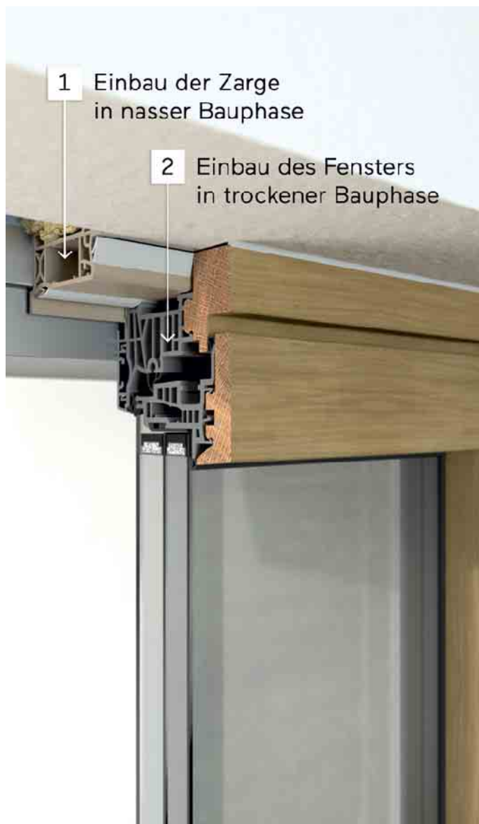
Ein zweistufiger Festereinbau mit Einbaurahmen bietet viele Vorteile.

Einbaurahmen, auch Zargen genannt, sind ein immer wichtiger werdendes Tool bei der Montage von Fenstern. Die Fenster müssen damit nicht schon im Rohbau eingebaut, sondern können in einer späteren Bauphase montiert werden. Bauherren profitieren nicht nur vom reibungslosen Einbau der hochwertigen Bauteile - langfristig sind zweistufige Montagekonzepte sogar um zehn Prozent kostengünstiger, berichtet der Verband Fenster und Fassade (VFF). Üblicherweise werden Fenster beim Hausbau sehr früh in der sogenannten nassen Rohbauphase montiert. Die Gefahr, dass die neuen Fenster durch andere Ge-