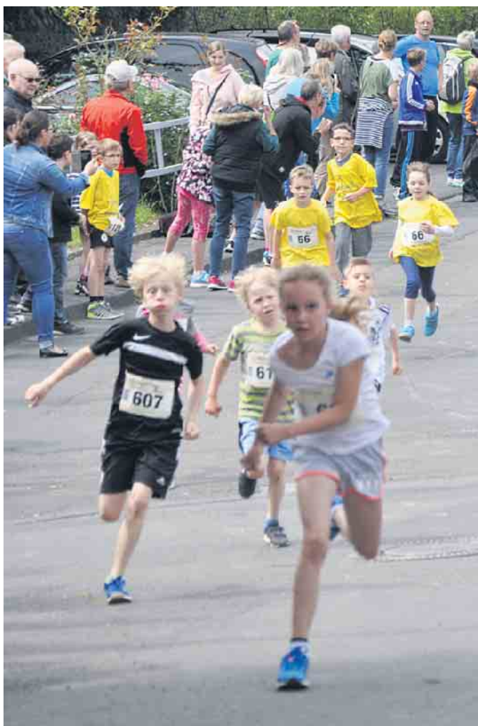
Angefeuert von Eltern, Freunden und Zuschauern werden auch dieses Jahr wieder die Kinder und Jugendlichen auf die Laufstrecke gehen und ihr Bestes geben.

Wer am Höhenlauf teilnehmen möchte, kann sich ab sofort bis einschließlich 3. Juni auf der Website www.breniger-hoehenlauf.de anmelden. Nachmeldungen sind noch am Wettkampftag ab 9.30 Uhr bis 30 Minuten vor dem Start des jeweiligen Laufes möglich. Auf der Website können später auch die Ergebnislisten eingesehen werden. (WDK)