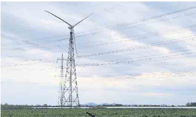
135 Meter hoch reichen die Rotorspitzen der Wesseling Windräder, 250 Meter hoch sollen die Rotorspitzen der Bornheimer Anlagen reichen.

zen würden bis 150 Meter hoch reichen. Der Kölner Dom ist gut 157 m hoch. Experten des LSV-Arbeitskreises Windenergie beantworteten zahlreiche Fragen der Radler zur städtischen Planung. LSV-Vize Norbert Brauner: „Viele Teilnehmer äußerten ihr Unverständnis für eine solche Planung inmitten einer bisher von Natur und Landwirtschaft geprägten unbelasteten Landschaft im Herzen des Naturparks Rheinland.