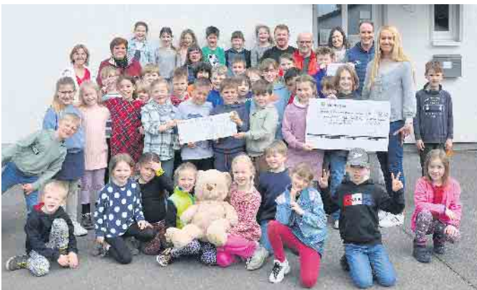
Gemeinsam freuten sich die Kinder der Kölsch AG und die Vertreter der beschenkten Initiativen bei der Spendenübergabe