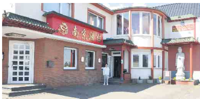
Die imposante Front im chinesischen Style macht Lust auf einen Besuch im NAN KING, um sich dort kulinarisch verwöhnen zu lassen.

Dienstag - Samstag: 11.30 - 15.00 Uhr + 17.30 - 23.00 Uhr Sonn- + Feiertage: 11.30 - 23.00 Uhr Montags: Ruhetag (außer an Feiertagen)