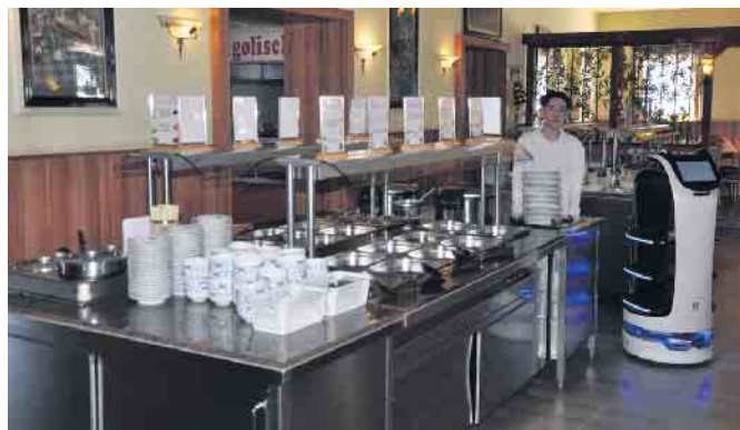
Der großzügige Büffetbereich ist ein Kernstück des NAN KING. Und ein Roboter unterstützt das freundliche und fachkundige Personal bei der Erfüllung der Gästewünsche.