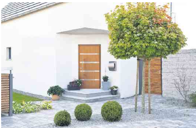
Natürlich anmutende Tür in modernem Design.

Reine Funktionalität, um ins Haus und nach draußen zu gelangen, war gestern - Immer mehr Bauherren sehen die Haustür als elementares Gestaltungselement der eigenen vier Wände, berichtet der Verband Fenster und Fassade (VFF). Folgende Faktoren haben Einfluss auf die Auswahl der passenden Tür.