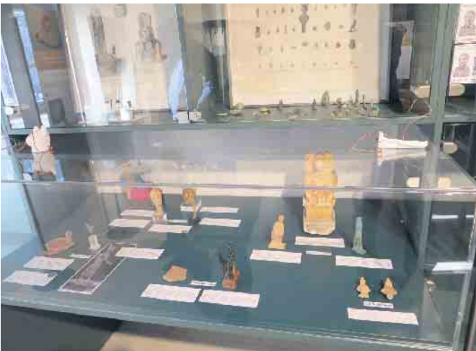
Objekte zur Herodot-Ausstellung

Seit Oktober ist das Ägyptische Museum der Universität Bonn nun am neuen Standort in der Poststraße 26 (P26) in Bonn. Die Eröffnungsausstellung „Eine Zeitreise am Nil - Ägypten in Bonn“ ist unbedingt einen Besuch wert. Mit rund 1.000 Exponaten bietet sie ein kulturhistorisches Panorama mit einigen Highlights, die in keinem anderen Museum außerhalb Ägyptens zu sehen sind. Nun folgt die erste Sonderausstellung im P26. Der Titel lautet: