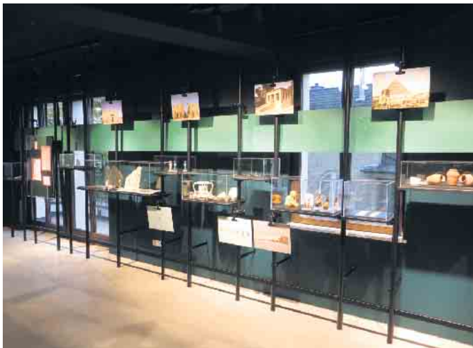
Eingangsbereich des neuen Museums

lung ist bis zum 30. Juni verlängert worden. So hat man in Bonn die Gelegenheit, virtuell mit Herodot den Nil zu bereisen, die altägyptische Mythologie zu erkunden - und gleichzeitig die Sicht auf das Fremde zu hinterfragen. Das ermöglicht eine Wanderausstellung, die Studierende der Universitäten Bonn und Kiel im Rahmen eines interdisziplinären Projekts erarbeitet haben, in dessen