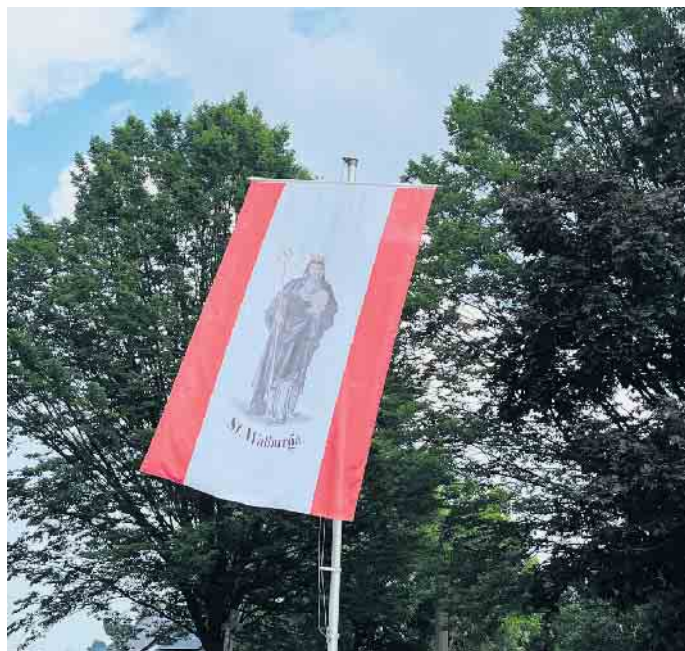
Walberberg lädt zur Walburgawoche 2025