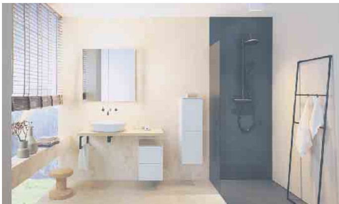
Mit den richtigen Möbeln werden Badezimmer dauerhaft sicher und komfortabel zum individuellen Wohlfühlort.

So habe der Endverbraucher schon beim Möbelkauf ein gutes Gefühl - und später im Wohlfühl-Badezimmer sowieso. (DGM/FT)