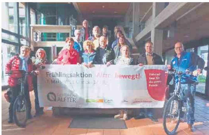
Repräsentanten der Gemeinde, der teilnehmenden Betriebe und Partner präsentierten die 14. Frühlingsaktion „Alfter bewegt“ im Alfterer Rathaus.