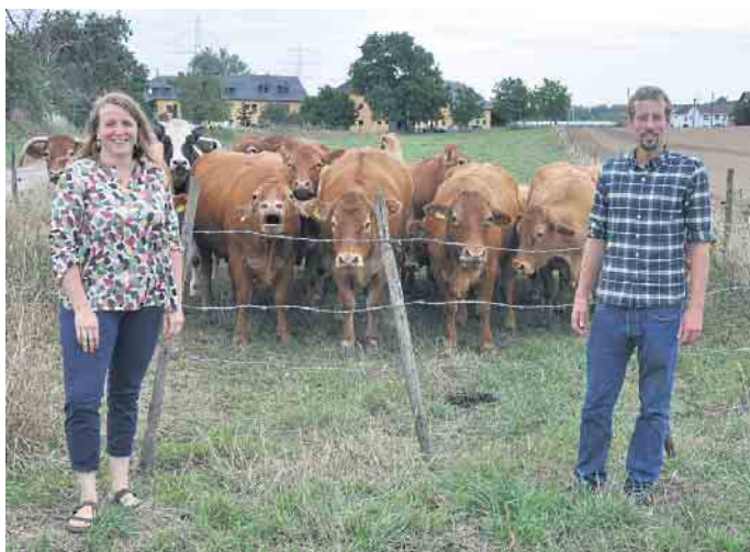
Erstmals ist die Rinderzucht Hof Frizen (Burg Ramelshoven) bei der Frühlingsaktion dabei.