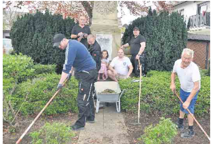
MV-Mitglieder und Freunde waren am 22. April rund drei Stunden im Einsatz.