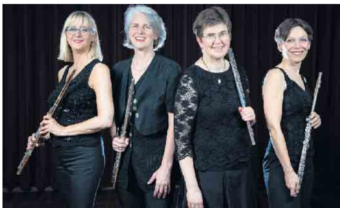
Das Aulos-Quartett gastiert in St. Walburga.

im Garten an: „Wir begegnen Jesus kreativ“. Ebenfalls am Donnerstag um 19.30 Uhr wird zur Schnupperprobe beim Kirchenchor (Haus im Garten) geladen. Musikalisches Highlight ist am Freitag, 5. Mai, um 20 Uhr ein Konzert in St. Walburga. Es gibt große Musikwerke für Flöten mit dem bekannten Aulos-Flötenquartett unter dem Titel „Flötenklang und Zauberwesen“. Der Eintritt ist frei, Spenden willkommen. Am Samstag, 6. Mai, startet um 14 Uhr ab Kirmesplatz eine Exkursion nach Lüftelberg, um mehr über die Verehrung der hl. Lufthildis zu erfahren. Geplant ist zudem die Einkehr in einem Hofcafé und ein Abstecher zur Wallfahrtskirche in Buschhoven (Anmeldung erforderlich: 2227/81359). Höhe- und Endpunkt der Woche ist am Sonntag, 7. Mai, um 9.30 Uhr die Hl. Messe