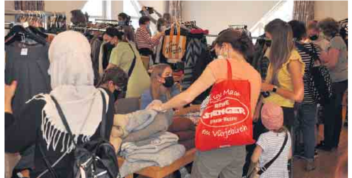
Das Flohmarkt-Team hofft wieder auf einen großen Zuspruch im Mertener Pfarrzentrum, wie im Herbst letzten Jahres.