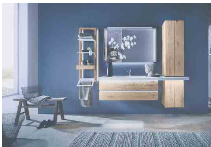
Beim Design und Material von geprüften Badezimmermöbeln bieten sich Endverbrauchern heute viele verschiedene Möglichkeiten.