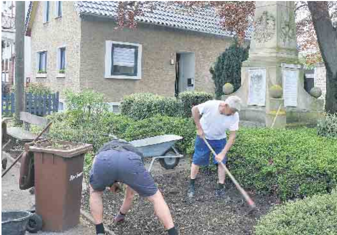
Es gab viel zu tun, um das Denkmal-Umfeld auf Vordermann zu bringen.

Männerverein reinigte Kriegerdenkmal - Brauchtumpflege wird großgeschrieben