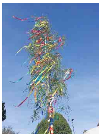
Von Kindern bunt geschmückt

Vebringt mit uns einen gemütlichen Nachmittag und Abend bei Essen, Trinken und guter Laune. Die Tanzmariechen der K.G. werden an diesem Abend für euch tanzen. Wir freuen uns auf euren Besuch.