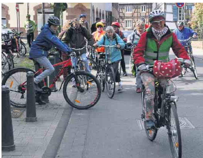
Traditionsgemäß startet die Fahrrad-Tour vor der Öffentlichen Bücherei am Hertersplatz in Alfter-Ort.