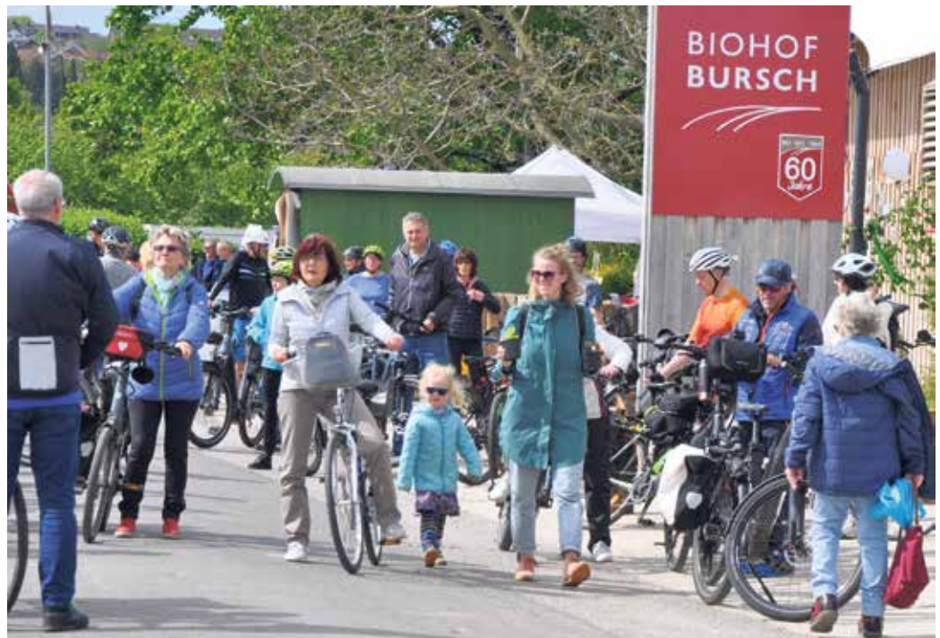
Der Biohof Bursch in Waldorf wird Jahr für Jahr gern von den Teilnehmern angefahren und besucht.

Der Agrarhandel Norbert Wirtz (Keldenicher Straße 2b, Sechtem) hat sich zu einem Landhandel mit Tier- und Gartenmarkt entwickelt und ist so Bindeglied zwischen Großerzeugern, Selbstversorgern und Haustierhaltern. Mit einer Reihe von regionalen Partnern stellt er seine umfangreiche Angebotspalette vor. Ein Saatgut-Sortiment mit über 750 verschiedenen Gemüse- und Blumensorten und Vorträge über die richtige Garten- und Rasenpflege runden das Angebot ab. Weitere Attraktionen sind eine Craftbeer-Brauerei, Oldtimer-Traktoren, eine