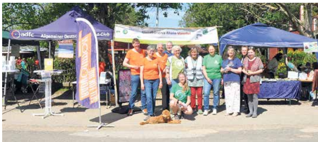
Das Klimanetzwerk Rhein-Voreifel wird dieses Jahr schwerpunktmäßig über Klimaschutz und Gesundheit informieren.

Der Startschuss erfolgt dieses Jahr am 26. April um 11 Uhr beim Bienenhaus des Imkervereins Vorgebirge in Kardorf (Keimerstraße). Hier beginnt im Anschluss an die offizielle Eröffnung auch die vom ADFC geführte Tour. In Zusammenarbeit mit dem Arbeitskreis Stadtbild der Stadt Bornheim vermittelt der Imkerverein Wissenswertes über die Bienenhaltung, Streuobstwiesen und heimische Wildkräuter und deren vielfältige Verwendungsmöglichkeiten. Erstmals werden historische Bienenbeuten ausgestellt. Neben Mitmachaktionen lädt eine Verkostung des Vorgebirgshonigs ein. Im Kunsthof Merten (Wagnerstraße 12) öffnen die dort arbeitenden fünf Künstlerinnen und Künstler ihre Ateliers, zeigen neue Werke aus Malerei, Bildhauerei und Fotografie und freuen sich auf vertiefende Gespräche im sehenswerten alten Vierkanthof. „Kunst direkt vom Erzeuger“ - das ist hier gelebte Wirklichkeit und ein Augenschmaus, der den Gaumenschmaus bestens ergänzt. Eine ganz besondere Attraktion: Jeder, der möchte, kann kostenfrei unter Anleitung eine kleine Monotypie fertigen und mit nach Hause nehmen. Der Obstbaubetrieb Schmitz-Hübsch in Merten (Bonn-Brühlerstraße 14) ist der erste zertifizierte Obstbaubetrieb für eine nachhaltige Produktion in Deutschland und