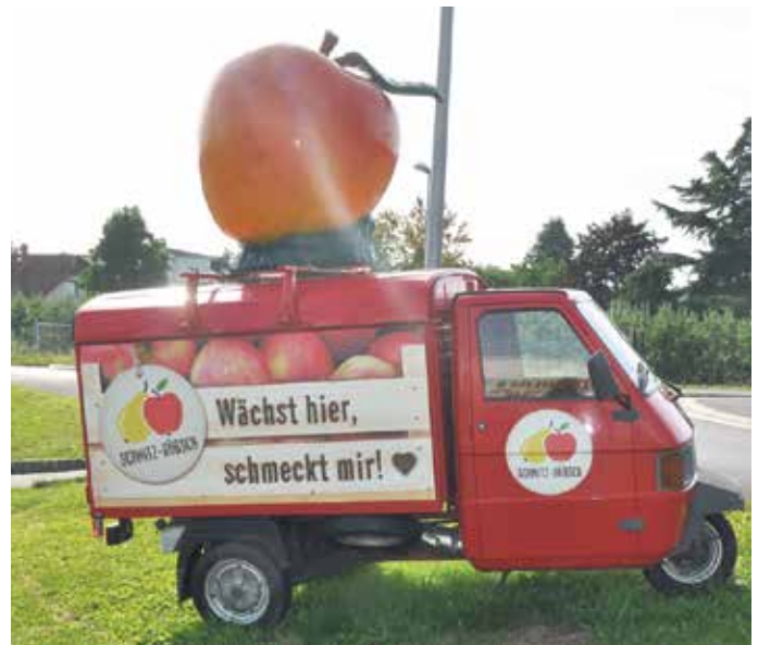
„Wächst hier, schmeckt mir!“ - Bei Schmitz-Hübsch gehen ausgesuchte Geschmackserlebnisse und Nachhaltigkeit Hand in Hand

Weitere Informationen und Angebote: www.schmitzhuebsch.de (WVK)