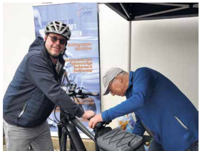
Beim ADFC-Stand wird erneut die Kodifizierung von Rädern als vorbeugender Diebstahlschutz möglich sein.