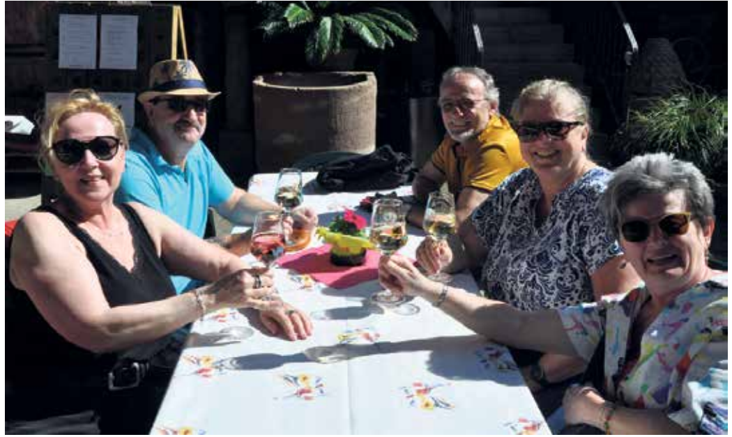
Bei einem guten Glas Wein lässt sich die Fahrradtour im Marienhof der Weinkellerei Antwerpen genussvoll ausklingen.

Natürlich muss niemand alle acht Stationen anfahren. Jeder kann sich auch seine Route individuell zusammenstellen und Start- und Zielpunkt selber festlegen. Wer an dem beliebten Gewinnspiel teilnehmen möchte, muss sich allerdings mindestens einen Stempel bei einer Station am Rhein und einen bei den übrigen Höfen abholen. Die ausgefüllten Karten können direkt bei einem der teilnehmenden Stationen oder bis zum 11. Mai im Bornheimer Rathaus (Rathausstraße 2, Roisdorf, zu Händen Nicole Krumbach) abgegeben werden. Sechs prall gefüllte Präsentkörbe warten auf die glücklichen Gewinn-