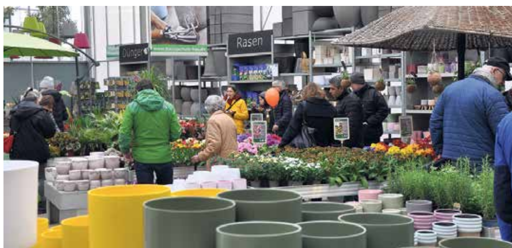
Wer noch nach Ideen für seine Gartengestaltung sucht, ist bei der GartenBaumschule Hau genau richtig.