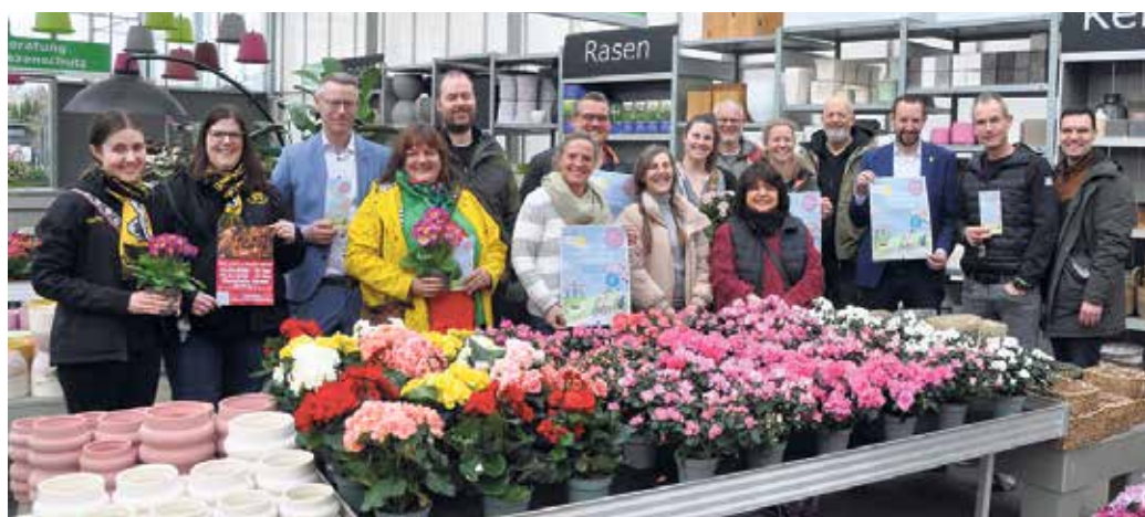
Repräsentanten der teilnehmenden Höfe und der Stadt präsentierten das Programm der 17. Fahrradtour „Frühlingserwachen im Vorgebirge“ bei der GartenBaumschule Hau in Walberberg.