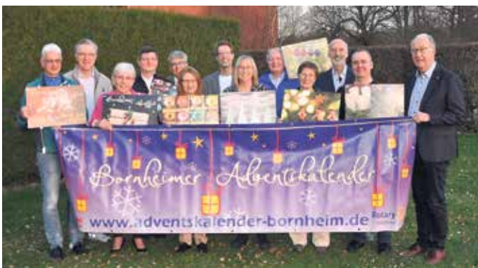
Repräsentanten der bedachten Organisationen und der Rotarier freuten sich über das super Ergebnis der Kalenderaktion 2025 und präsentierten Kalender der bisherigen zehn Jahre.

Dass ein solch erfolgreiche Aktion förmlich nach einer Fortsetzung schreit, ist Jäger und Schulze bewusst: "Nach dem Kalender ist vor dem Kalender. Unser Projektteam bereitet schon jetzt die elfte Auflage vor. Und wir sind guten Mutes, dass es dank unserer Förderer, Sponsoren und ehrenamtlichen Helfer auch im Advent 2026 wieder ein sehr, sehr gutes Ergebnis zum Wohle von gemeinnützigen Einrichtungen in Alfter, Bornheim und Swisttal geben wird." (WDK)