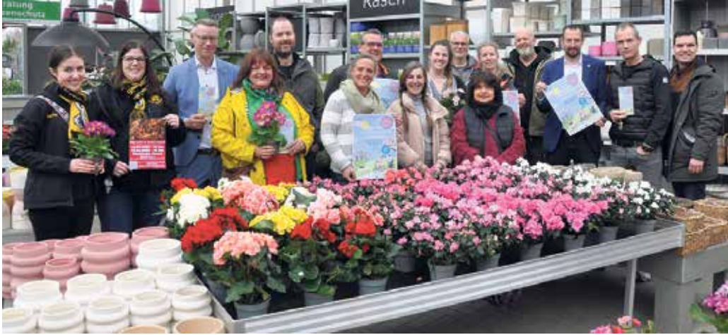
Repräsentanten der teilnehmenden Höfe und der Stadt präsentierten das Programm der Frühlings- und Spargelwochen bei der GartenBaumschule Hau in Walberberg.

Fünfte „Frühlings- und Spargelwochen“ starten Anfang April - Vielfältige Aktionen, Veranstaltungen und Angebote im gesamten Stadtgebiet