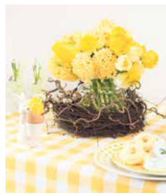
In ein Nest gebettet bringen gelbe Narzissen und Tulpen die Sonne auf die österliche Tafel.

Online Familien-Anzeigen: für alles was wirklich zählt! shop.rautenberg.media