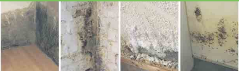
Defekte Horizontalsperre Querdurchfeuchtung Ausblühungen Schimmelbefall

uns einen Schritt näher an die vollständige Wiederherstellung des Tierheims.“ Spendenkonten: Kreissparkasse Ahrweiler IBAN: DE14 5775 1310 0000 4107 87 BIC: MALADE51AHR VR Bank RheinAhrEifel eG IBAN: DE74 5776 1591 0201 8159 00 BIC: GENODE1BNA