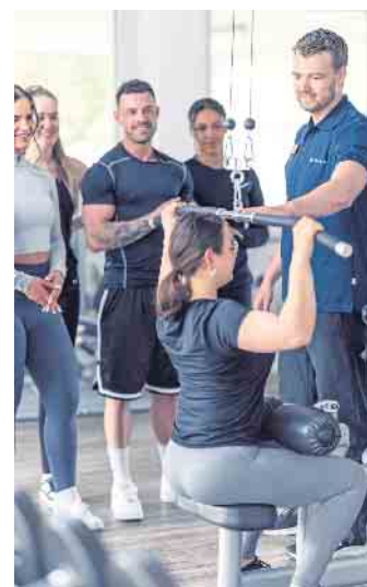
Gut ausgebildete Fachkräfte betreuen Kundinnen und Kunden in Fitness- und Gesundheitsanlagen bei ihrem bedarfsgerechten Training.

Zum Ende des Jahres 2023 konnten die Fitness- und Gesundheitsanlagen in Deutschland 11,3 Millionen Mitglieder verzeichnen. Dieser Wert entspricht einem Zuwachs von über einer Million Mitgliedern im Vergleich zum Vorjahr, wie die „Eckdaten der deutschen Fitnesswirtschaft 2024“ zeigen - eine Datenerhebung des DSSV, der Prüfungs- und Beratungsgesellschaft Deloitte sowie der DHfPG.