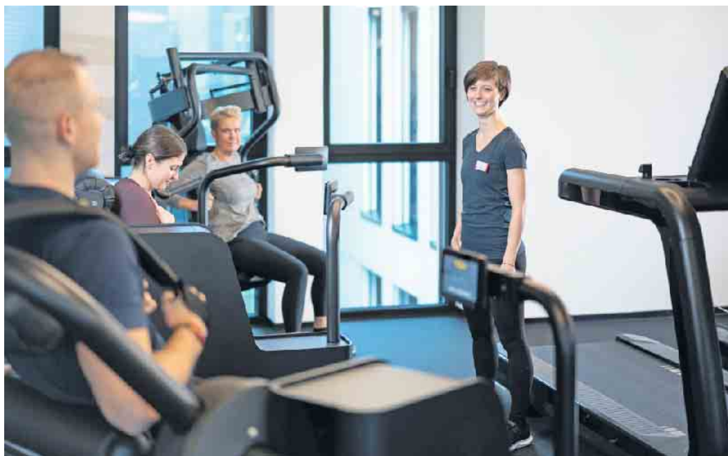
Fitness- und Gesundheitsanlagen etablieren sich zunehmend als elementare Bestandteile der Gesundheitsversorgung. Entsprechend gut muss die Ausbildung der Fachkräfte sein.

Denn den Fachkräften - beispielsweise den Trainerinnen und Trainern - kommt hier eine entscheidende Rolle zu. Sie tragen maßgeblich zum Trainingserfolg bei und motivieren die Mitglieder in Fitness- und Gesundheitsanlagen langfristig. Das gut ausgebildete Fachpersonal muss eine bedarfsgerechte und fundierte Betreuung der Trainierenden sicherstellen können. Qualifizieren kön-