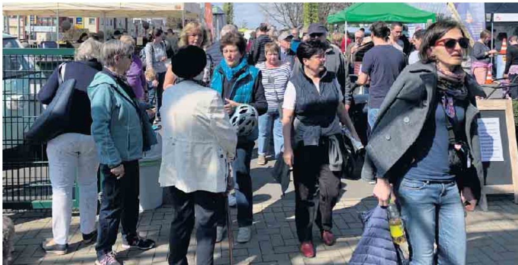
Die GartenBaumschule Hau erwartet wieder viele Kunden und Gäste beim Frühlingsmarkt.

beziehungsweise am Stand des Kölner Einspänner Kaffeehaus goldrichtig. Natürlich werden wieder die beliebten Traktorfahrten zu den