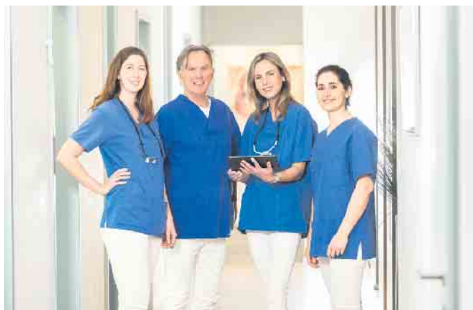
Das Team der dental suite im Kölner Rheinauhafen

Herausnehmbarer Zahnersatz stört nicht selten beim Sprechen und auch die Angst vor dem Versagen der Haftcreme bleibt immer im Hinterkopf präsent. All-on-4® Zahnersatz ist hingegen fest im Kiefer verankert.