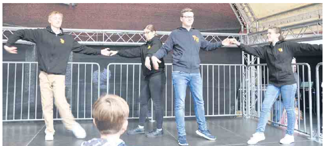
Die Vorführungen der ADVT-Tanzschule Breuer animieren Jahr für Jahr Besucher, selbst aktiv das Tanzbein zu schwingen.

Das Einrichtungshaus Heerdt ist richtungsweisend in puncto Wohnraumgestaltung. Besondere Produkte und Einblicke bietet der Stand der Drechslermanufaktur-Meier. Nicht zu vergessen die Film- und Medienproduktion Medienschmied und die MP Music- und Veranstaltungstechnik sowie die Attraktionen der R(h)ein Hüpfburgen. „Meinem Team und mir sowie unseren Marktpartnern liegt besonders am Herzen, unseren