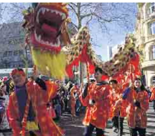
Mit ihrem 16 Meter langen Großdrachen begeisterten die Bönnsche Chinese im Bonner Rosenmontagszug.

Highlights waren der Tollitätenempfang und die Teilnahme am Bonner Rosenmontagszug - Deutsch-chinesische Freundschaft vertieft