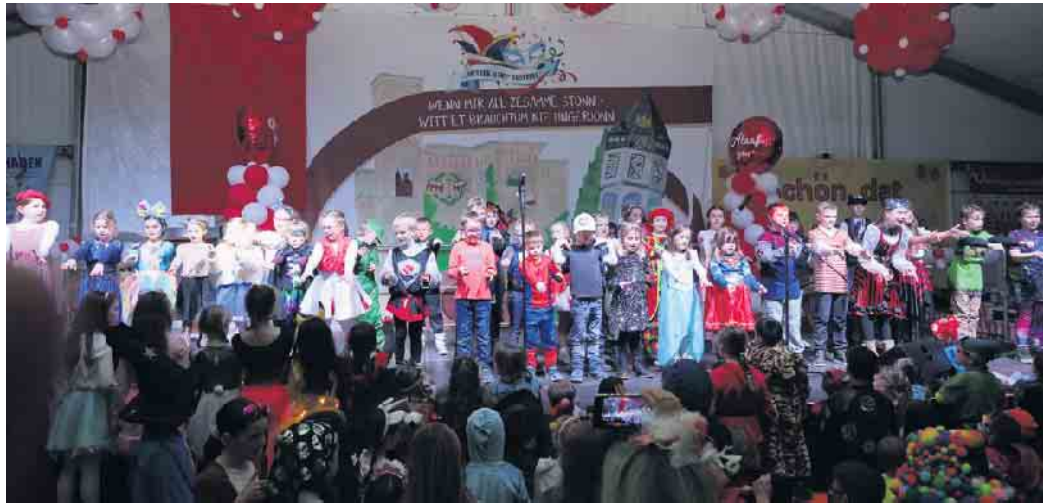
Die Kinder der Kölsch-AG der Rösberger Schule auf der Karnevals Bühne im Zelt in Hemmerich.

Die ganze Veranstaltung steht unter dem Motto, dass Kinder etwas für Kinder machen, denen es nicht so gut geht. Auch in diesem Jahr werden die eingenommenen Eintrittsgelder (mindestens 1 Euro pro Person) sowie alle Spenden, die zugunsten der Veranstaltung z. B. das Trinkgeld von den ehrenamtlichen HelferInnen