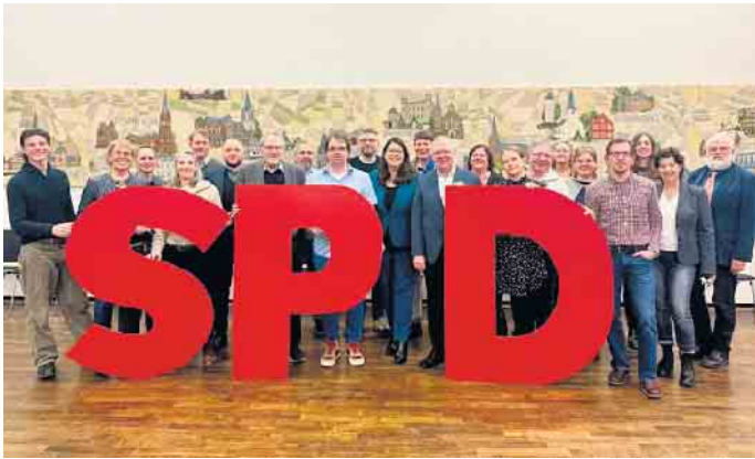
Ein überzeugendes Team: Die Kandidatinnen und Kandidaten der SPD für die Kommunalwahl