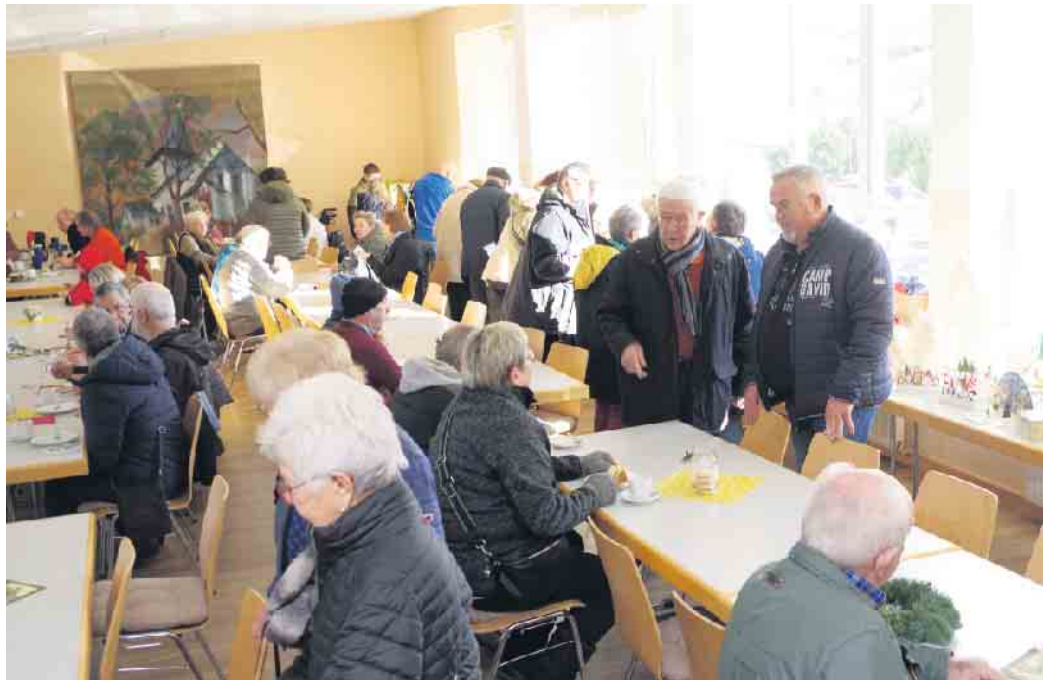
Das Dorfgemeinschaftshaus in Mahlberg entwickelte sich wieder zu einem voradventlichen Treffpunkt.