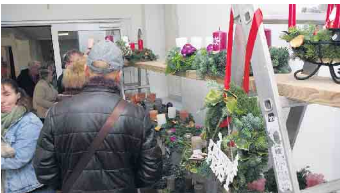
Die angebotenen Adventskränze waren alle individuell handgefertigt und schnell ausverkauft.