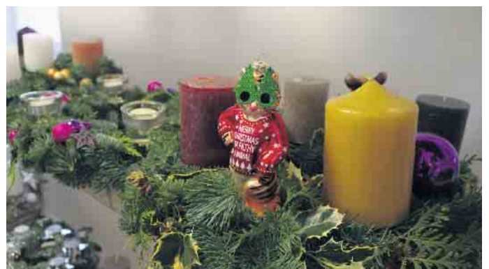
Beim Herstellen der Kränze ließen die „Weihnachtselfen“ ihrer Fantasie freien lauf.