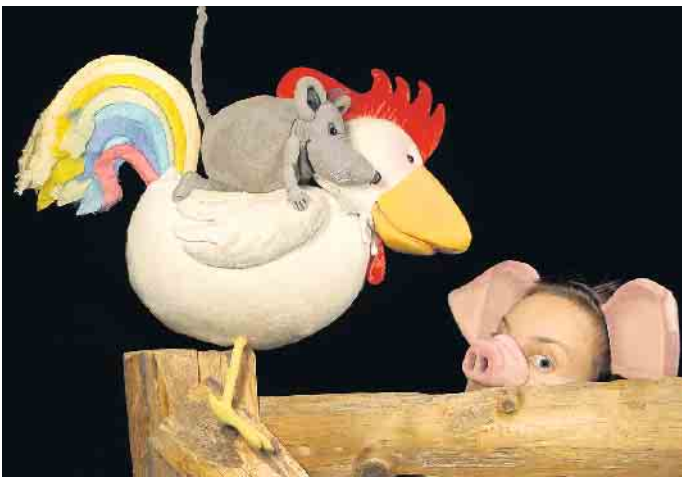
Johnny Mauser, Franz von Hahn und der dicke Waldemar.