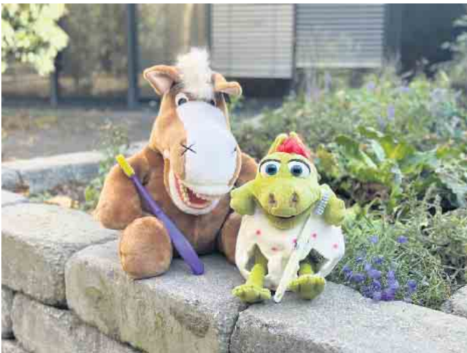
Maskottchen Jimmy, das Zahnputzpferd vom Verein für Jugendzahnpflege im Kreis Euskirchen bekommt einen neuen Sidekick: Kiki das kleine Drachentöchterchen wird in den Kindergärten im Kreis künftig bei der Prophylaxe-Arbeit bei U3-Kindern eingesetzt.

ist für die Kleinsten manchmal etwas zu groß. Mit Kiki können die Kolleginnen etwas behutsamer auf die Kinder zugehen und sie frühzeitig daran gewöhnen, dass Zähneputzen etwas Normales ist und auch schon Sinn macht, wenn noch nicht alle Zähne durchgekommen sind.“ Die Quote der U3-Kinder, die in einer Kindertageseinrichtung oder in der Tagespflege betreut werden, ist auch im Kreis Euskirchen in den vergangenen Jahren gestiegen. Bei der Vermeidung frühkindlicher Karies spielt die Gruppenprophylaxe eine wichtige Rolle. Die zahnärztlichen Untersuchungen durch den Zahnärztlichen Dienst des Kreises Euskirchen bestätigen die Wichtigkeit der Gruppenprophylaxe von Anfang an und arbeiten eng mit dem Verein für Jugendzahnpflege im Kreis Euskirchen e. V. zusammen. Die Prophylaxefachkräfte sind in allen Kindergärten im Kreis unterwegs und besuchen auch verschiedene Schulen. Zusätzlich