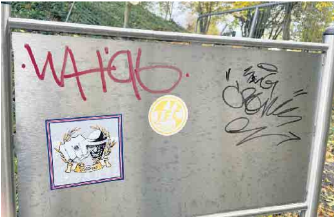
Noch durch den Bauzaun abgesperrt und schon mit Aufklebern und Farbe verunstaltet.

Seit einigen Monaten wird im Bereich des Wallgrabens gebaggert, gebaut, gestaltet und erneuert. Die Stadt möchte den Bürgerinnen und Bürgern hier ein frisch überarbeitetes Areal bieten, das viele Möglichkeiten zum Verweilen und zur Freizeitgestaltung bietet. Doch das Gelände ist noch nicht fertiggestellt, da lassen sich schon deutliche Spuren von Zerstörungswut entdecken. Selbst Elemente, die noch im Bau sind und durch Zäune abgesichert sind, werden nicht verschont. Dabei haben Bauzäune im Allgemeinen eine Funktion: Das Betreten zu verhindern. Würde diese Funktion erkannt, würden sich nun keine Fußspuren im noch nicht ausgehärteten Unterbau des Fallschutzes im Calisthenics-Bereich am Wallgraben befinden. Damit das nicht auch bei der abschließenden Deckschicht des Fallschutzes passiert, hat die Stadt ihn sogar zwei Nächte lang bewachen lassen.