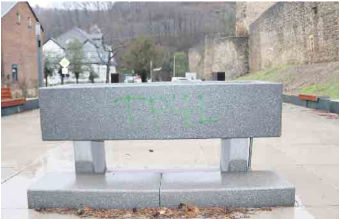
Bereits im vergangenen Jahr waren etliche Elemente auf dem gerade fertiggestellten Europaplatz mit Graffiti beschmiert worden.