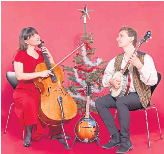
Das Heart Strings Duet gastiert im „Kulturhaus theater 1“.

Konzert mit dem Heart Strings Duet im Kulturhaus theater 1