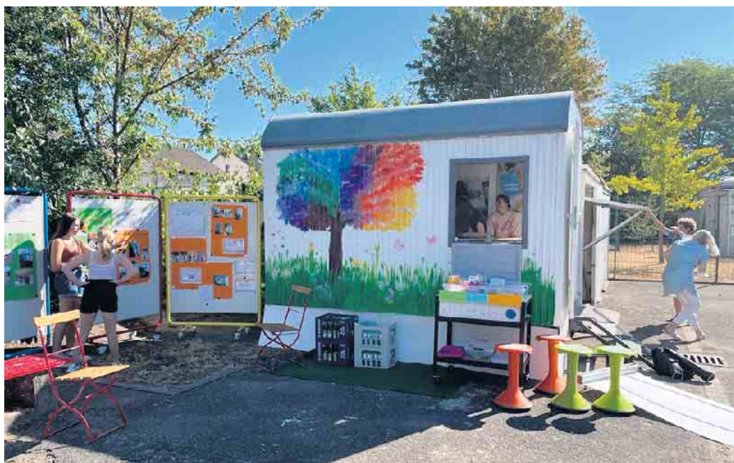
Ausstellung von Projektergebnissen prämierter KiTas und Schulen im Rahmen von Kultureller Bildung an der Gesamtschule Weilerswist.

Kitas, Schulen, Berufskollegs und viele weitere Bildungseinrichtungen: der Kreis Euskirchen hat eine ausgesprochen vielfältige Bildungslandschaft. Nur: Wie soll man da den Überblick behalten? Wie lässt sich Transparenz sichern? Wie kann die Zukunft junger Menschen - unabhängig von der Herkunft - mit einem passge-