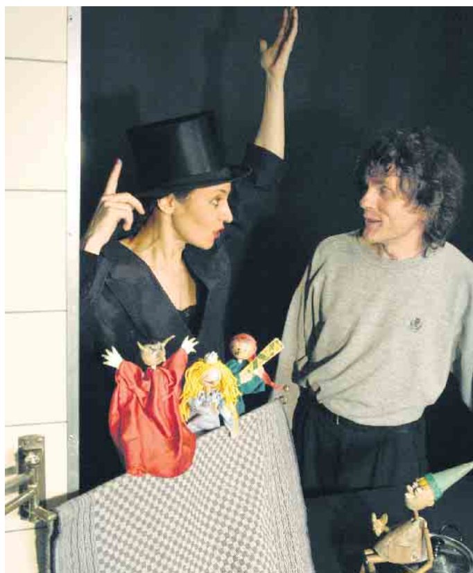
Pinocchio im Puppentheater

Tickets gibt es an der Tageskasse; Kartenzahlung ist nicht möglich. Es wird empfohlen,