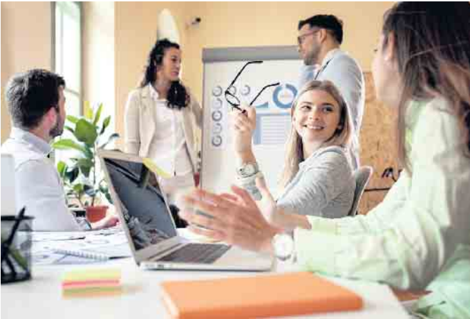
Angehende Bankazubis sollten Kontaktfreude und Kommunikationsstärke mitbringen.

Job und Karriere: Die drei wichtigsten Optionen für einen Einstieg ins Bankwesen