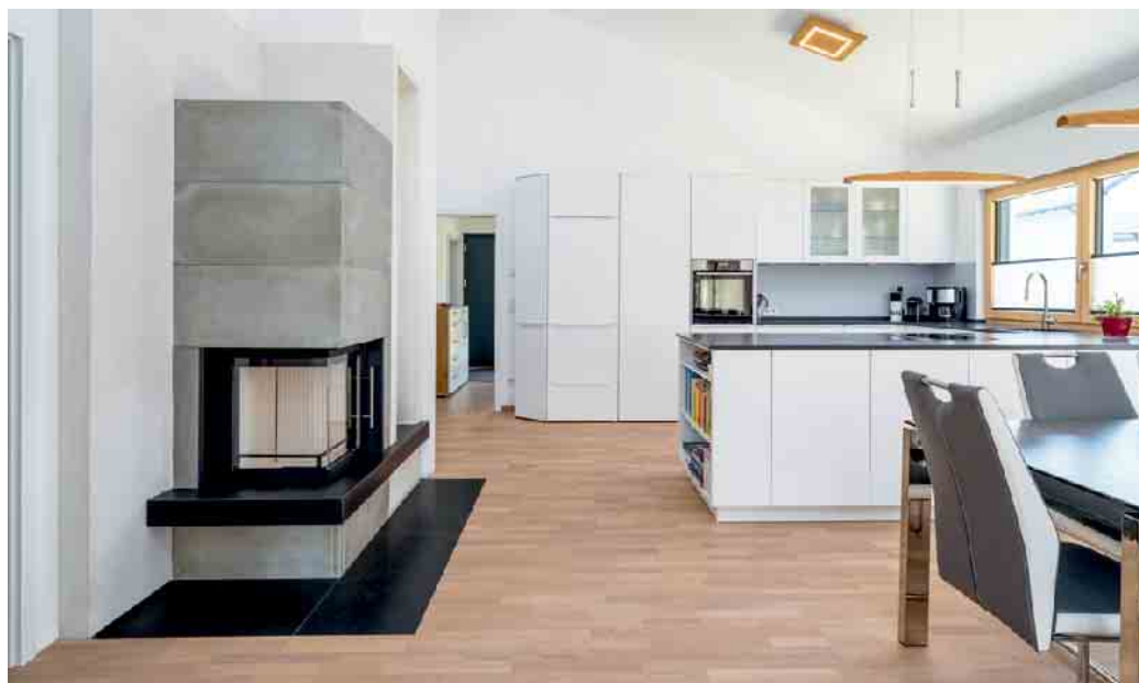
Viele Menschen wünschen sich, bis ins hohe Alter selbstbestimmt und komfortabel zu wohnen.

Beruhigt in den Ruhestand mit einem zukunftsicheren Fertighaus