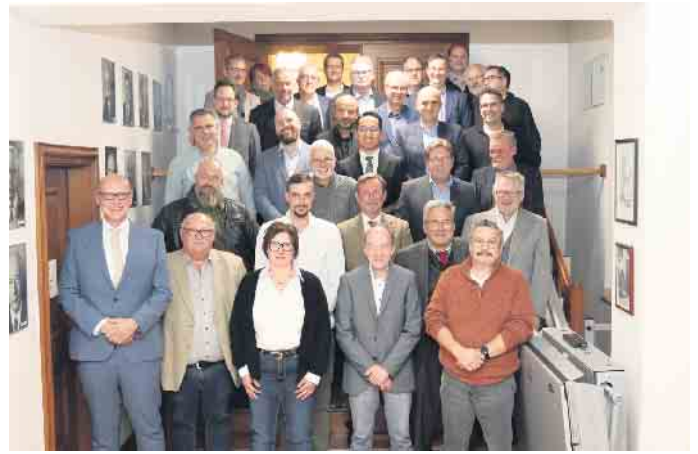
Der neue Rat der Stadt Bad Münstereifel besteht aus 36 Mitgliedern, die allerdings nicht alle an der Sitzung teilnehmen konnten.

In seiner Antrittsrede gab der neue Bürgermeister seinen beim antiken, griechischen Staatsmann Perikles entlehnten Leitgedanken aus: „Es kommt nicht darauf an, die Zukunft vorauszusagen, sondern darauf, auf die Zukunft vorbereitet zu sein.“ Mit Blick auf die Zukunft Bad Münstereifels setzt Glatzel auch auf Meinungsvielfalt. „Es geht um das Wohl unserer Stadt, das