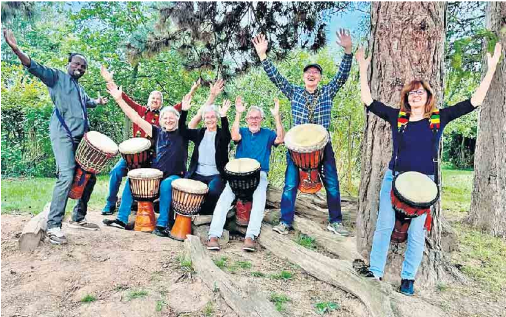
Als Vorgruppe spielt Pape Samory Secks Trommelgruppe „Kalebasse“.

sches und mitreißendes Zusammenspiel, begeistern sie das Publikum. Tickets gibt es an der Tageskasse; Kartenzahlung ist nicht möglich. Es wird empfohlen, unter 02257-4414 oder unter kulturhaus@theater-1.de zu reservieren. Reservierungswünsche, die erst am Tag der Veranstaltung eingehen, können möglicherweise nicht mehr berücksichtigt werden.