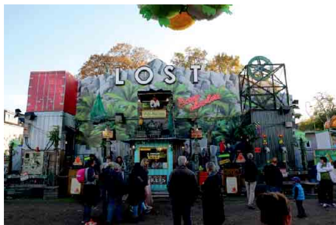
Die Festplatzbesucher konnten einen Escape-Hindernis-Parcours im Laufgeschäft Lost Escape Adventure bestreiten