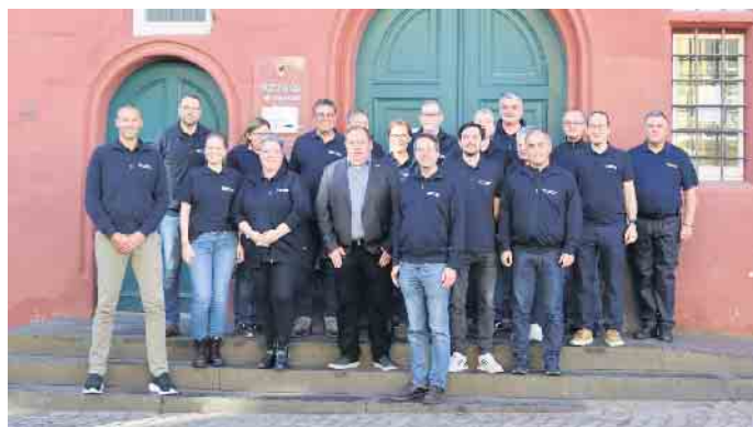
Um aus den Erfahrungen der Flutkatastrophe zu lernen, reiste eine Delegation des Bezirksamtes Bergedorf der Stadt Hamburg nach Bad Münstereifel.

Etliche Erkenntnisse konnten die Gäste aus Bergedorf für ihre