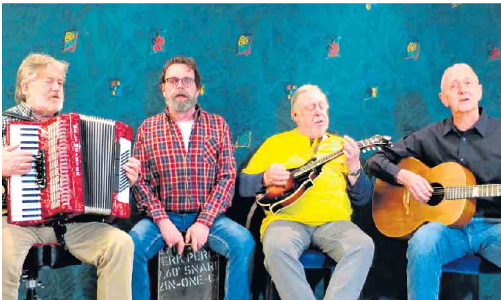
Das Quartett „Cliffs Of Dooneen“ kommt ins Kulturhaus.

Das EU-Semble und die Gruppe Cliffs Of Dooneen gastieren im Kulturhaus theater 1