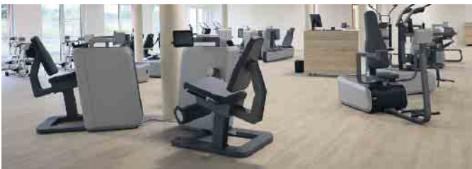
Helle Räume und moderne Trainingsgeräte ermöglichen stressfreie und erfolgreiche Anwendungen.

jeden Menschen. „Unser Kerngeschäft ist und bleibt die ambulante medizinische Rehabilitation bei orthopädischen, kardiologischen, neurologischen und psychosomatischen Erkrankungen“, erläutert Rademacher die Aufgaben des modernen Gesundheitszentrums. Eine Erweiterung um Angebote bei pneumologischen Erkrankungen ist für 2026 geplant. Weiterer Schwerpunkte sind Physiotherapie, Ergotherapie und Logopädie auf Rezept. Medizinisches Gerätetraining und entsprechende Kurse auf Selbstzahlerbasis runden das Leistungsspektrum ab. Hochqualifizierte und topmotivierte ärztliche Mitarbeiter, Rehabilitationsexperten und weiteres Fachpersonal sorgen für eine optimale Beratung und Anleitung bei den Anwendungen und Betreuung der Kunden. Ein echtes Highlight ist das angegliederte „Bistro Balance“ , das neben den Reha-Kunden auch an-