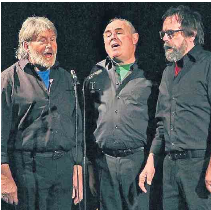
Das A-Cappella-Trio „EU-Semble“ in Aktion.