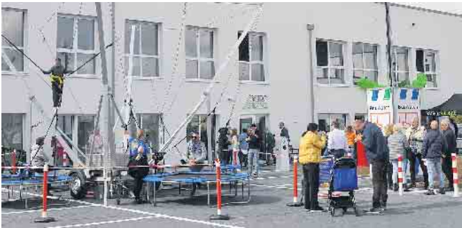
Für große und kleine Besucher war am Tag der offenen Tür bestens gesorgt.