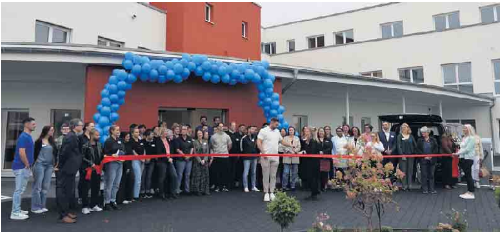
Mit dem Durchschneiden des obligatorischen roten Bandes wurde das moderne Funktionsgebäude in Alfter Ende September offiziell eröffnet.

Der Auftakt des neuen Standorts wurde von einem sehr gut besuchten Tag der offenen Tür begleitet. Besucherinnen und Besucher erhielten Einblicke in die freundliche, moderne räumliche Ausstattung, das Therapie-spektrum und das Angebot des „Bistro Balance“. Es wurde die Gelegenheit für Gespräche mit dem Fachpersonal sowie umfassende Beratungen genutzt. Gemäß seinem Leitbild versteht sich Sieg Reha 2.0 als Dienstleister im Gesundheitswesen mit Heilmittel, Prävention und ambulanter Rehabilitation. Das Ziel ist die Sicherung der Teilhabe im Alltag, Beruf und Gesellschaft Behinderter oder von Behinderung bedrohter Menschen . Die Aufgabe ist die Verbesserung der Lebensqualität und Selbstständigkeit eines