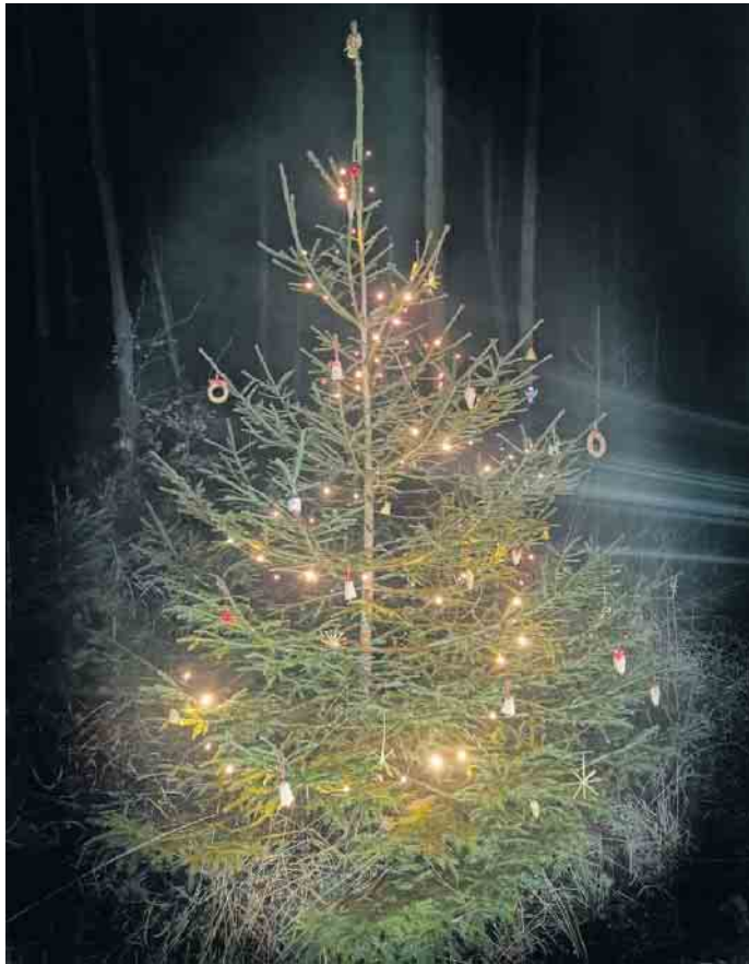
Stimmungsvolle Beleuchtung erwartet die Wanderer.

Am 23.09.2025 wurde in der Sitzung des Bau- und Feuerwehrausschusses der Stadt Bad Münstereifel erstmalig die Entwurfsplanung zur Wiederherstellung der Brigidastraße, des Lingscheider Wegs, der Straße Im Elsengarten und des Schönauer Bergwegs durch das beauftragte Ingenieurbüro vorgestellt und beraten.