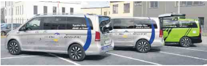
Ein umfangreicher komfortabler Fahrdienst sorgt für einen bequemen und sicheren Hol- und Bringservice.