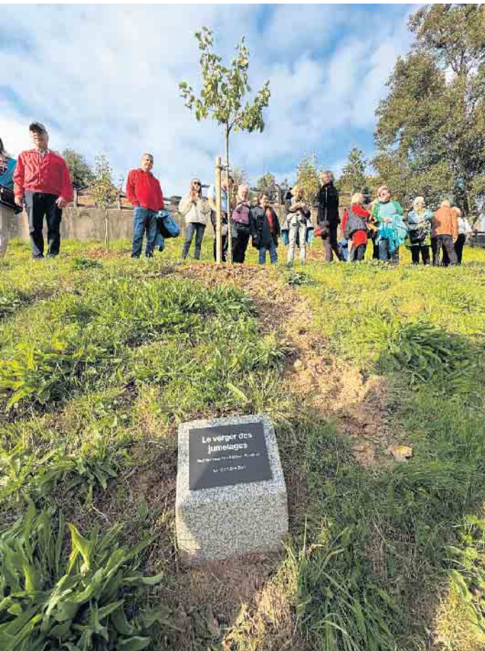
Baumpflanzaktion im Stadtgarten von Fougères

Ein Highlight war der Besuch des frisch eröffneten Museums „La Course“, das die Geschichte von Fougères auf eindrucksvolle Weise erzählt.