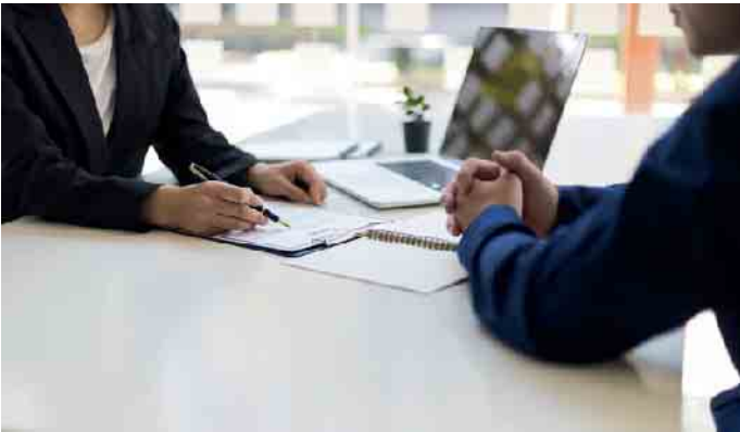
Die Frage nach den Bestattungskosten sollte von Beginn an geklärt und schriftlich festgehalten werden.

Ein Trauerfall stellt das Leben der Hinterbliebenen auf den Kopf. In dieser emotionalen Ausnahmesituation müssen sie viele organisatorische Entscheidungen treffen. In diesem Zusammenhang stellt sich nicht zuletzt die Frage nach den Kosten einer Bestattung. Wie können Hinterbliebene sicher sein, dass sie einen angemessenen Preis bezahlen, die Kostenaufstellung transparent und die Beratung fachlich kompetent ist? Der Bundesverband Deutscher Bestatter (BDB) weist darauf hin, dass Menschen im Sterbefall auf das Markenzeichen der Bestatter achten sollten, wenn sie sich für ein Bestattungsunternehmen entscheiden. Kompetente Beratung wichtiger als Preis Eine aktuelle Forsa-Umfrage gibt