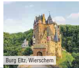
Burg Eltz, Wierschem