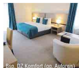
Bsp. DZ Komfort (gg. Aufpreis)