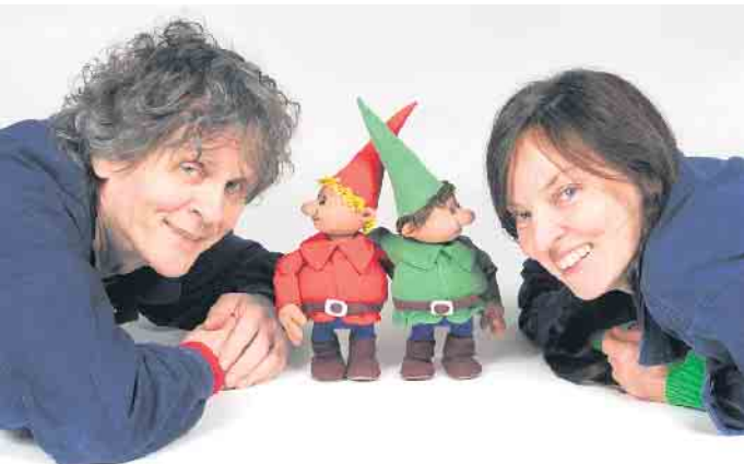
Himpelchen Pimpelchen und ihre beiden „Lehrlinge“.

Hier bringt die Inszenierung vom „theater 1“ Licht ins Dunkel und