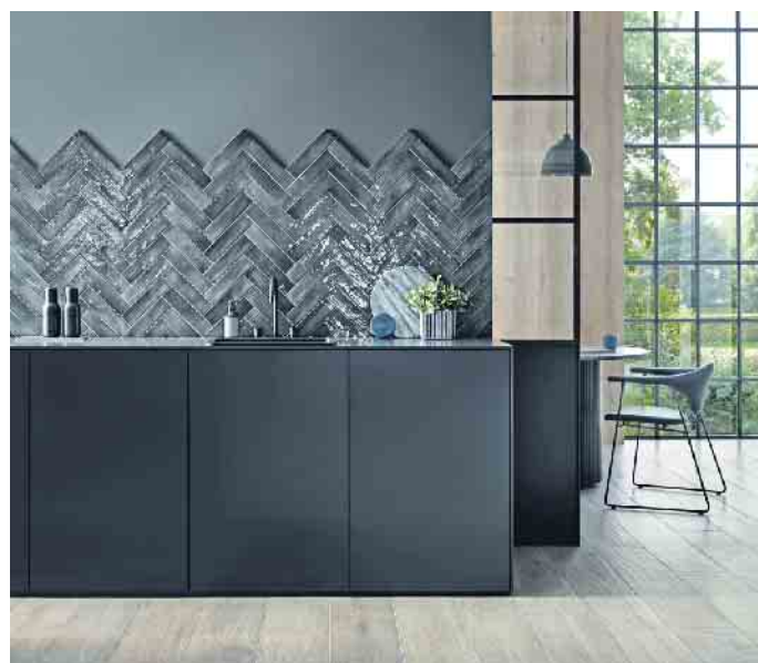
Die Wohnküche lädt zu gemeinsamen Aktivitäten ein - und ist dank Holzoptikfliesen nicht nur wohnlich, sondern auch ausgesprochen pflegeleicht.