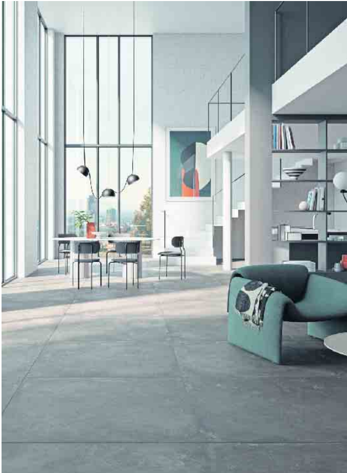
XXL-Fliesen im trendigen Estrich-Look schaffen Großzügigkeit in offenen Wohnkonzepten.