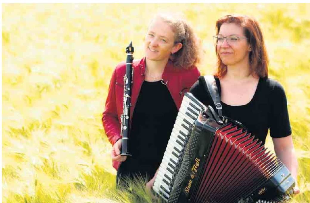
Zwei virtuose Musikerinnen kommen ins Kulturhaus

Mit ihrem Programm führen die beiden Musikerinnen das Publikum in eine faszinierende Welt beinahe vergessener Klezmer-Musik. Mal überschäumend vor Lebensfreude, mal tief ergreifend melancholisch, achtsam arrangiert und exzellent vorgetragen von zwei