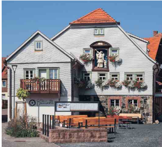
Wer die alte Mühle kannte, kommt aus dem Staunen nicht heraus.