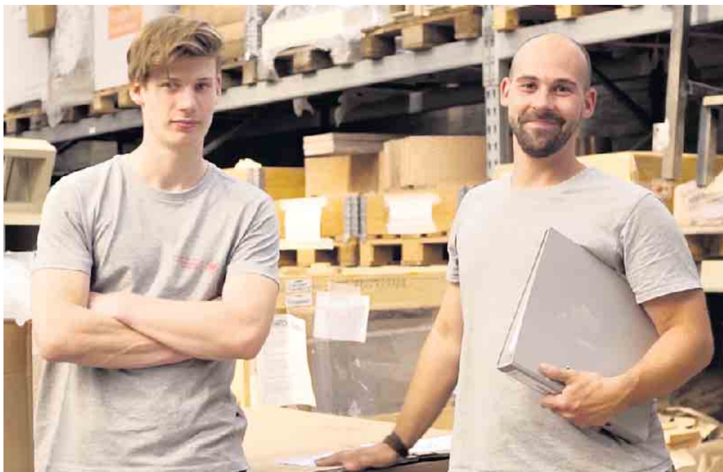
Viele Nachwuchskräfte kommen über ein Praktikum zu ihrem Beruf als Ofen- und Luftheizungsbauer.

Ofen- und Luftheizungsbauer als besonderer Beruf mit guten Zukunftschancen