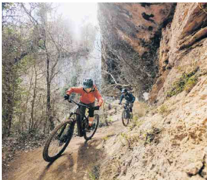
Das E-Bike ist das passende Trainingsgerät für alle, die gezielt ihre Fitness verbessern möchten.

wichtigsten Informationen zählen unter anderem Höhendaten, Leistungswerte, die Trittfrequenz und die Anzeige der verbrannten Kalorien. So sehen E-Biker, ob sie gerade über oder unter ihrer persönlichen Leistung und Trittfrequenz fahren und können auf diese Weise ihr Sportprogramm optimieren. Mit dem richtigen Training ist das E-Bike ein effektiver Fettverbrenner und Fitness-turbo. Wichtig dabei: Gerade Einsteiger sollten sich realistische Ziele setzen und sich zu Beginn nicht überfordern. Zudem sollten sich auch Sport-Enthusiasten zwischen jeder intensiven Einheit ein bis zwei Ruhetage zur Regeneration gönnen. Ein weiterer Tipp: E-Biken in der Gruppe macht noch mehr Spaß und fördert erfahrungsgemäß die persönliche Motivation. (DJD)