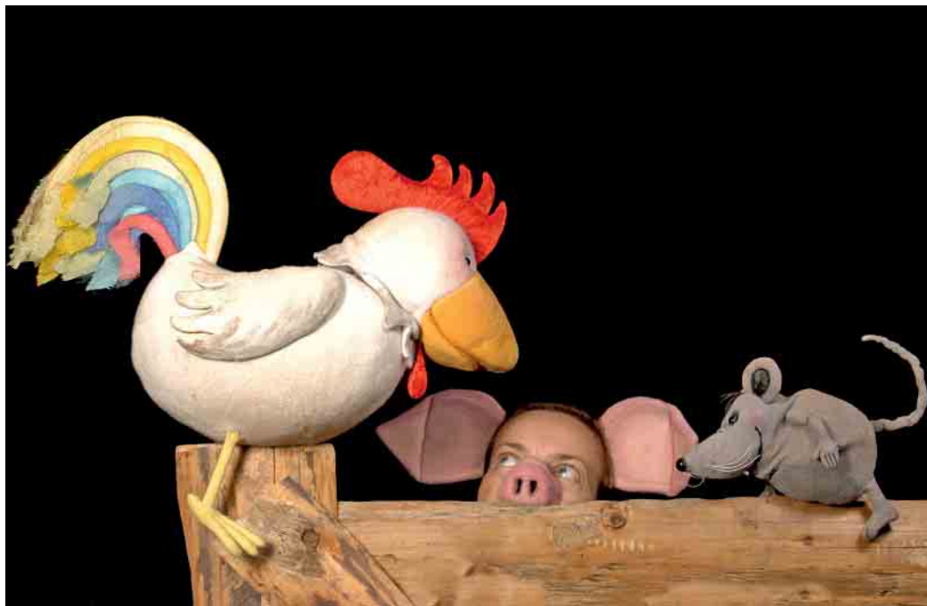
Franz von Hahn, Johnny Mauser und der dicke Waldemar.

Sie schwören ewige Treue und teilen alles, bis sie erkennen müssen, dass es da Grenzen gibt. So