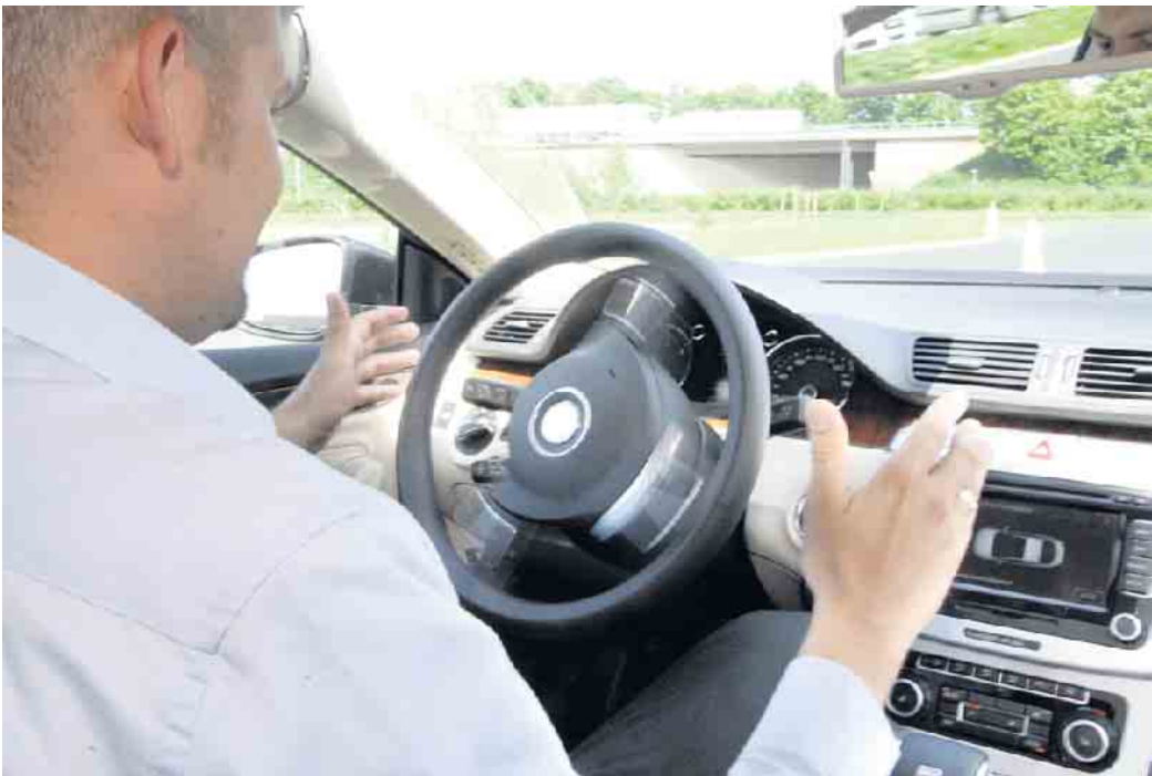
Der Parkassistent ist das häufigste Fahrerassistenzsystem. Er schlägt, nachdem der Fahrer die vom Fahrzeug vorgeschlagene Lücke bestätigt hat, selbstständig im richtigen Moment das Lenkrad ein und übernimmt das Einparken nahezu vollständig.

48 Prozent der Befragten geben an, dass ihr Neuwagen mit einem Spurhalteassistenten ausgestattet ist. Er hilft, in der Fahr-