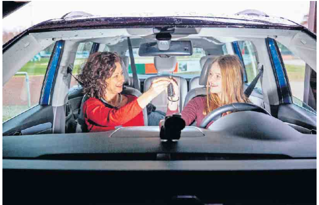
Beim BF17 sammeln Fahranfängerinnen und -anfänger begleitet und unterstützt hilfreiche Erfahrungen im Straßenverkehr.

Für die Anmeldung zum BF17 sind ein gültiger Personalausweis, ein biometrisches Passfoto, die ausgefüllten Antragsformulare und die Unterschriften der Erziehungsberechtigten notwendig. Die Jugendlichen müssen zudem vorab einen Sehtest sowie einen Erste-Hilfe-Kurs absolvieren und die entsprechenden Nachweise vorlegen. Auch Begleitpersonen sollten sich frühzeitig mit dem Thema befassen, da es einige Kriterien zu erfüllen gibt: Begleiten darf, wer über 30 Jahre alt ist, seit mindestens fünf Jahren den Führerschein besitzt und nicht mehr als einen Punkt im Fahreignungsregister in Flensburg hat. Tipps zum Begleiteten Fahren gibt es