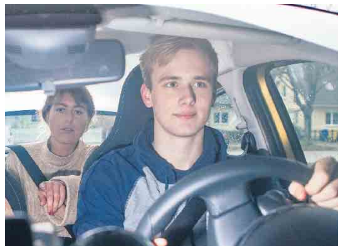
Studien belegen: Jugendliche, die am BF17 teilgenommen haben, fahren sicherer. Sie sind im ersten Jahr des selbstständigen Fahrens rund 20 Prozent seltener an Unfällen beteiligt als Gleichaltrige, die nach der Fahrschule direkt auf sich gestellt sind.

der Eltern weiter mitbenutzt werden soll. Viele Versicherungen unterscheiden sich darin, ob bei der Nutzung für das Begleitete Fahren ab 17 die Beiträge gleichbleiben oder sich erhöhen. Ist BF17 in der Familie geplant, kann eine frühzeitige Nachfrage bei der eigenen Kfz-Versicherung sinnvoll sein. (djd)