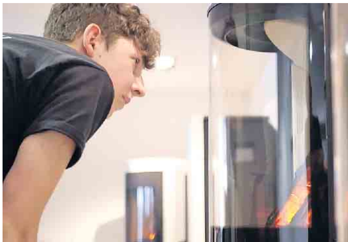
Die Ausbildung zum Ofen- und Luftheizungsbauer bietet ausgezeichnete Zukunftsperspektiven.

Handwerkerinnen und Handwerker sind heute mehr denn je gefragt. Der Beruf des Ofen- und Luftheizungsbauers beispielsweise ist einer der vielseitigsten und abwechslungsreichsten - und einer mit besonderem Charakter. Unter #ofenhelden hat der Gesamtverband OfenBau e. V. (GVOB) eine Ausbildungskampagne gestartet. Damit soll ein Beruf bekannter gemacht werden, den viele Jugendliche bei der Wahl des Ausbildungsberufs gar nicht „auf dem Schirm haben“.