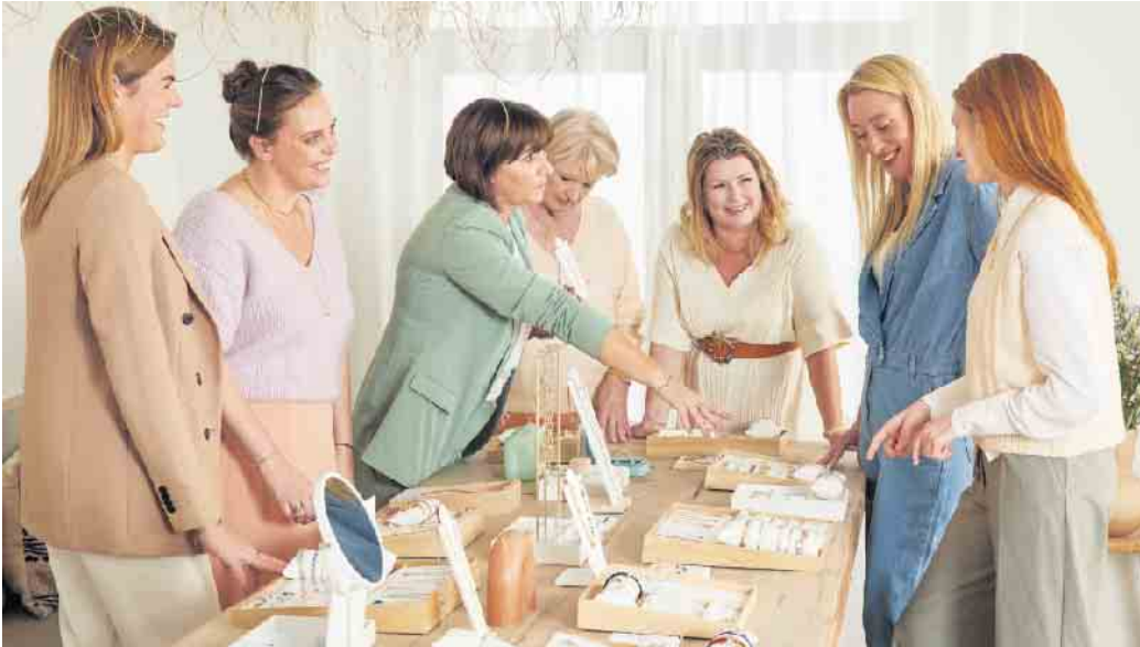
Gemeinsam mit Bekannten Schmuck auszuwählen und alles genau zu begutachten, macht Spaß und kann einen guten Verdienst einbringen.

Schmuckstylistinnen machen ihr Hobby zum Beruf