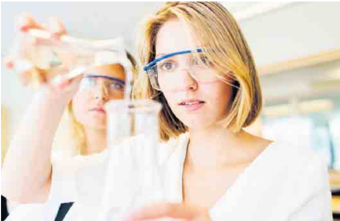
Ausbildungsberufe in der pharmazeutischen Produktion sind oft weniger bekannt, bieten aber gute Perspektiven.

In Gesundheitsunternehmen bieten sich viele interessante Berufsperspektiven