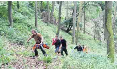
Die letzten Meter mussten die DRKler zu Fuß überwinden.