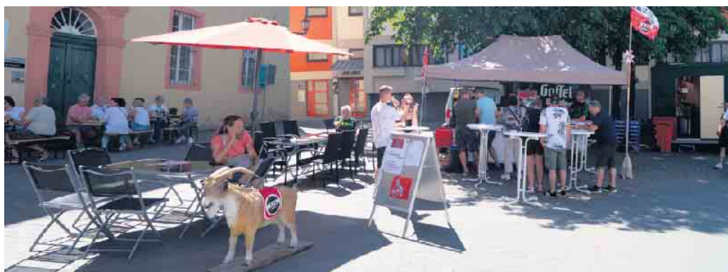
„zum Geissböckchen bei Rudi“ vor dem Gymnasium