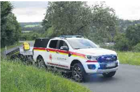
Ein neuer Pickup des DRK machte sich gleich als Transportfahrzeug für das UTV verdient.