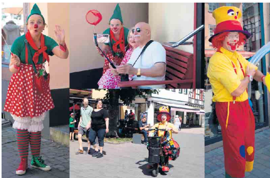
Clowns unterwegs in der Altstadt

Verkaufsoffener Sonntag lockte Besucher in die historische Altstadt