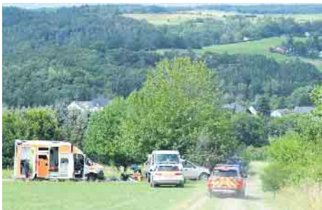
Vor Ort konnten Feuerwehr, Rettungsdienst und Bundeswehr zunächst nicht zum Verletzten gelangen, weder zu Luft oder durch den Wald.