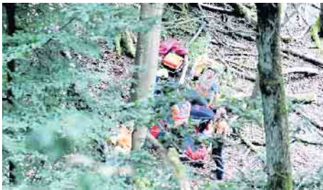
....halfen bei der Erstversorgung des jungen Mannes vor Ort.