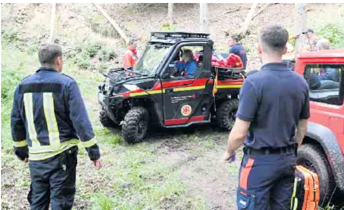
Mit ihrem „Utility Vehicle“, einer Art Buggy, konnte die Bergwacht des DRK-Kreisverbandes Euskirchen kürzlich zu einem jungen Mann gelangen, der sich weit abseits in einem schwer zugänglichen Waldgebiet bei Bad Münstereifel schwer verletzt hatte.

oder direkt per Hubschrauber nicht möglich gewesen wäre, wie Simon Jägersküpper vom DRK-Kreisverband erklärte, der an der Rettung beteiligt war. Einsatz des „Utility Vehicle“ Das stellte die Helfer vor große Herausforderungen, die man ohne die Bergwacht des Roten Kreuzes so schnell wohl nicht hätte überwinden können. Kaum war sie angefordert, stieß das vierköpfige Team mit ihrem geländegängigen „Utility Vehicle“ (UTV), einer Art Buggy, zum Schwerverletzten durch das unwegsame Gelände vor. Einen Teil des Weges hätte man laut Lars Klein vom Roten Kreuz dennoch zu Fuß zurücklegen müssen. In einer Schleifkorbtrage wurde der Verletzte dann bis zum UTV gebracht, dass ihn zu einem alarmierten Rettungshubschrauber der Bundeswehr fuhr, der außerhalb des Waldes in Richtung Lanzerath gelandet war. Dieser flog