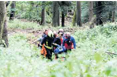
...und trugen ihn mit anderen Helfern zurück zum UTV.