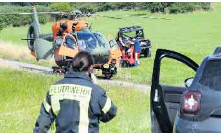
So konnte man ihn zu einem Rettungshubschrauber in der Nähe fahren, der den Bad Münstereifeler zum Mechernicher Kreiskrankenhaus flog.

den Schwerverletzten schließlich ins Mechernicher Kreiskrankenhaus. Die Bergwacht des DRK hat im Jahr nach Schätzung von Lars Klein rund zehn Rettungseinsätze. Hinzu kommen allerdings auch Sanitätsdienste bei Veranstaltungen, etwa bei Motocross-Rennen, wo das UTV benötigt wird. pp/Agentur ProfiPress