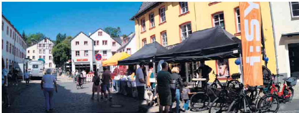
Stände an der Marktstrasse

Für die Kinder gab es eine Hüpfburg und Spielmöglichkeiten von verschiedenen wohltätigen Organisationen. Highlight war der verkaufsoffene Sonntag des City Outlet ab 13 Uhr. Besonderheit unter den Imbiss-Ständen war ein umgebauter silberner amerikanischer Schulbus auf der Marktstraße, neben dem Puma-Outlet, aber auch die normalen Restaurants und Cafés waren wieder gut besucht. Als Erinnerung an das FC Kultsportlokal „Littel Bit“ gab es am Gymnasium den Getränkestand „zum Geissböckchen bei Rudi“. MKe