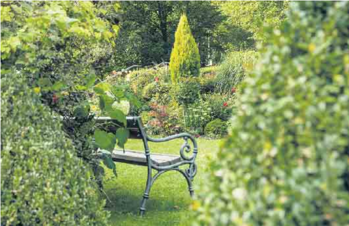
Rasengrab oder Bestattung im Blumengarten.

Urnenwand, Blumengarten oder klassische Beisetzung