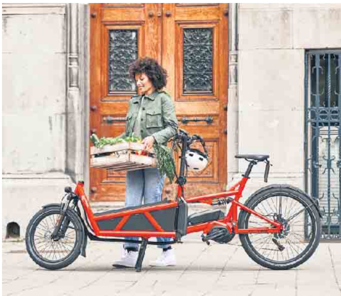
Lastenräder gehören in vielen Städten zum Alltagsbild. Mit elektrischer Unterstützung ermöglichen E-Cargobikes den bequemen Transport zum Beispiel von Wocheneinkäufen.

Sie entlasten nicht nur den Straßenverkehr, sondern schonen auch die Umwelt, da sie weniger Platz als ein Auto benötigen, keinen Lärm und keine Luftschadstoffe verursachen. Aufgrund der geringen laufenden Kosten dürften E-Cargobikes somit vielfach das bisherige Zweiauto der Familie ersetzen. Hinzu kommen zeitliche Vorteile, wenn man morgens im Berufsverkehr entspannt am Stau vorbeiradeln kann. Für Eltern, die den Nachwuchs beispielsweise zur Kita bringen möchten, eignen sich sogenannte Long-John-Modelle mit einer Ladefläche vor dem Lenker. Der Vorteil: Hier haben Mama oder Papa ihre Kids stets im Blick. Aber auch mit Long-Tail-Modellen, bei denen sich der Stauraum hinter dem Sattel befindet, lassen sich größere Kinder noch