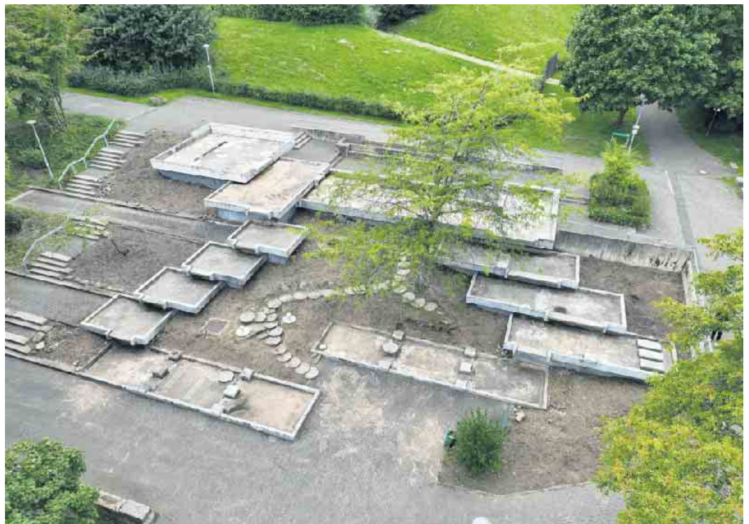
Die Sanierung der Wasserterrassen startet in den nächsten Wochen.

Im Kurpark Wallgraben startet noch im August die Sanierung der Wasserterrassen und des direkt angrenzenden Umfelds. Die in den 1970er Jahren errichteten Wasserterrassen weisen schon seit Jahren einen erheblichen Sanierungsbedarf auf. Dank Fördermitteln aus der Städtebauförderung im Rahmen des Integrierten Stadtentwicklungskonzepts (ISEK) steht nun der Sanierung der beliebten Brunnenanlage nichts mehr im Wege. Rund 720.000 Euro fließen in die Erneuerung der Becken, der Technik und der angrenzenden Sitzbereiche. Dabei entfallen 70% auf Fördermittel der Städtebauförderung. Es handelt sich um finanzielle Mittel aus dem ersten ISEK-Förderantrag 2018. Der Förderzeitraum endet 2026. Bevor ab Mitte August mit den Betonarbeiten begonnen werden kann, musste zunächst der Rückschnitt der Grünflächen um die Becken durchgeführt werden. Erhaltenswerte Pflanzen wurden dabei möglichst gesichert. Sie sollen später wieder verpflanzt werden. Zudem ist die Einrichtung einer Baustellenfläche auf einer angrenzenden Wiese an der Sebastian-Kneipp-Promenade notwendig. Die Zufahrt zu Wohngebäuden ist hiervon nicht betroffen. Für Fußgänger,