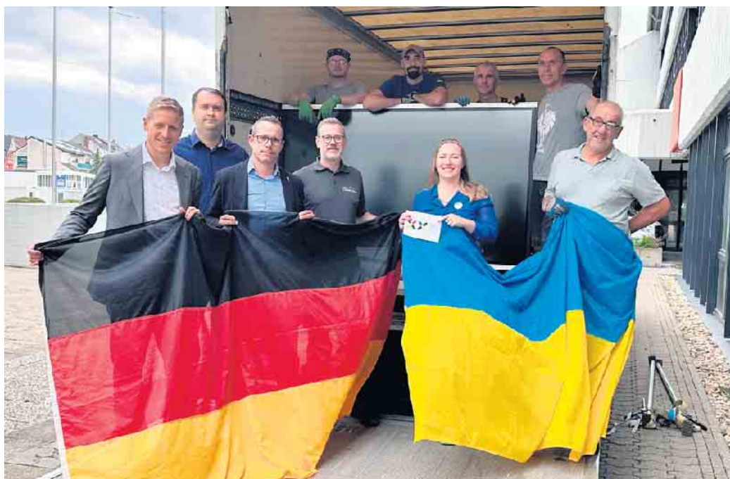
Ein Zeichen der deutsch-ukrainischen Solidarität: Insgesamt 44 digitale Tafeln spendete der Kreis Euskirchen ans Blau-Gelbe Kreuz.