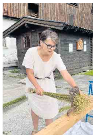
In vielen Arbeitsschritten werden aus den Flachspflanze spinnbare Fasern.