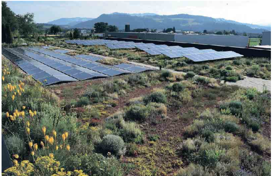
Die perfekte Kombi: Photovoltaik und Gründach.

„Ob Dachbegrünung, Photovoltaik oder Regenwassermanagement - das alles ist längst Teil unserer Ausbildung und unseres Alltags“, sagt Rolf Fuhrmann, stellvertretender Hauptgeschäftsführer des Zentralverbands des Deutschen Dachdeckerhandwerks (ZVDH). „Unsere Betriebe leisten täglich Klimaschutz und Klimaanpassung - ganz konkret auf Deutschlands Dächern.“