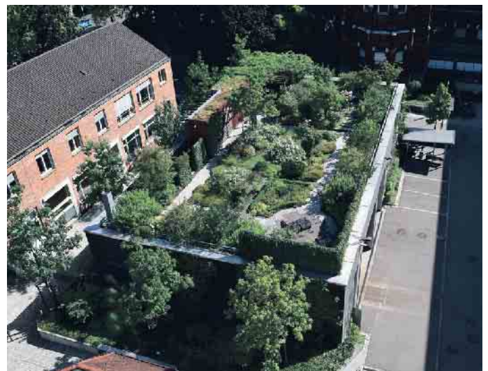
Auch Gärten sind auf Dächern möglich, es wird dann von einer intensiven Dachbegrünung gesprochen.