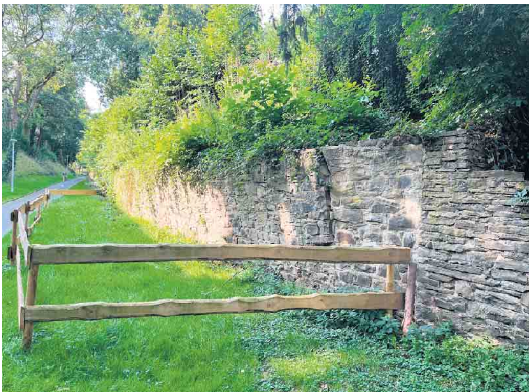
Die Sanierung der Mauer am Wallgraben ist neu in den Wiederaufbau aufgenommen worden.

Inzwischen sind vier Jahre vergangen. In dieser Zeit wurden viele Wiederaufbauprojekte umgesetzt, viele sind in Planung,