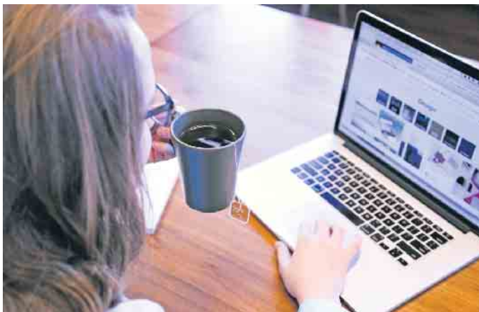
Einfach den eigenen Namen in die Suchmaschine eingeben: So lässt sich herausfinden, welchen ersten Eindruck man etwa auf Personalverantwortliche macht.

Neben Karriere- und Businessplattformen tummeln sich viele heute ebenfalls in den eher privat ausgerichteten sozialen Medien. Doch auch hier sollten Bewerber seriös auftreten. Bilder, Beiträge, Kommentare und alles, was dem eigenen Ruf schaden könnte, sollte man tunlichst löschen - selbst wenn es sich buchstäblich um Jugendsünden handelt. Auf Facebook zum Beispiel kann man einschränken, wer einen auf Fotos markieren darf. Dadurch lassen sich unangenehme Überraschungen vermeiden. Unter adeccogroup.de etwa gibt es viele weitere Tipps für das digitale Eigenmarketing und die Jobsuche. Noch ein Tipp, der auf alle sozialen Plattformen zutrifft: Ein systematisches Aufräumen