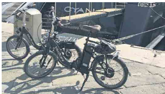
Im Urlaub sind die kompakten E-Falträder ideale Begleiter.

Moderne E-Falträder haben mit den Klapprädern aus den 70er- und 80er-Jahren wenig zu tun. Sie lassen sich zwar noch immer in der Mitte zu einer handlichen, leicht transportablen Größe zusammenklappen, nunmehr ist allerdings auch ein leistungsfähiger Elektromotor als Zusatzantrieb eingebaut. Solche E-Falträder lassen sich in jedem Wohnmobil und im Kofferraum der meisten Autos transportieren, ein spezieller Fahrradträger ist nicht nötig. Wichtig ist dabei auch das Gefühl der Sicherheit. Dafür sorgen der tiefe Einstieg der Räder und die Tatsache, dass man mit beiden Füßen sicher auf den Bo-