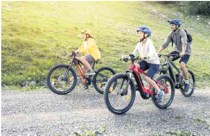
Reisen mit dem Rad: Das ist nachhaltig, abwechslungsreich und ein Spaß für die ganze Familie. Die elektrische Unterstützung eines E-Bikes erhöht dabei die Reichweite deutlich.

Nicht immer muss es eine längere Strecke sein: Mit Baggerseen und Naturschutzgebieten locken auch in der näheren Region reizvolle Ziele, die sich bequem von zu Hause aus erreichen lassen. Praktisch sind dabei Lastenräder mit elektrischer Unterstützung: Ein E-Cargo-Bike hat genug Platz, um alle Utensilien für ein Picknick zu transportieren. Kraftvolle Unterstützung im richtigen Moment und ein sicheres Fahrgefühl bietet etwa die Cargo Line von Bosch. Beim „Long John“ mit der Ladefläche zwischen Lenker und Vorderrad hat man die Kids stets