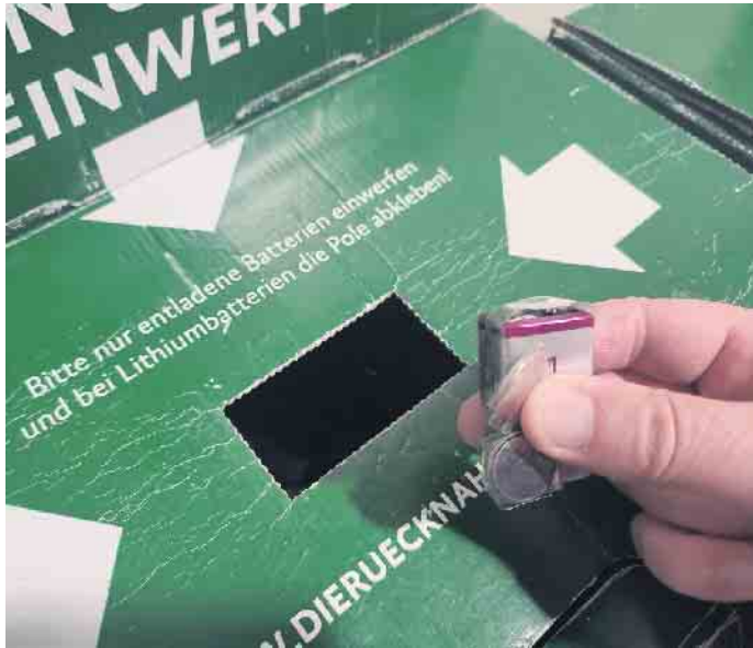
Die Pole des Lithium-Ionen-Akkus oder der -Batterie zuerst mit einem Klebeband abkleben. Dann die Akkus und Batterien kostenlos an einer Rücknahmestelle in ihrer Nähe zurückzugeben: Im Schadstoffmobil, am Abfallwirtschaftszentrum und überall dort, wo Batterien und Akkus verkauft werden (Supermarkt, Baumarkt, Drogerie etc.).

E-Mail: abfallberatung@kreis-euskirchen.de ).