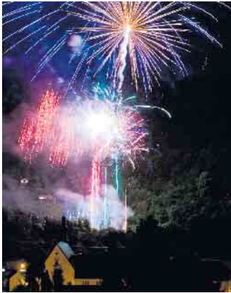
Am Samstagabend illuminiert das große Höhenfeuerwerk die historische Altstadt.

Aufgrund der Kirmes ist die Langenhecke noch bis zum 23.07.2024 zwischen Klosterplatz und Marktstraße für den Verkehr gesperrt. Dies gilt auch für die Parkplätze in diesem Bereich. Der Wochenmarkt wird am 19.07.2024 auf den Salzmarkt verlegt. Zudem ist anlässlich des Feuerwerks am 20.07.2024 der Parkplatz östlich der L194 (Fahrtrichtung Euskirchen) sowie der Parkstreifen entlang des Roderter Kirchweges ganztägig gesperrt. Auch die Zufahrt in die Kernstadt über den Parkplatz ist an diesem Tag nicht möglich.