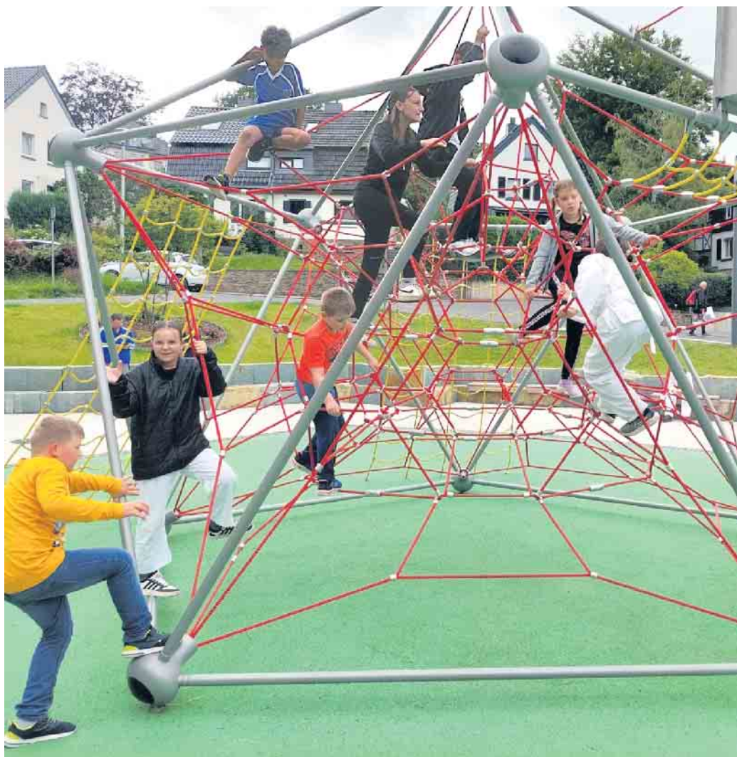
Karate auf dem Klettergerüst.