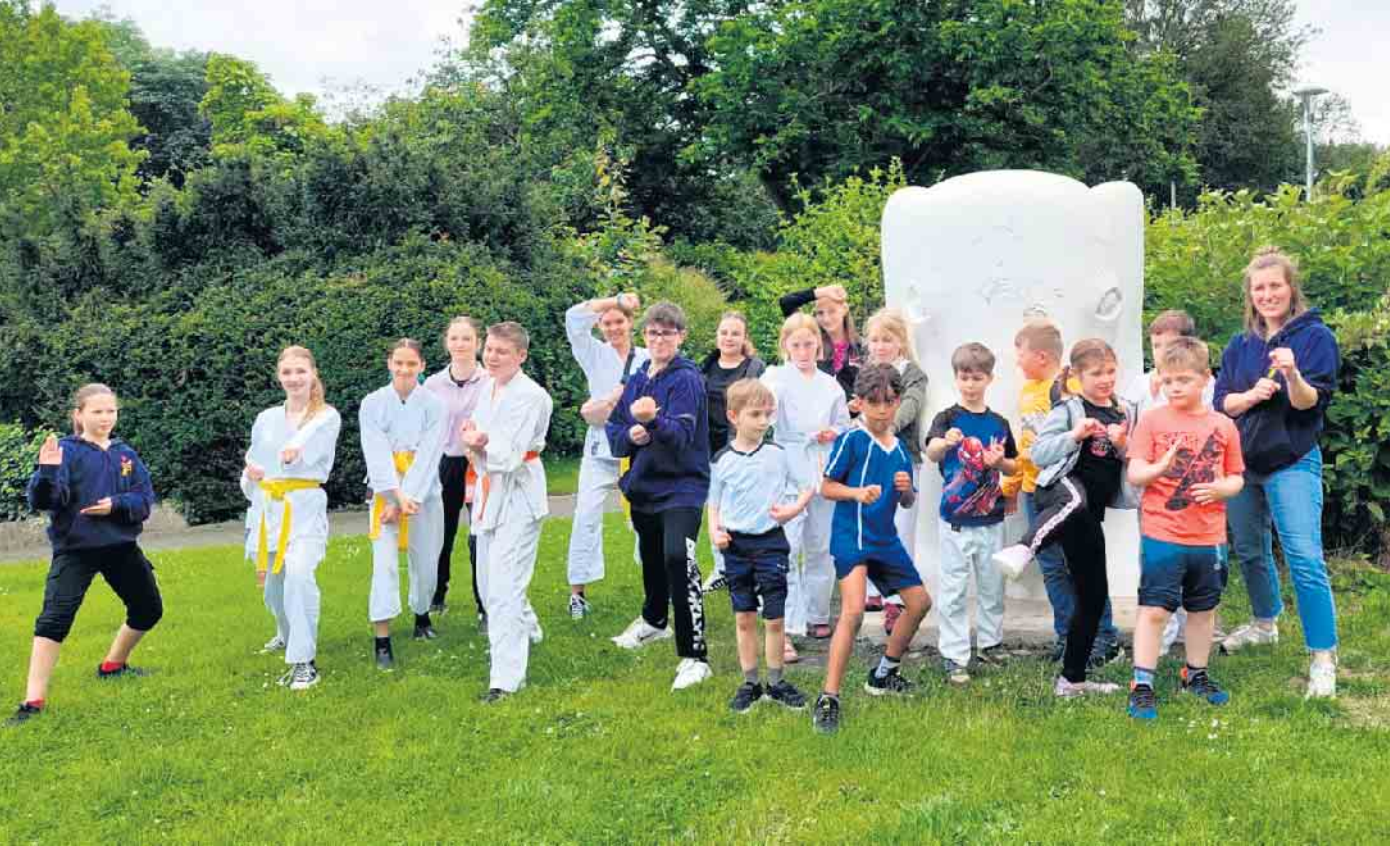
Trainingseinheit im Kurpark.

In den Sommerferien haben die Kinder der Karateabteilung kein Training. Erfahrungsgemäß fahren viele Eltern mit ihren Kindern in Urlaub. Deshalb pausiert das Kindertraining in den Ferien. Auch die Trainer und Trainerinnen gönnen sich von den über 80 Kindern in der Karateabteilung eine Pause. Zum letzten Training am Freitag, 5. Juli, war nicht wie üblich barfuß