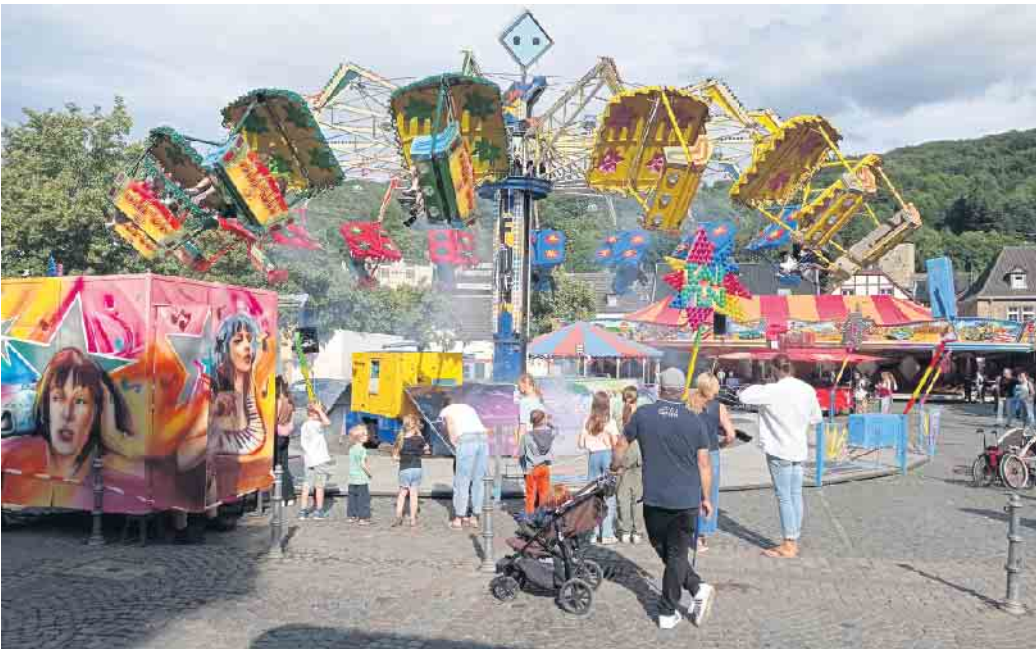
Mehrere Fahrgeschäfte laden auf der Kirmes zum Mitfahren ein.

Am Sonntag, 21. Juli, wartet die Kirmes ab 14 Uhr noch einmal mit musikalischer Unterhaltung am Biergarten auf. Den Abschluss findet die Kirmes schließlich am Montag, 22. Juli, mit dem Familientag, an dem die Schausteller ihre Attraktionen zu vergünstigten Preisen anbieten. Den Kirmesbesuch am Wochenende können