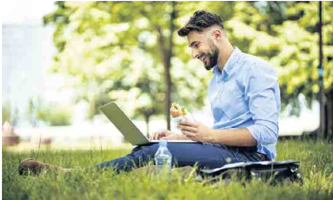
Bei jüngeren Mitarbeitern mit hoher digitaler Affinität hat vor allem das mobile Arbeiten stark an Beliebtheit gewonnen.

währleisten sei nicht immer leicht - etwa wenn das Office auf die Wiese im Park verlegt wurde. (djd)