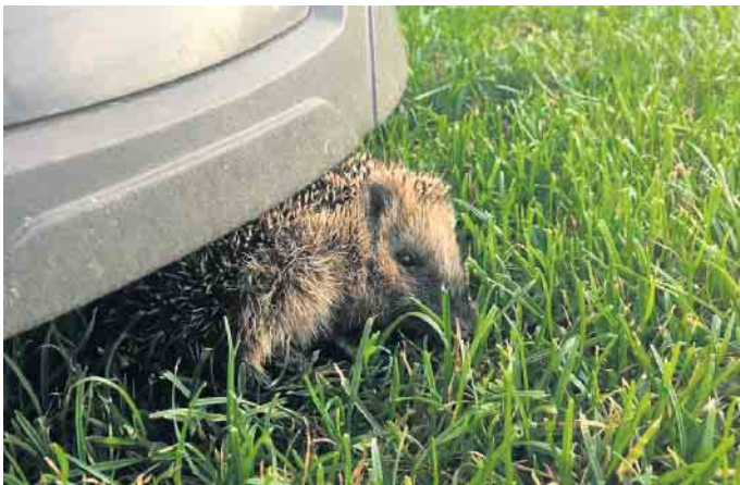
Igel unter Mähroboter.

mische Tierwelt - insbesondere für Igel - zur tödlichen Bedrohung werden. Besonders problematisch wird es, wenn die Rasenroboter in den Abend- und Nachtstunden laufen, wenn viele Tiere auf Nahrungssuche unterwegs sind. Igel