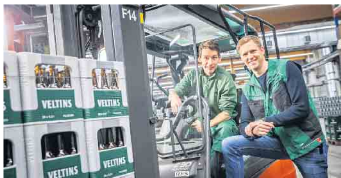
Fachkräfte für Lagerlogistik sollten über räumliches Vorstellungsvermögen verfügen, sie sollten organisatorisches und praktisches Geschick besitzen und Interesse und Spaß an Technik haben.