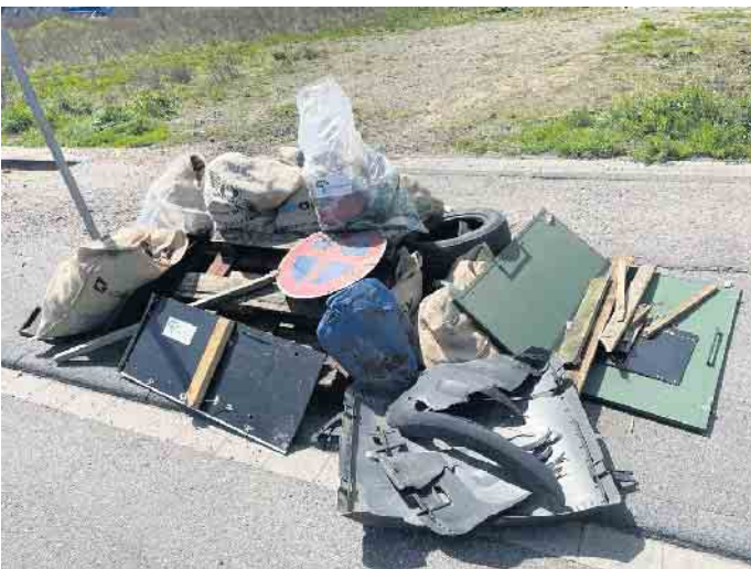
Beim Clean-up in Weilerswist wurden insgesamt 45 Müllsäcke von wildem Müll gesammelt und viele größere „Objekte“, wie Schrankteile, Paletten und auch ein Straßenschild.

Viel Engagement in der Bevölkerung, aber auch viel „Wilder Müll“