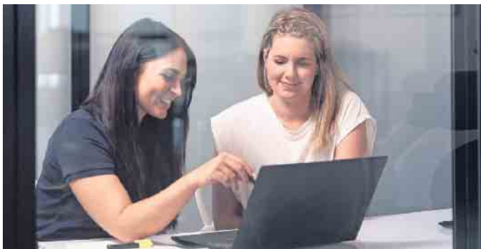
Theorie und Praxis gehen bei der Qualifizierung in der Gesundheits- und Fitnessbranche Hand in Hand.

Ausbildung und Karriere in der stark wachsenden Fitness- und Gesundheitsbranche