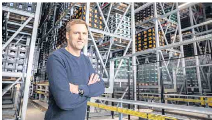
Die Hochregallager in der Brauerei haben eine Höhe von bis zu 35 Metern und umfassen 41.000 Palettenstellplätze.

Berufe: Fachkräfte für Lagerlogistik haben in Firmen eine bedeutsame Funktion