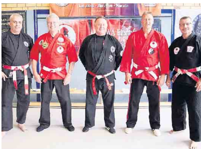
Organisatoren des Budo Seminar Eifel

Organisatoren Taiwa Style Qin-Na: taiwa-style-qinna.de Budo Abteilung TuS Schleiden: www.jiu-jitsu-schleiden.com Bei Interesse kann kostenlos an einem Probetraining teilgenommen werden.