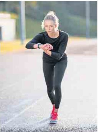
Immer mehr Menschen halten sich mit Sport fit und nutzen dabei auch sogenannte Wearables wie eine Fitnessuhr.

solventinnen und Absolventen, digitale Trainings-, Assistenz- und Datenverarbeitungssysteme speziell für die Sport-, Fitness- und Gesundheitsbranche zu entwickeln. (djd)