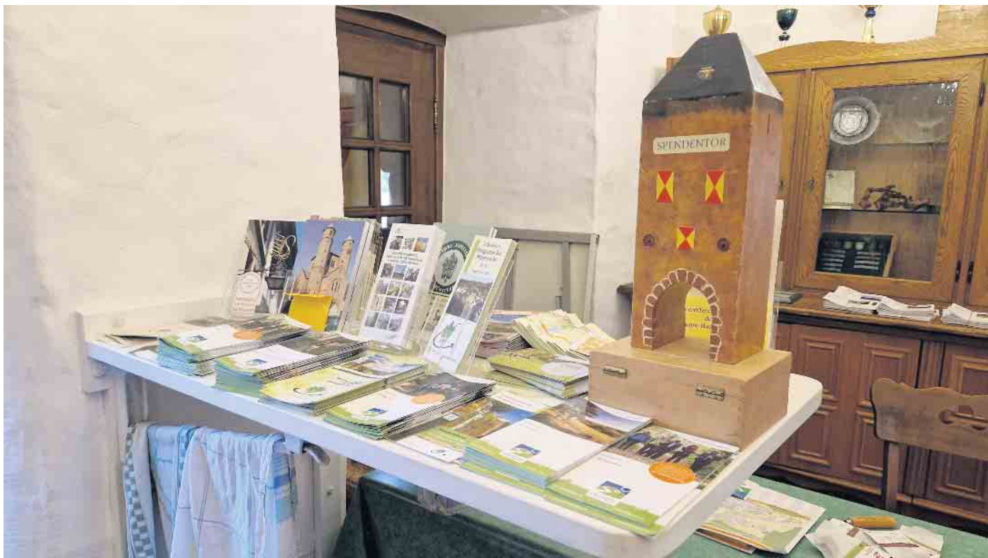
Infomaterial und Spendenbox am Eingang des Johannistores.