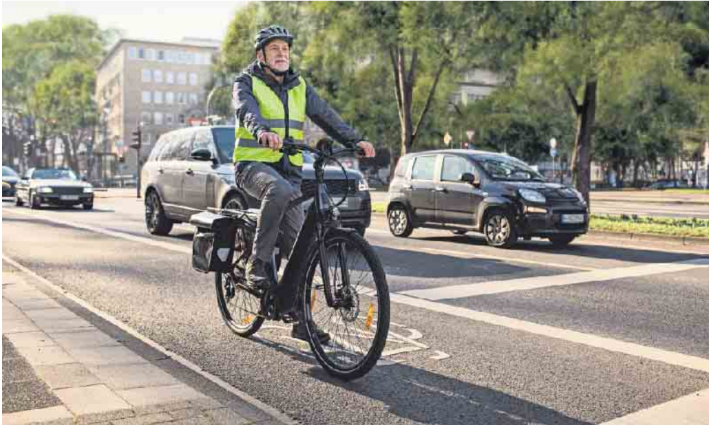
Die bundesweite Kampagne „Tour de Freude - sicher unterwegs mit dem Pedelec“ will Unfällen mit dem Pedelec vorbeugen.

Bundesweite Kampagne will Unfällen mit Elektrofahrrädern vorbeugen