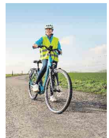
Pedelecs sind zu einer wichtigen Form der privaten Mobilität geworden, eine Kampagne will zu mehr Sicherheit auf den Elektrofahrrädern beitragen.

Mit der zunehmenden Verbreitung von Elektrofahrrädern stiegen in den vergangenen Jahren auch die Unfallzahlen: Im Jahr 2021 verunglückten laut Statistischem Bundesamt 17.045 Menschen auf einem Pedelec, 131 davon tödlich. Bezogen auf 1.000 Pedelec-Unfälle mit Personenschaden kamen im Jahr 2021 durchschnittlich 7,6 Fahrende ums Leben, bei einem herkömmlichen Fahrrad waren es 3,5. Auch in der aktuellen Umfrage schätzt mehr