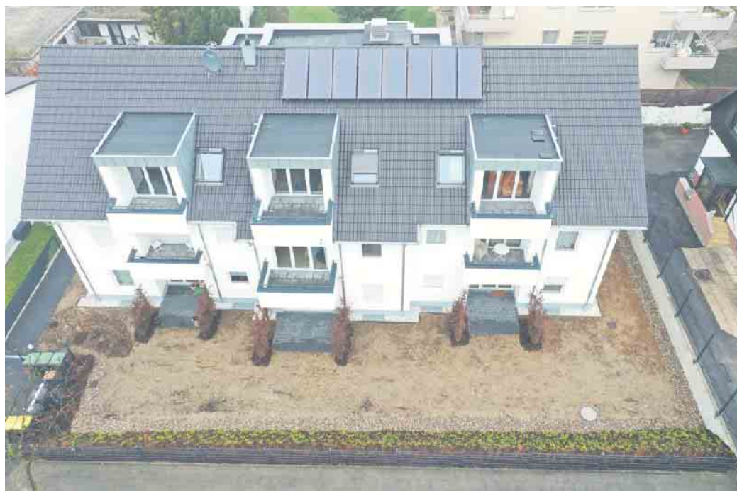
Das Dachdeckerhandwerk, der richtige Ansprechpartner für die Solaranlage auf dem Dach.

Im Bereich Gebäudesektor liegt Deutschland im Vergleich mit den zwanzig wichtigsten Industrieländern bei der Energieeffizienz im Neubau vorne. Die weniger gute Nachricht ist die