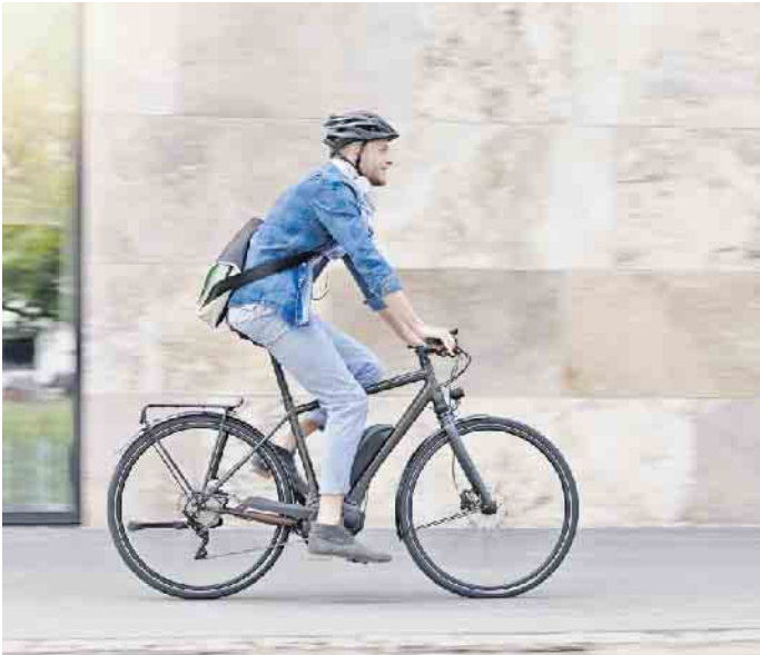
Ob für den Weg zum Arbeitsplatz oder für Freizeitaktivitäten: Immer mehr Menschen in Deutschland satteln auf ein E-Bike um.

Umfrage: Fast jede vierte Person in Deutschland besitzt bereits ein E-Bike