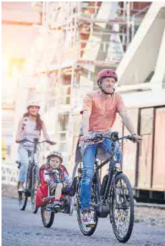
Selbst körperlich aktiv werden und etwas für den Umweltschutz tun: Diese Motive sind E-Bike-Nutzern laut einer E.ON-Umfrage unter anderem besonders wichtig.

Viele Nutzer entdecken das Zweirad als praktikable und umweltfreundliche Alternative zum Automobil - zum Beispiel für die tägliche Pendelstrecke zum Arbeitsplatz. 27,6 Prozent der Befragten, die noch kein Elektrofahrzeug besitzen, könnten sich vorstellen, für kurze Strecken bis zehn Kilometer auf ein E-Bike umzusteigen, statt ein Fahrzeug mit Verbrennungsmotor zu nutzen. Der klare Favorit ist insgesamt das City-E-Bike (41,3 Prozent), gefolgt vom Trekking-E-Bike (30 Prozent) und dem E-Mountainbike (11,9 Prozent). Besonders klimafreundlich ist die Gesamtbilanz des elektrischen Fahrrades, wenn es ausschließlich mit Ökostrom geladen wird. Immerhin 29,1 Prozent der E-Bike-Besitzer nutzen bereits diese Option. Und 31,8 Prozent der 18- bis 29-Jährigen, die sich demnächst ein E-Bike anschaffen möchten, könnten sich vorstellen, beim Kauf zu einem Ökostromtarif zu wechseln. (DJD)