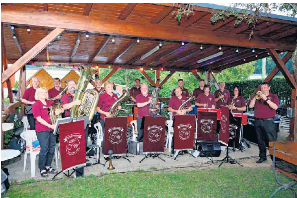
Biergartenkonzert der Eifeldombläser.

Die Eifeldombläser aus Houverath freuen sich auf neue Mitglieder und laden zum Musizieren ein.