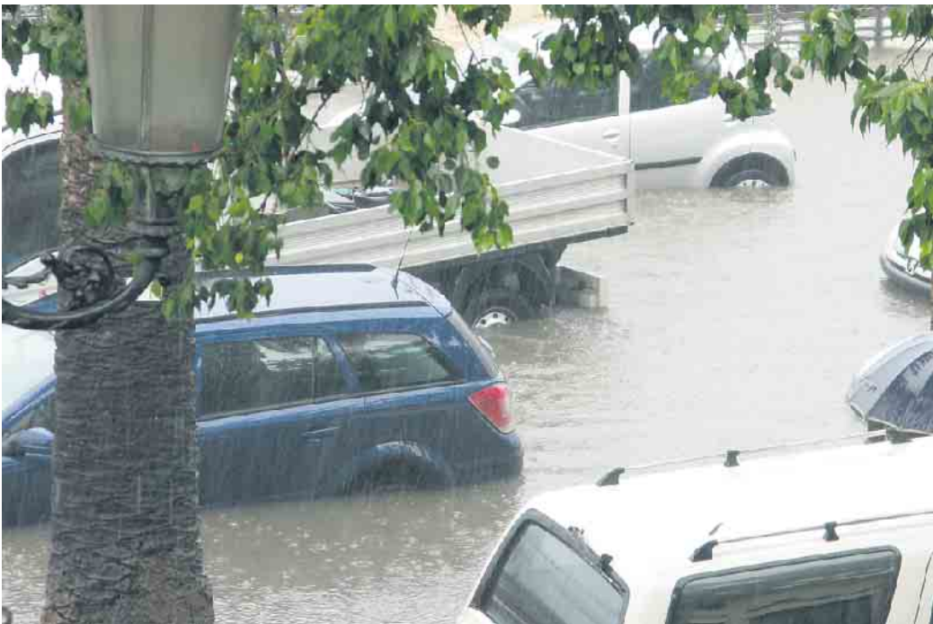
Wer in Überflutungsgebieten mit dem Auto unterwegs ist, sollte seine Wege mit Bedacht wählen.

Wer in Überflutungsgebieten mit dem Auto unterwegs ist, sollte seine Wege mit Bedacht wählen. „In Senken und Unterführungen kann sich bei starken Niederschlägen Wasser ansammeln. Autofahrer sollten keinesfalls mit Schwung durch das Wasser fahren, sondern, wenn überhaupt, vorsichtig im Schrittempo“, warnt Oliver Reidegeld, Sprecher des ADAC Hessen-Thüringen. „Tiefe und Strömungsgeschwindigkeit des Wassers können von außen schlecht eingeschätzt werden. Autos könnten mitgerissen werden oder stecken bleiben. Gerät Spritzwasser in den Ansaugbereich des Motors, droht zudem ein Motorschaden.“ Der ADAC rät, bei Regen besonders aufmerksam zu fahren, die Geschwindigkeit zu reduzieren und abrupte Fahrmanöver zu vermeiden. Zudem ist eine ausreichende Profiltiefe wichtig, damit die Reifen genug Grip haben und das Wasser verdrängen können. Bei zu hohen Geschwindigkeiten droht Aquaplaning. Je nachdem wie hoch das Auto im Wasser stand, können mögliche Schäden variieren. Stand das Auto bis zu den Fenstern im Wasser, ist ein Totalschaden wahrscheinlich. Startversuche im Wasserbad sollten nur dann unternommen werden, wenn absolut ausgeschlossen werden kann, dass sich Wasser im Verbrennungsluft-Ansaugtrakt befindet und technischen Instru-