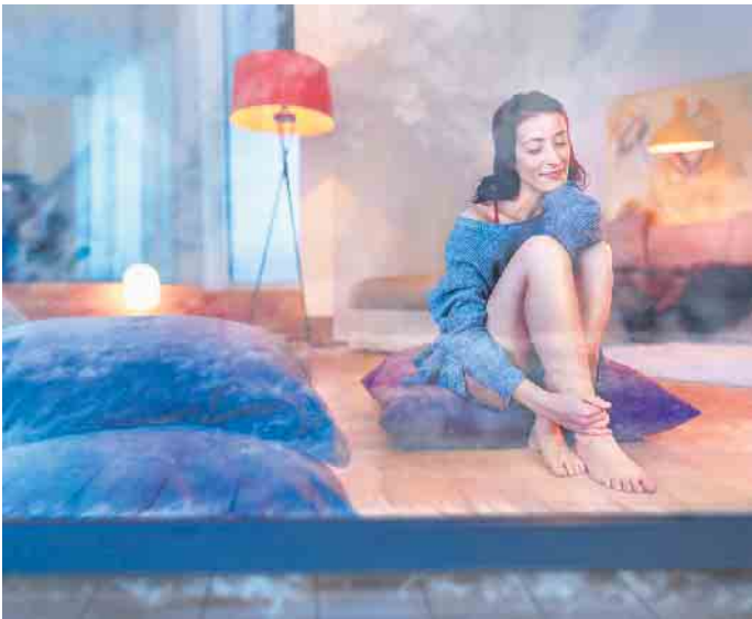
Wohlfühlen in den eigenen vier Wänden: Eine nachträgliche Dämmung von Dachboden und Kellerdecke senkt den Energieverbrauch und trägt zu einem angenehmen Raumklima bei.

Dach und Keller des Eigenheims sind Kälte und wechselnden Wit-