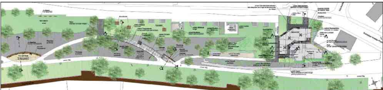
Gefördert im Rahmen der Städtebauförderung durch: