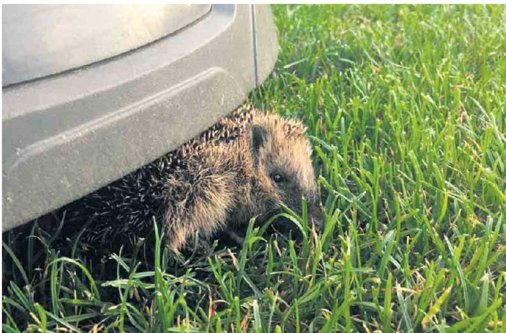
Igel unter Mähroboter.

Die Untere Naturschutzbehörde des Kreises informiert: Mähroboter sind praktische Helfer im Garten: Sie halten den Rasen stets kurz und arbeiten leise und effizient. Doch was für den Menschen komfortabel ist, kann für die heimische Tierwelt - insbesondere für Igel - zur tödlichen Bedrohung werden. Besonders problematisch wird es, wenn die Rasenroboter in den Abend- und Nachtstunden laufen, wenn viele Tiere auf Nahrungssuche unterwegs sind. Igel sind dämmerungs- und nachtaktive Tiere. Sobald es dunkel wird, beginnen sie, durch Gärten, Hecken und Wiesen zu streifen - auf der Suche nach Insekten, Würmern und Schnecken treffen sie leider immer häufiger auf in Betrieb genommene Mähroboter. Da Igel sich bei Gefahr nicht schnell in Sicherheit bringen, sondern sich auf der Stelle zusammenrollen, erkennen die Geräte sie nicht als Hindernis. Die Folge sind schwere Verletzungen durch die rotierenden Klingen - oder sogar der Tod. Nicht nur Igel sind betroffen. Auch Frösche, Kröten, junge Hasen, Mäuse oder kleine Reptilien können Opfer der automatischen Mäher werden. Viele dieser Tiere tragen wesentlich zum ökologischen Gleichgewicht im Garten