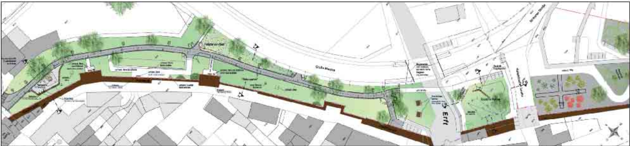
Gefördert im Rahmen der Städtebauförderung durch: