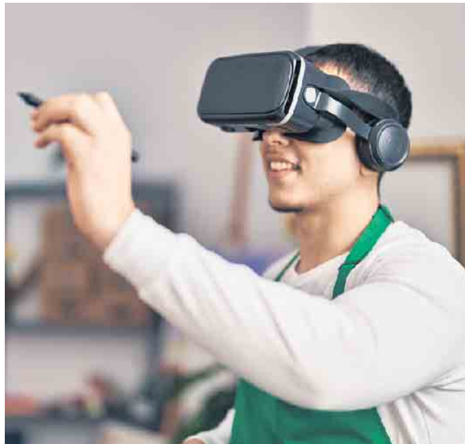
Bei der Gewinnung von Azubis setzt die Glasindustrie modernste Technologien ein. Mittels VR-Brille können Interessierte virtuell in den Beruf hineinschnuppern.

Jetzt informieren unter www.zukunftimglas.de (akz-o)