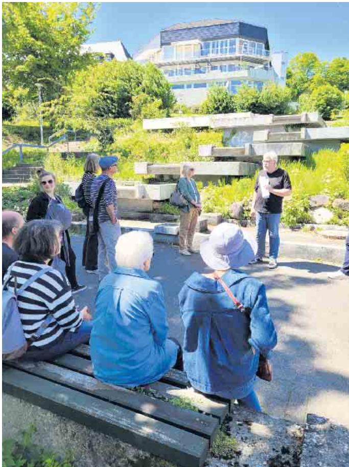
Die Sanierung der Wasserterrassen interessierte die Anwesenden besonders.

Für die zahlreichen Radfahrer in Bad Münstereifel wird nahe des Orchheimer Tors die Möglichkeit geschaffen, künftig dort Akkus von E-Bikes zu laden. Entlang der Stadtmauer in diesem Abschnitt werden neue Spiel- und Bewegungspunkte, beispielsweise ein Slackline-Parcours und ein Trampolin, errichtet. Außerdem soll nach und nach ein Skulpturenpark entstehen, der die bereits vorhandenen Stelen ergänzen wird. Am Ufer der Erft entstehen einladende Sonnenliegen zum Verweilen. Im Bereich „Wallgraben/Eifelblick“ werden die Grünflächen umfassend überarbeitet und teilweise neu gestaltet. Ein Outdoor-Fitnessbereich schafft Raum für Bewegung an der frischen Luft, während zahlreiche Sitzgelegenheiten - insbesondere am Eifelblick - zum Ausruhen einladen. Ein Element, das dort bereits fertiggestellt