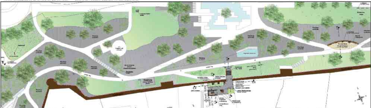
Gefördert im Rahmen der Städtebauförderung durch: