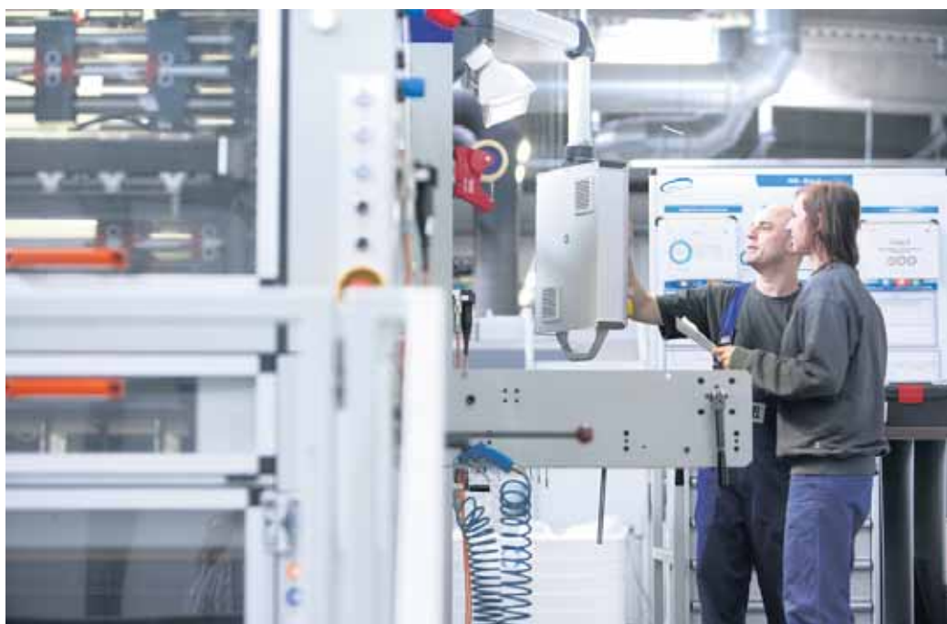
Ausbildung an hochmodernen Produktionsmaschinen in der Faltschachtel-Industrie.

Kennen Sie Unboxing-Videos? Das sind Filme, die Menschen beim Auspacken von Produkten zeigen. Auf YouTube gehören sie schon seit vielen Jahren zu den beliebtesten Formaten und werden millionenfach angeklickt. Man kann das kurios finden. Der Unboxing-Trend zeigt aber, wie inspirierend Verpackungen auf Menschen wirken können. Ob Lebensmittel, Kleidung oder Kosmetik - wir schätzen es, wenn die Dinge des täglichen Lebens in ansprechenden Faltschachteln, Beuteln, Dosen oder Flaschen angeboten werden. Wie Verpackungen erdacht und hergestellt werden, darüber denken wir in der Regel nicht nach. Dabei laufen sehr komplexe Prozesse ab, bevor ein Produkt wohlverpackt im Regal steht - vom Design über die Materialauswahl bis hin zur Herstellung. Genau das macht Jahr für Jahr Berufs-