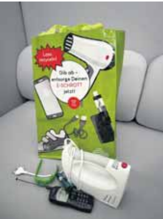
Die neuen Sammeltaschen dienen der bequemen Sammlung und dem Transport von kleinen, ausgedienten Elektroaltgeräten bis zur Sammelstelle.

Geräten zu entfernen und getrennt zu entsorgen. Weiterführende Informationen zu diesem Thema gibt es bei der Abfallberatung der Kreisverwaltung Euskirchen. Kontakt: Telefon 02251 / 15 - 530; E-Mail: abfallberatung@kreis-euskirchen.de