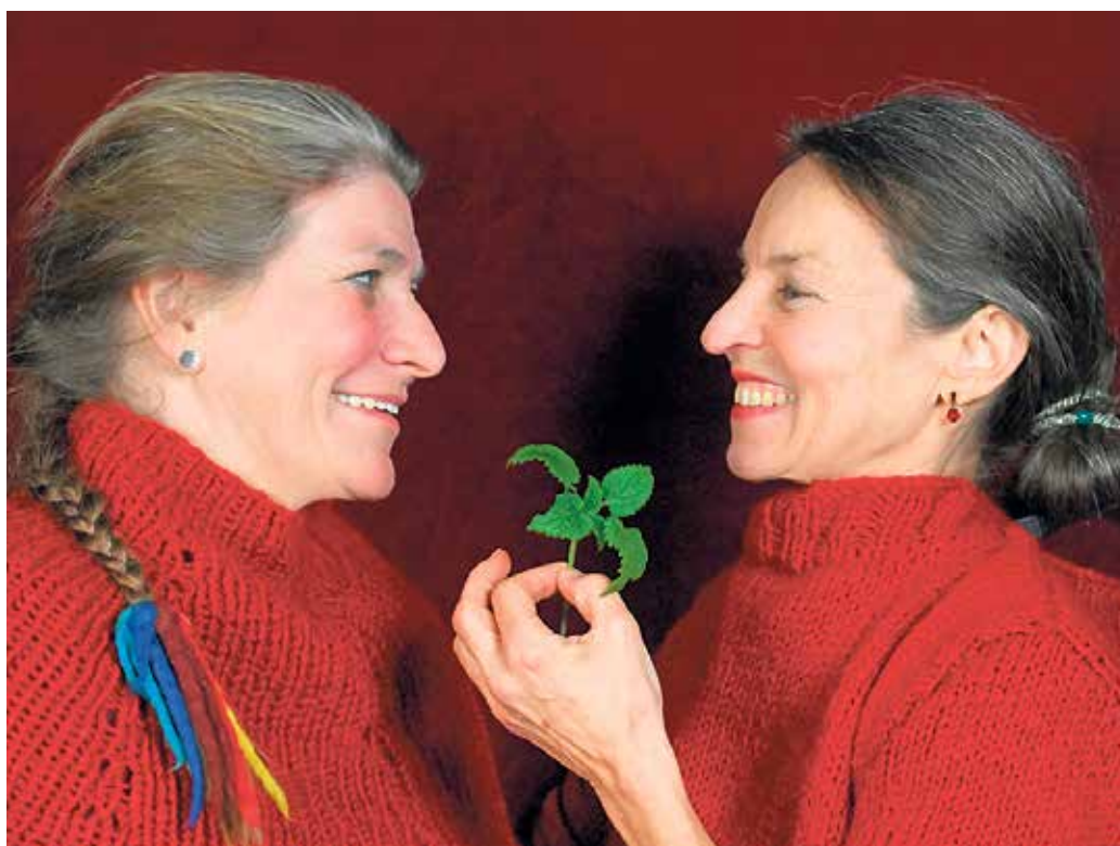
Christiane und Christiane freuen sich über Grünes.

Kräuterwanderung, Vortrag, Gedichte und Menü