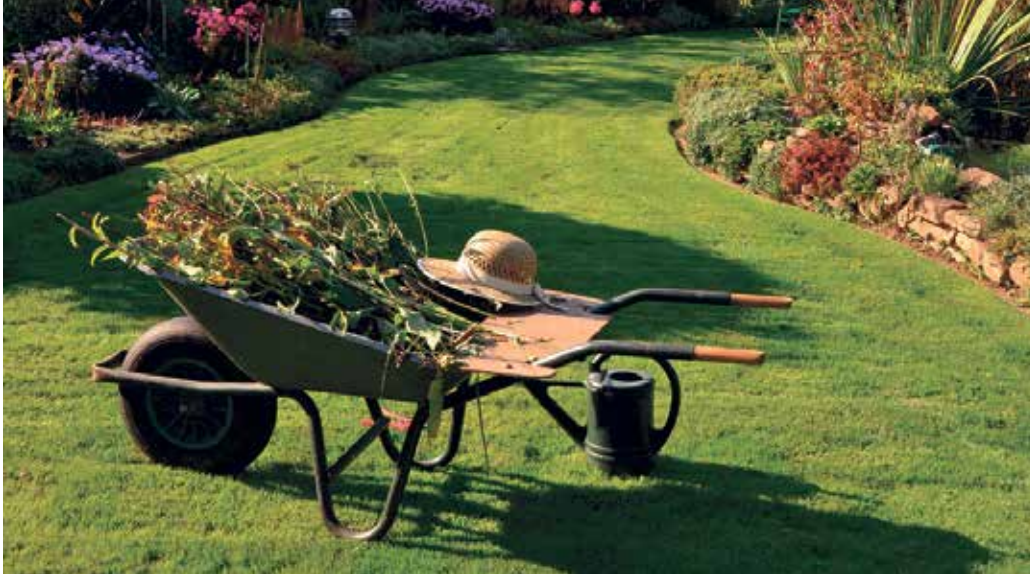
Nun ist der richtige Zeitpunkt für den Rückschnitt.

Auf die richtige Gartenpflege kommt es an