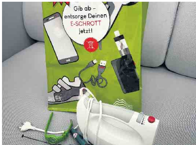
Die neuen Sammeltaschen dienen der bequemen Sammlung und dem Transport von kleinen, ausgedienten Elektroaltgeräten bis zur Sammelstelle.

Ab sofort können die Haushalte des Kreises Euskirchen wieder kostenlose Sammeltaschen für ausgediente Elektrokleingeräte erhalten. Ziel der kreisweiten Aktion ist es die Sammelquote für kleine, nicht mehr reparable Elektrogeräte zu steigern. Die jüngste Restmüllanalyse des Kreises hat ergeben, dass diese allzu oft falsch entsorgt werden und in der Restmülltonne landen. Das muss sich ändern, um wertvolle Rohstoffe wiederzuverwerten und Schadstoffe aus der Umwelt fern zu halten. Sie gehören getrennt entsorgt zum E-Schrott.