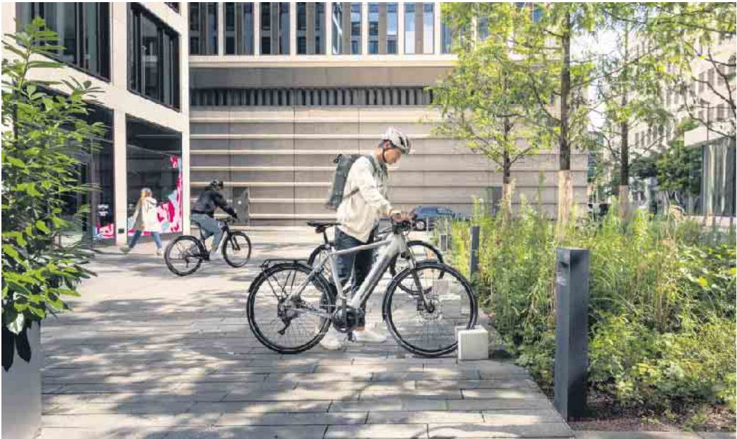
Sorgenfreier unterwegs: Mit einem digitalen Diebstahlschutz wird das Abstellen von E-Bikes noch sicherer.

Digitaler Diebstahlschutz für das Pedelec