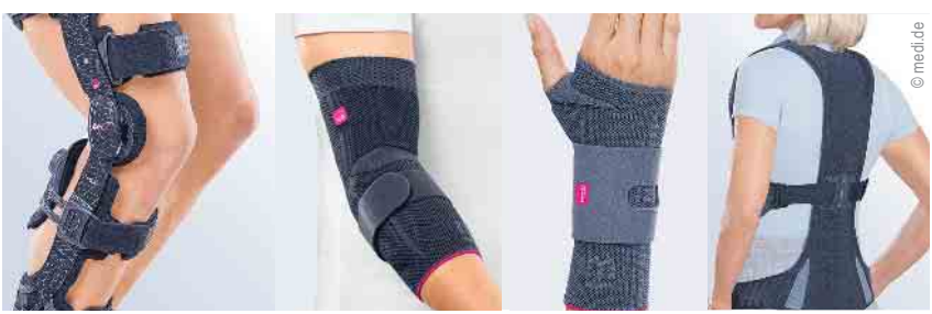
Direktversorgung von Bandagen und Orthesen