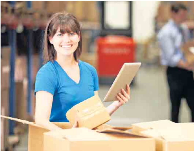
Für deutsche Arbeitnehmer werden monetäre Personalzusatzleistungen wie etwa eine vom Arbeitgeber finanzierte private Krankenzusatzversicherung immer wichtiger.