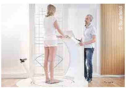
3D-Vermessung für Kompressions- strümpfe und orthop. Einlagen

Öffnungszeiten: Montag, Dienstag, Donnerstag und Freitag 09.00 bis 13.00 Uhr und 14.30 bis 18.00 Uhr | Mittwoch 09.00 bis 13.00 Uhr | Samstag geschlossen