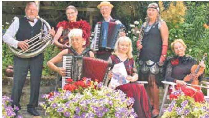
Das Salon-Ensemble Beda gastiert im Kulturhaus.

Das „Salon Ensemble Beda“ tut dies authentisch, virtuos und mit vielen Hintergrundinformationen zu den einzelnen Liedern und deren Urheber.