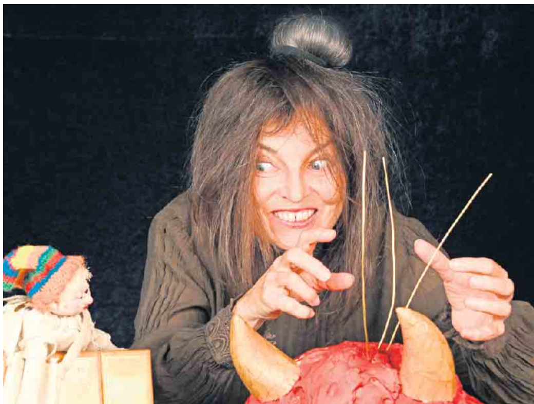
Das Glückskind bei der Großmutter des Teufels.

Tickets gibt es an der Tageskasse; Kartenzahlung ist nicht