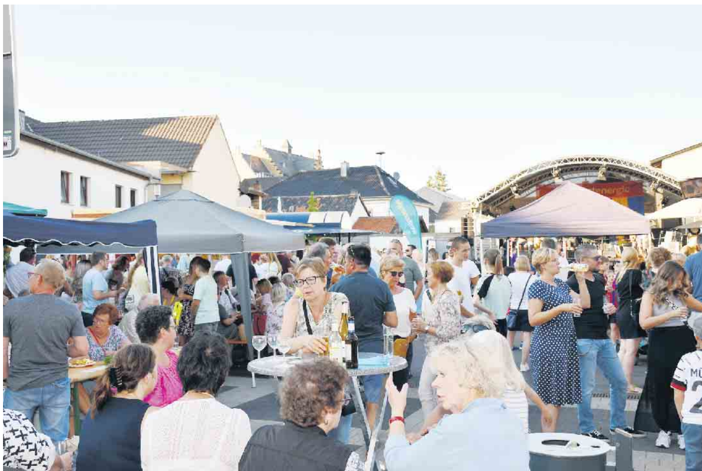
Mechernicher Stadtfest 2022 in Kommern.

Ehrenamtsagentur des Kreises bietet ein kostenloses Seminar auch für Mechernicher Vereinsvertreter an