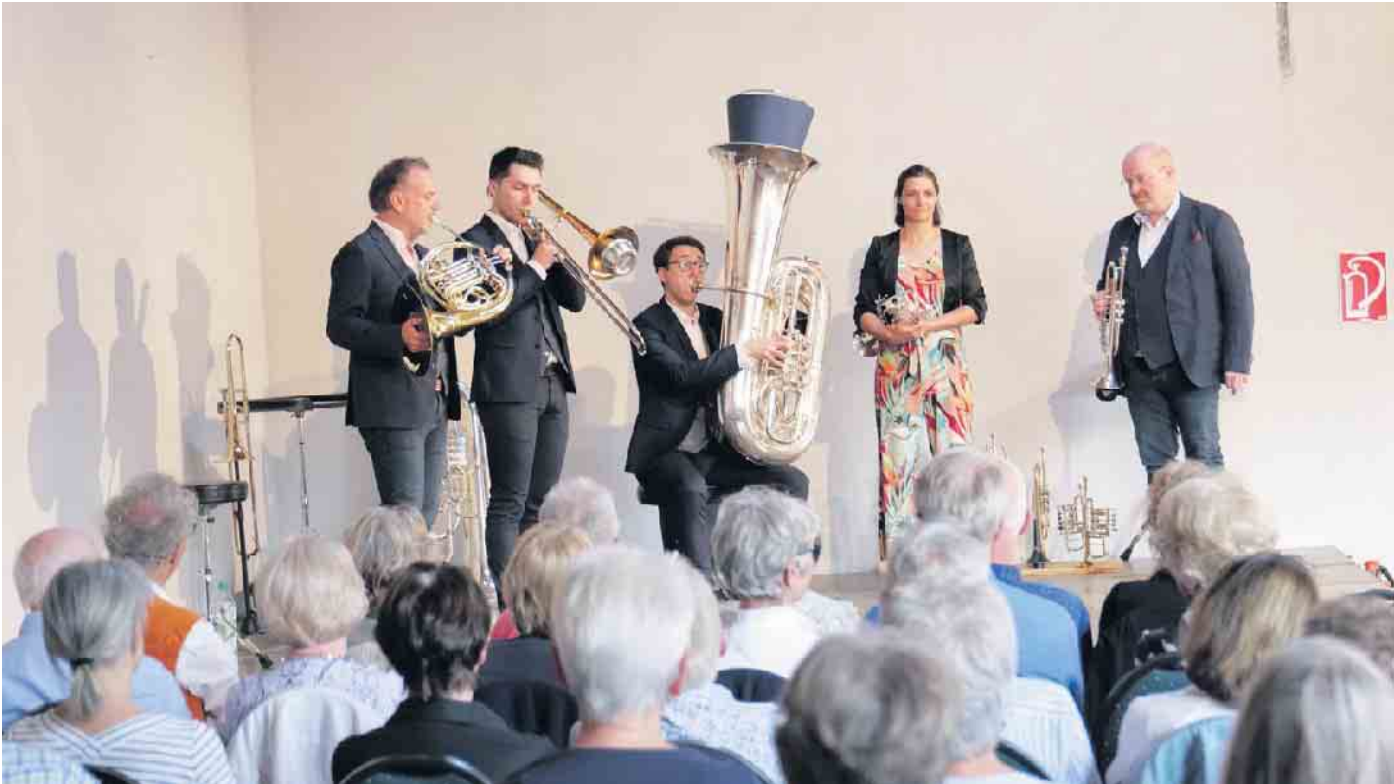
Harmonic Brass im letzten Jahr in Billig