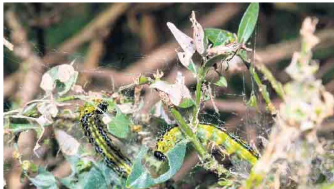
Die Raupen des Buchsbaumzünslers befallen einen Buchsbaum.

Buchsbaum-Schnittgut können auch direkt am Abfallwirtschaftszentrum Mechernich (AWZ) angeliefert werden. Bitte am Eingang (Wiegehaus) Bescheid geben, dass das Schnittgut vom Buchsbaumzünsler befallen ist. Sollten für den Transport Plastikmüllsäcke genutzt werden, so sind diese am