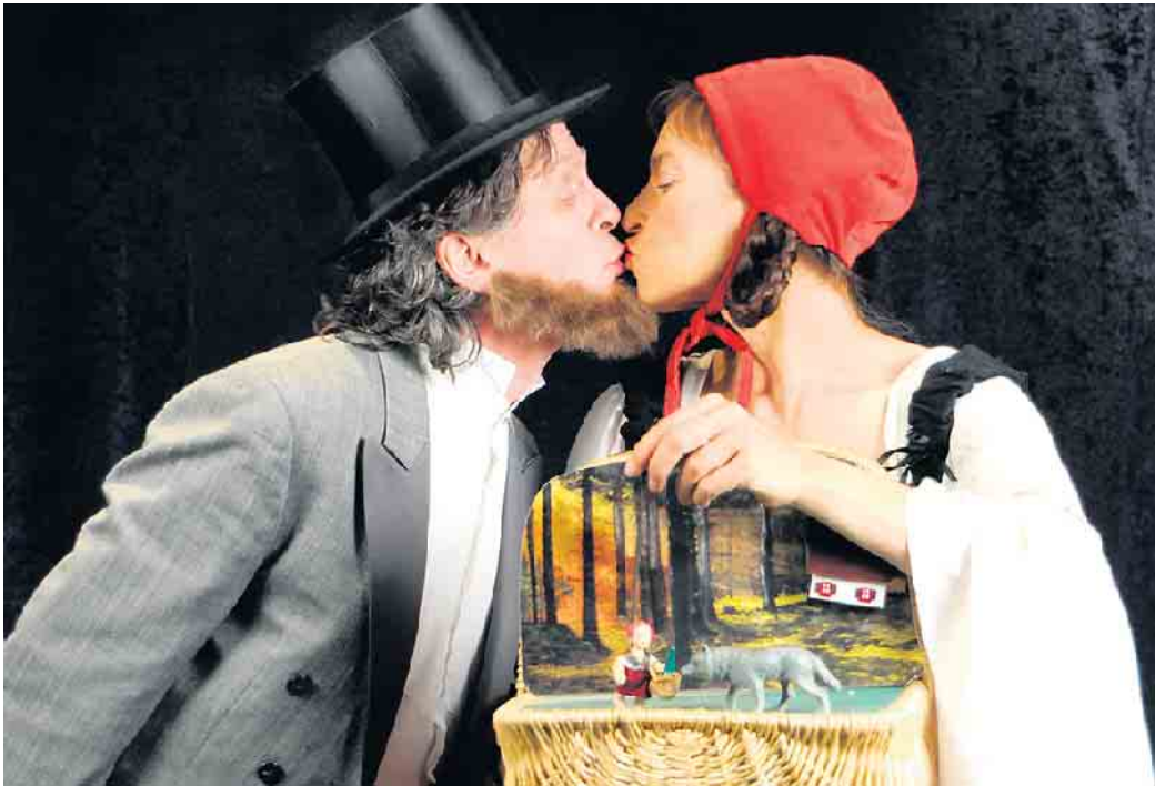
Happy End?

Das „theater 1“ hat mit dieser Inszenierung eine Komödie geschaffen, die weder ein süßliches Rotkäppchen-Märchen noch ein