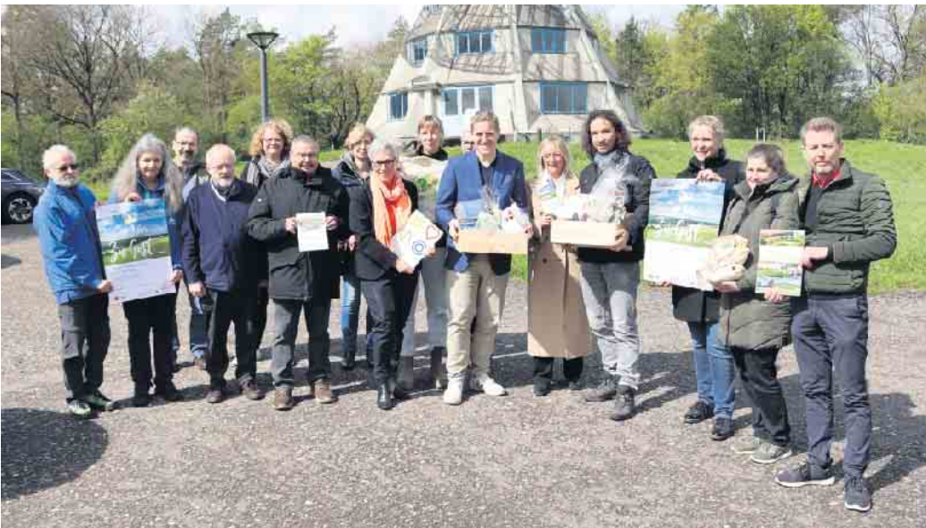
Vor dem Astropeiler Stockert versammelten sich die Verantwortlichen der Veranstaltung „Zu Gast in der eigenen Heimat“.