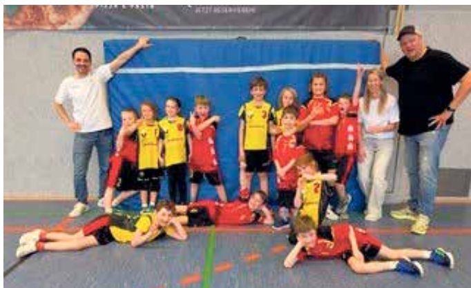
TVE Handball F-Jugend

Ein sportlich erfolgreicher und rundum gelungener Vormittag liegt hinter der F-Jugend des TVE Bad Münstereifel 1905 e.V.: Beim Spielfest am