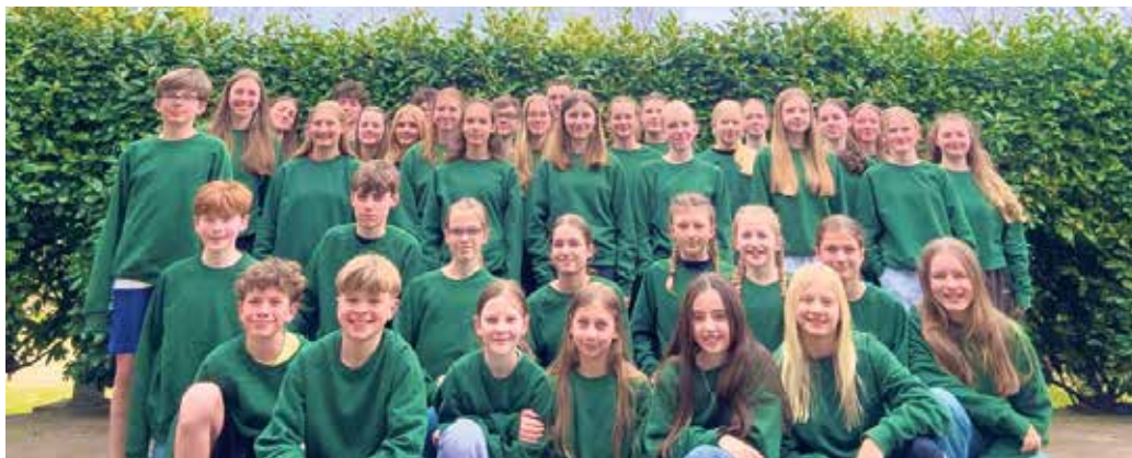
Trainingslager-Teilnehmer des TV Rheinbach.

probieren, alternativ beim Minigolf. Außerdem gab es natürlich wieder das traditionelle Hockeyturnier und die Intervallstaffel zum Abschluss des Trainingslagers. Abends hatten alle Spaß mit dem Line Dance Memphis, bevor alle Tanzbegeisterten Discofox und Bachata mit zahlreichen Figuren lernen konnten. Spiele-, Film- und Quizabende rundeten die Freizeit ab. Am Samstag, 4. April, ging es für alle mit dem Zug zurück. Diesmal mit einem längeren Zwischenstopp in Bremen, wo neben etwas Sightseeing der Besuch der Osterkirmes viel Freude bereitete. Am Abend konnten die Eltern ihre Kinder wieder in Empfang nehmen - müde, aber glücklich. Die Vorbereitungen für das Trainingslager 2027 des TV Rheinbach laufen schon wieder in vollem Gange und sorgen schon jetzt für Vorfreude bei allen. Bei Interesse am Leichtathletiktraining lohnt sich ein Blick auf die Homepage oder eine E-Mail an leichtathletik@tv-rheinbach.de .