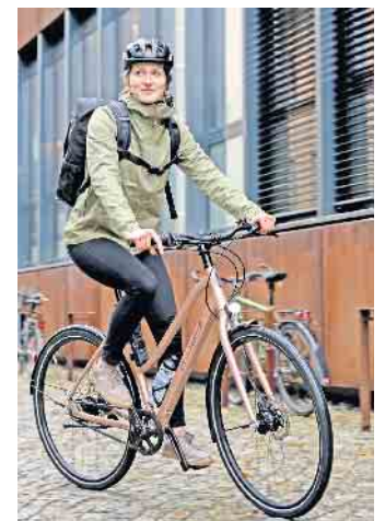
Durch die Stadt radelt es sich am besten mit Citybikes. In der modernen Variante Urban Bike punkten sie mit Purismus und Schnelligkeit.

Noch bequemer wird es mit Elektroantrieb: „E-Bikes werden von Jahr zu Jahr beliebter. Sie bieten eine tolle Möglichkeit, auch längere Strecken ohne große Anstrengung zurückzulegen.“ Außerdem sind E-Bikes mit vielen Zusatzfunktionen ausgestattet, die sich