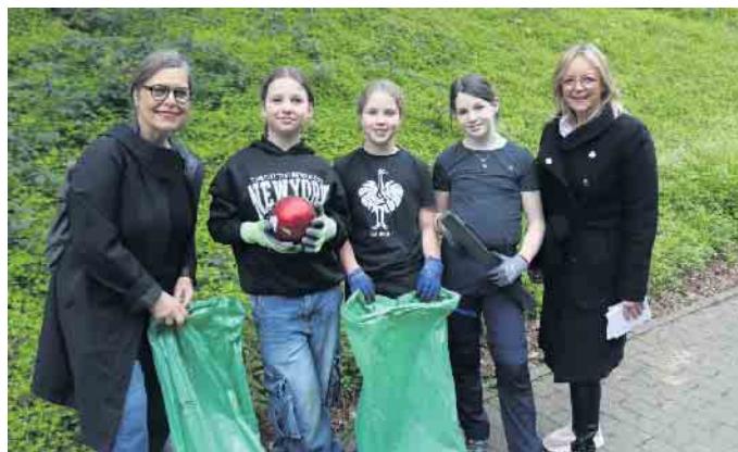
Weihnachten könnte kommen: Der Christbaumschmuck landete allerdings richtigerweise im Müllsack.

Arbeitsstunden aufwenden. Die entsprechenden Personalkosten beliefen sich auf rund 2600 Euro. Nicht eingerechnet ist dabei der Fahrzeugaufwand für den Abtransport. Für die reinen Entsorgungskosten - ohne Containermieten - mussten aus der Stadtkasse rund 15.500 Euro aufgewendet werden.