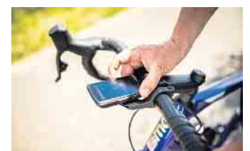
Mit zeitgemäßem Zubehör lassen sich auch ältere Räder gestiegenen Anforderungen anpassen.