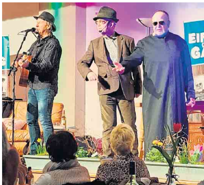
Auftritt in Tondorf, wo die „Eifel-Gäng“ erst vor wenigen Wochen zuschlug.

Für Essen und Trinken beim Mutscheider Gastspiel sorgt der Wirt. Karten im Vorverkauf (16 Euro) gibt es unter Tel.: (0 22 57) 14 70 und an der Abendkasse (18 Euro). pp/Agentur ProfiPress