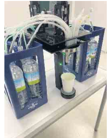
Der „Barkeeper“ - Für Technikinteressierte: Die Steuerung des Druckluftgebers, der in X, Y und Z-Richtung voll beweglich ist, übernimmt ein selbst programmierter Microcontroller vom Typ ESP32.