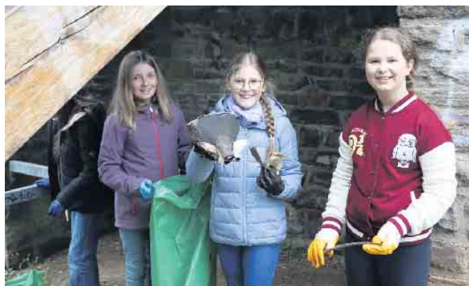
Ein Fahrradsattel zählte zu den „Schmuckstücken“, die die Schülerinnen des St. Michael-Gymnasiums aus dem Gebüsch zogen.