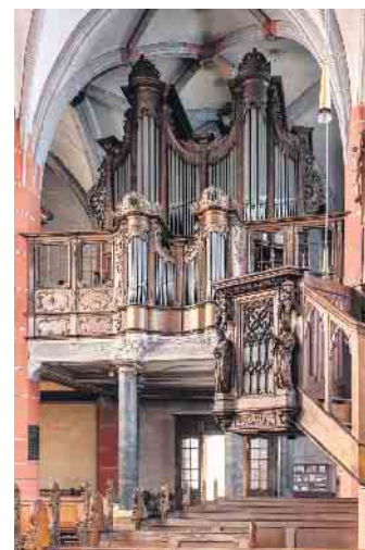
Die historische Orgel der Schleidener Schlosskirche stellt ein beeindruckendes Zeugnis rheinischer Orgelbaukunst der Barockzeit dar.

geborene Organist, eignete sich in seiner Jugend das Orgelspiel autodidaktisch an. Von 1989 bis 2019 war er Organist an der König-Orgel der Basilika Steinfeld und organisierte die „Steinfelder Vesperkonzerte“ mit dem weithin bekannten „Internationalen Orgelsummer“. Er ist nun Organist der Schlosskirche zu Schleiden und als hauptverantwortlicher Kirchenmusiker in der GdG Hellent-