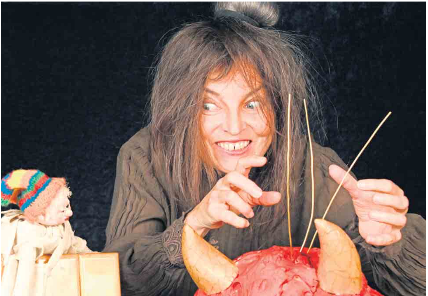
Das Glückskind bei der Großmutter des Teufels.

53894 Mechernich (Eifel) Bahnstraße 8 / Ecke Marktplatz Kundendienst-Ruf: 02443-2424 www.betten-schmitz.de