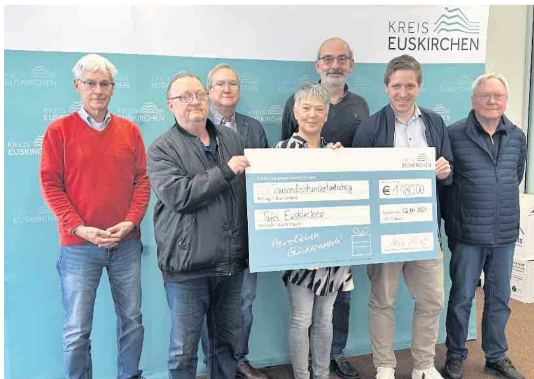
Über eine Spende von je 1.180 Euro durften sich die Tafeln aus Euskirchen, Züllich, Weilerswist, Mechernich, Kall und Bad Münstereifel freuen.

Das Geld stammt aus den Erlösen des traditionellen Prinzenempfangs im Kreishaus Euskirchen, wo dieses Jahr 35 Karnevalsgesellschaften ihre Tollitäten präsentiert hatten. „Das ist der höchste Erlös seit vielen Jahren“, freute sich Landrat Ramers, bevor er den Tafeln in Bad Münstereifel, Euskirchen, Weilerswist, Züllich, Mechernich und Kall je einen Scheck über 1.180 Euro überreichte. „Es ist wichtig, dass die ehrenamtliche Arbeit der Tafeln unterstützt wird. Sie leisten einen großen Beitrag für bedürftige Menschen in unserer Gesellschaft.“ Die Vertreter der einzelnen Tafeln nutzten den Termin, um einen kurzen Einblick in die aktuelle Situation zu geben. Auch wenn sich die Lage je nach Tafel im Detail unterscheidet, so arbeiten sie doch alle