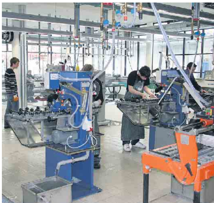
Ausbildung in der Flachglasindustrie.