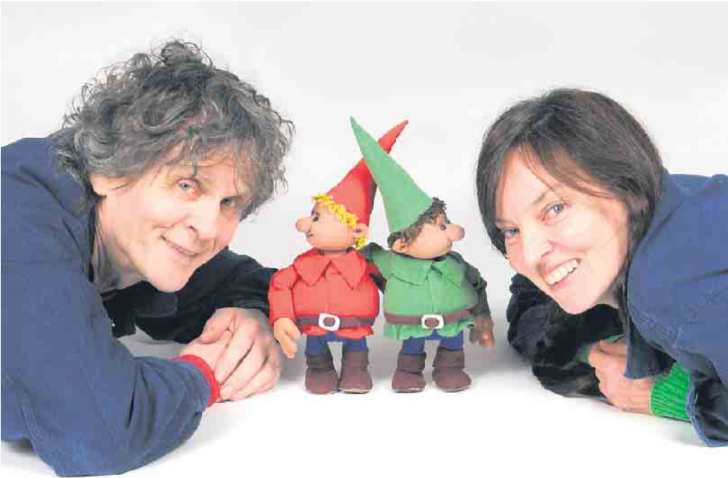
Himpelchen und Pimpelchen mit ihren beiden „Lehrlingen“.

Reservierungswünsche, die erst am Tag der Veranstaltung eingehen, können möglicherweise nicht mehr berücksichtigt werden.