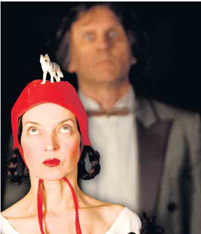
Rotkäppchen mit Wolf.

und macht sie zum perfekten Soundtrack für sommerliche Roadtrips und laue Nächte am Lagerfeuer mit Freunden. Da sind sie hier in der Eifel gerade richtig aufgehoben! Viele Hörbeispiele von diesem sympathischen und außergewöhnlichen Duo findet man auf allen gängigen Plattformen (Youtube, Apple, Spotify...). Der Eintritt ist frei, Spenden sind jedoch wie immer erwünscht. Weitere Infos und Reservierung per E-Mail unter: kultur@bs-bam.de. Scheunenbühne Witscheiderhof, Wilhelmstraße 33 a, Bad Münstereifel. Die Veranstaltung wird von der Westenergie AG unterstützt.