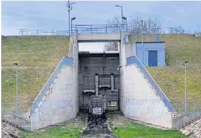
... und -auslass am Hochwasserrückhaltebecken Neuwürschnitz (Dammhöhe 12 bis 13 Meter).

sertschutzlager für jede Flussmeisterei, in denen Sandsäcke und Schutzplanen zum Schutz von Deichen und Dämmen vorgehalten werden. Neben der baulichen Unterhaltung durch die LTV wurden Maßnahmen zur Gefahrenabwehr auf örtliche Wasserwehren, die teilweise von den Feuerwehren wahrgenommen werden, übertragen.