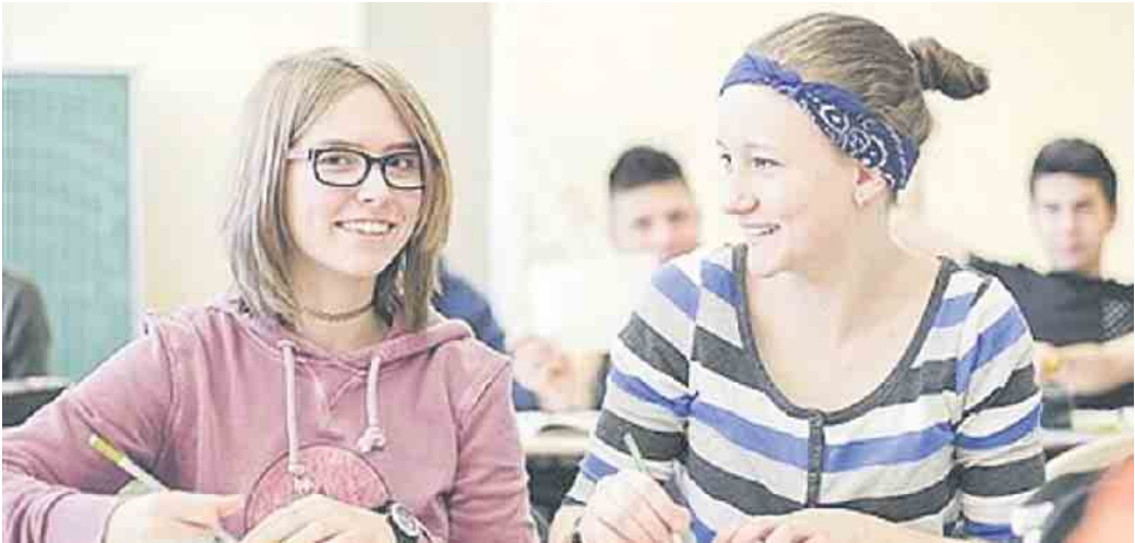
Egal ob schulische oder duale Ausbildung - Unterricht im Klassenzimmer gehört dazu.

zu Bundesland unterschiedlich lauten. Schulische Ausbildungen im Bereich Gesundheit und Pflege sind jedoch bundesweit über die entsprechenden Ausbildungsverordnungen geregelt. Die Prüfungen finden vor einem Prüfungsausschuss bei den einzelnen Schulen statt. (wwp)