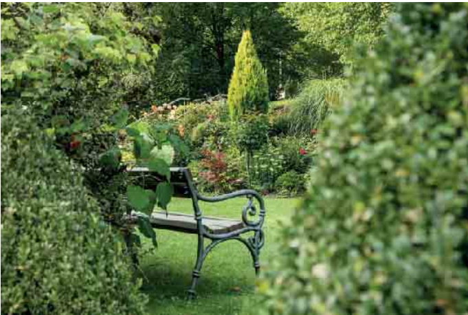
Rasengrab oder Bestattung im Blumengarten.

Urnenwand, Blumengarten oder klassische Beisetzung