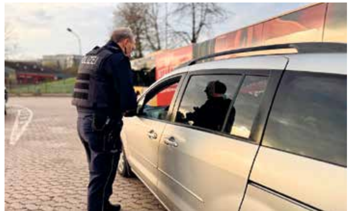
Bezirksdienst Mechernich an der Grundschule in Mechernich (Gurtkontrolle)

Die Polizei Euskirchen appelliert an alle Verkehrsteilnehmer, immer angeschnallt zu fahren - für mehr Sicherheit auf unseren Straßen.