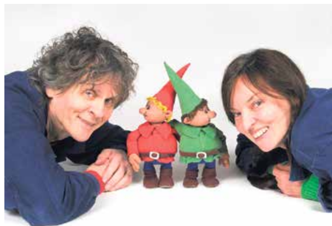
Himpelchen und Pimpelchen mit ihren beiden „Lehrlingen“.

Tickets gibt es an der Tageskasse; Kartenzahlung ist nicht möglich. Es wird empfohlen, unter 02257-4414 oder unter kulturhaus@theater-1.de zu reservieren.