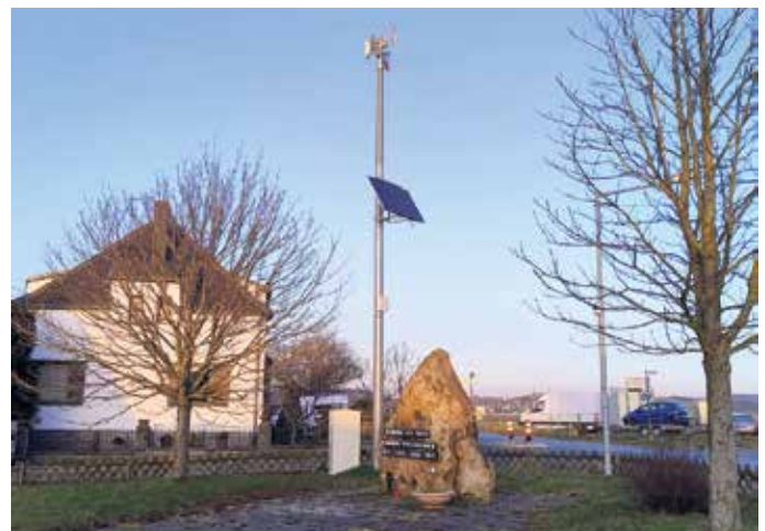
Der neue Sirenenmast an der Cicerostraße in Kalkar ist Teil der Erweiterung des städtischen Sirenenetzes und dient künftig der Warnung der Bevölkerung im Ernstfall.

Erweiterung des städtischen Sirenenetzes beschlossen. Damit soll eine nahezu 100-prozentige Abdeckung des bewohnten Stadtgebiets mit einem Schalldruck von mindestens 80 dB (entspricht etwa der Lautstärke einer Hauptverkehrsstraße) erreicht werden. Alle Sirenen ermöglichen Sprachdurchsagen mittels vorgefertigten Textbausteinen sowie in Echtzeit. Die neuen Sirenen können bei einem Stromausfall 20 Tage lang ohne externe Stromzufuhr betrieben werden. Die Anschaffung der Sirenen wird durch das Sirenenförderprogramm 2023 des Landes NRW zu 40 Prozent gefördert.